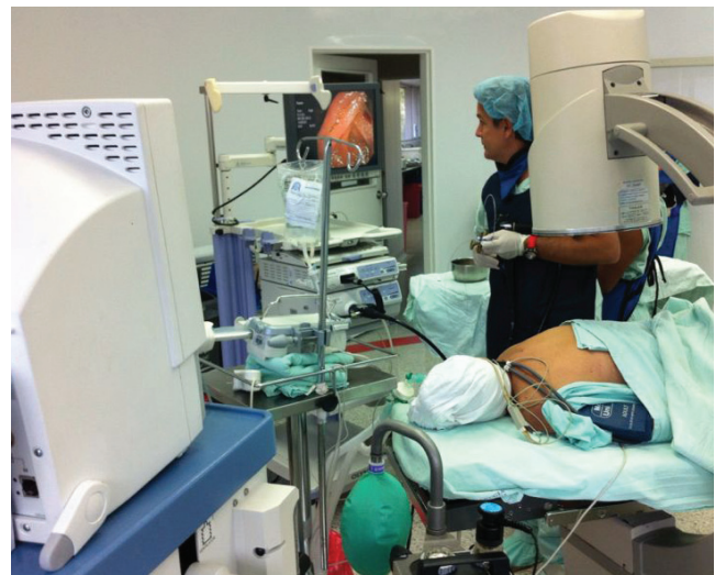
FIGURA 1. Colangiopancreatografía retrógrada endoscópica

El procedimiento se llevó a cabo en una sala de cirugía convencional, con el paciente bajo anestesia general con intubación orotraqueal y en decúbito prono. El endoscopista inició la colangiopancreatografía retrógrada endoscópica, con apoyo imaginológico con brazo en C, en una mesa quirúrgica traslúcida y con endoscopio de visión lateral (figura 1). En caso de que el endoscopista