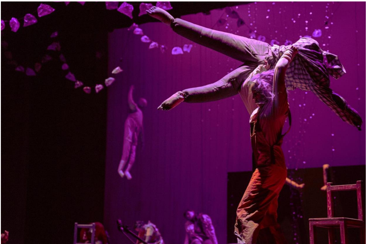
Imagen 4 - Año Viejo. Al Paso escénico / Camilo Torres / 2022

entender el cuerpo, entender el movimiento del trapo, como se puede mover eso, avanzadas, los apoyos, entender todo el lenguaje que la obra me estaba posibilitando, llevo mucho tiempo además porque queríamos darnos ciertos retos, nos gusta ponernos retos, porque venimos de una línea más experimental, no tan esquemática, si no más líquida, más de la acción, más de la interpretación, y en este caso dijimos queremos coreografía dentro de nuestra forma, sin perderla, ¿cómo podemos hacer la coreografía? Y fue muy difícil. (Moreno, 2022)