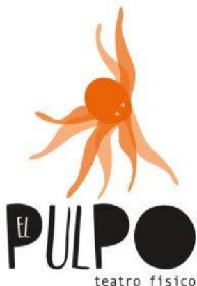
Imagen 1 - Logo de El Pulpo.

El Pulpo Teatro Físico es una compañía artística, dirigida por Juan Fernando Vanegas Vasco, dedicada a la creación de espectáculos escénicos donde el cuerpo del actor y su potencial expresivo son el foco de estudio y herramienta poética privilegiada. Para Vanegas hay un interés particular en la construcción corporal de sus obras “a veces construimos un material coreográfico que nos arroja información dramática y a partir de eso, a modo de creación colectiva, generamos momentos, escenas u obras” (Vanegas, 2022)