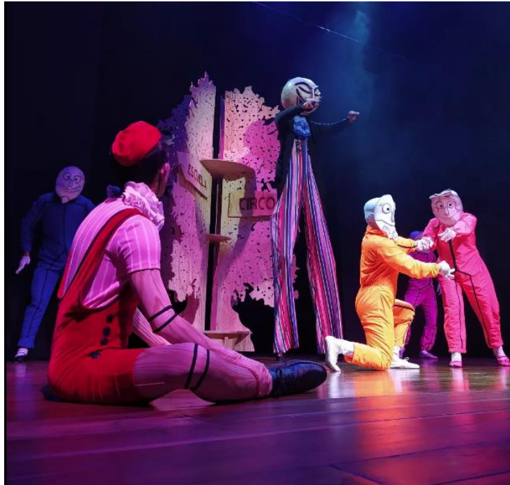
Imagen 2 - Pinocho Corazón.

encontrando otras y se va construyendo algo que es variante. (Vanegas, 2022)