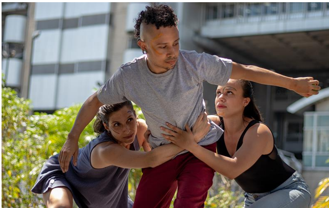
Imagen 9 – EntreTanto.

Yo creo que lo que se vuelve más interesante de ver a un artista en escena es ver lo que esa persona es, porque uno empieza a sacar... yo en este momento me siento “empelotándome”, yo improviso y es como uno desnudarse, si logro entrar en ese estado que a veces es complejo... y ponerse ahí con todo lo que uno es, lo bueno, lo malo, lo bonito, lo feo, lo chiquito, lo grande, lo que le gusta, lo que no le gusta, ósea toda la mierda que trae, pero finalmente eso es todo lo que somos y es lo que hace que uno se enganche con alguien cuando uno lo está viendo. (Idárraga, 2022)