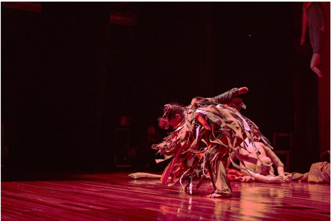
Imagen 6 - Año Viejo. Al Paso escénico / Camilo Torres / 2022

Lo que uno genera también es pensar, que el intérprete piense, se cuestione, se pregunte... se sienta bloqueado, no sabe qué hacer, para donde voy, que es esto, no me entiendo... hay que seguir encontrando, todavía no ha aparecido, no se convenza que ya apareció... y para llegar a ello es con el tiempo, de ir haciendo, y no tiene relación con la experiencia que tengas en la escena, más bien con la habilidad de ver la vida desde otras perspectivas. (Moreno, 2022)