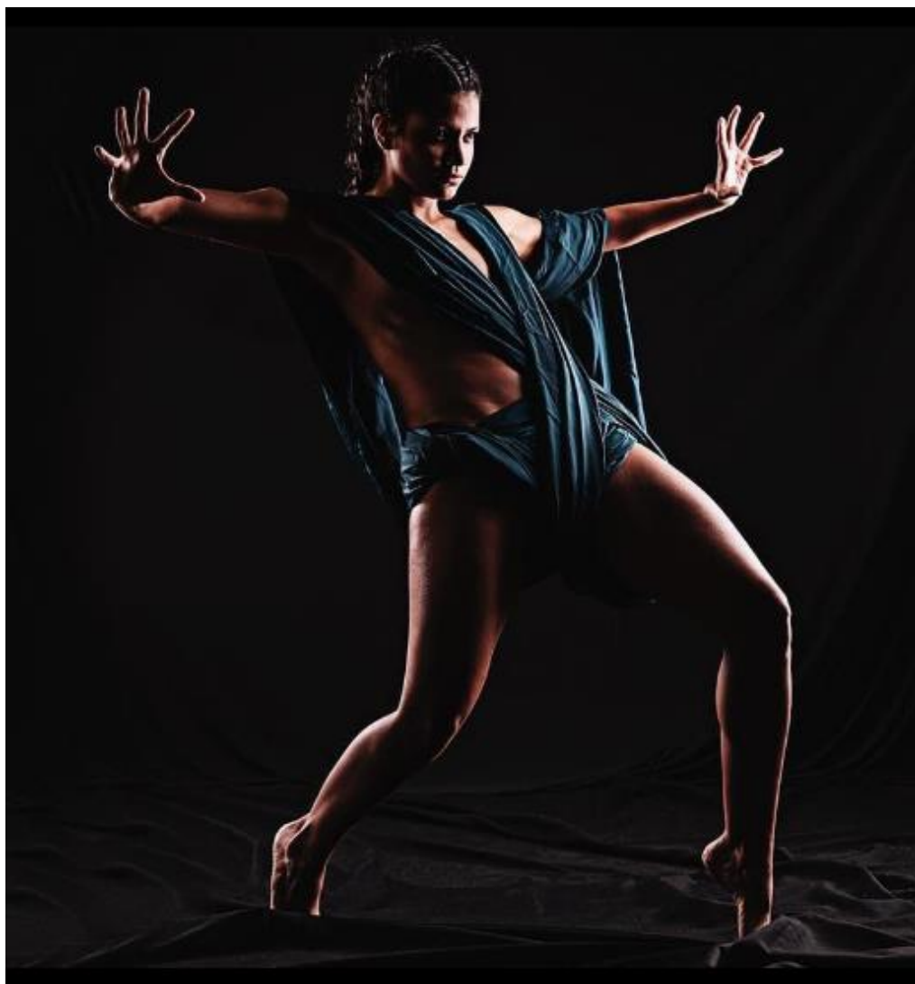
Imagen 12 - Entre la lealtad y la duda. Foto: @hectocol. Periferia / Bienal de Cali / 2019

Flórez expresa que hay muchas cosas por decir y, lo más importante independiente del rol que esté desempeñando en algún proceso, su cuerpo es suyo y su voz es suya. Claramente esos lugares tan íntimos de reflexión, el llegar a estados altos de conciencia, encontrar rutas y quererlas compartir, hacen parte del interminable recorrido, pero empieza a notarse que cada intérprete tiene una voz particular y que quiere usarla, todo ello acompañado de la necesidad de crear.