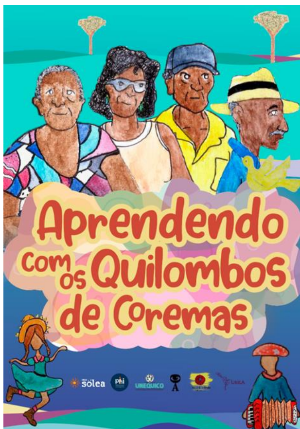
Figura 8 — Capa da cartilha Aprendendo com os quilombos de Coremas