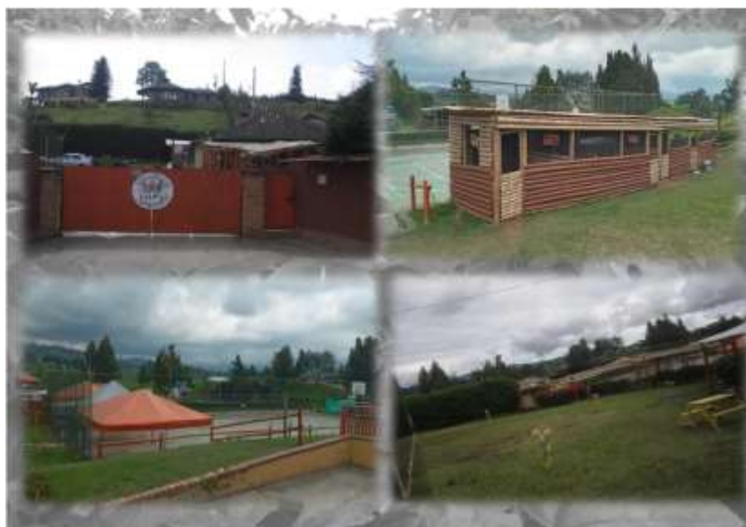
Figura 1 Instalaciones de la Institución Educativa LEKGS