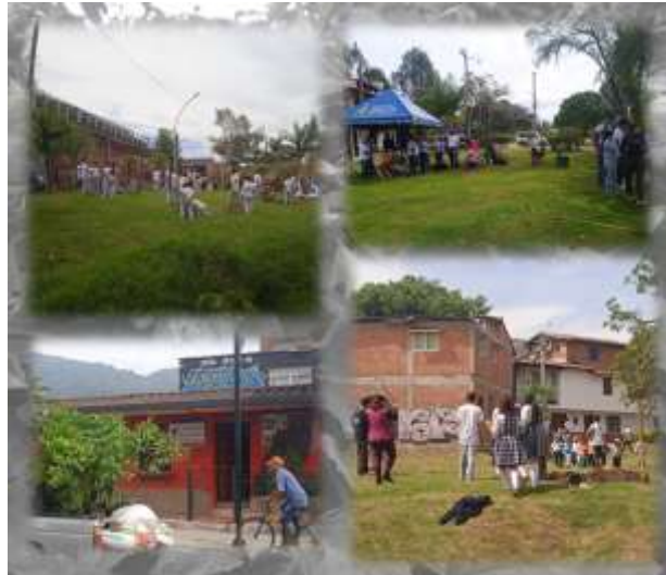
Figura 22 Sembratón