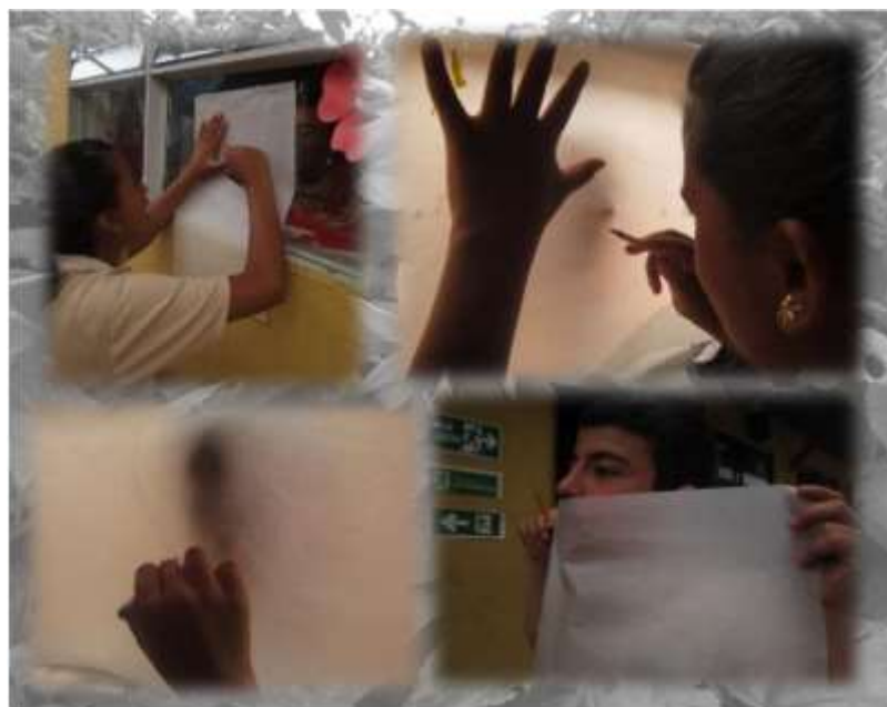
Figura 13 Experimentación. Dibujo entre Brumas