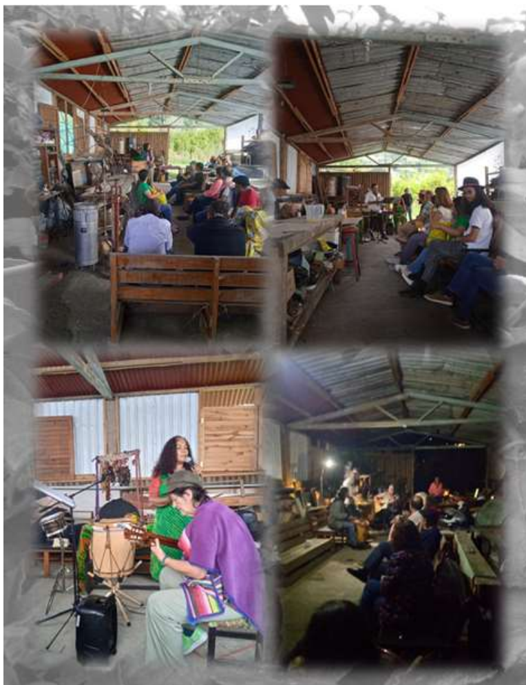
Figura 21 Ritual cultural y siembra de árboles