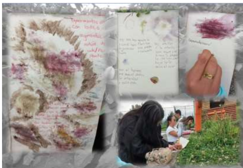
Figura 7 Experimentación y sensibilización: el sol como referente de toda la existencia