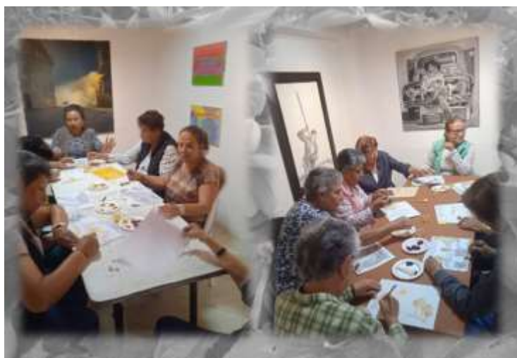
Figura 18 Experiencias