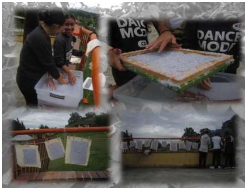
Figura 9 Desarrollo y creación de papel artesanal usando papel reciclado