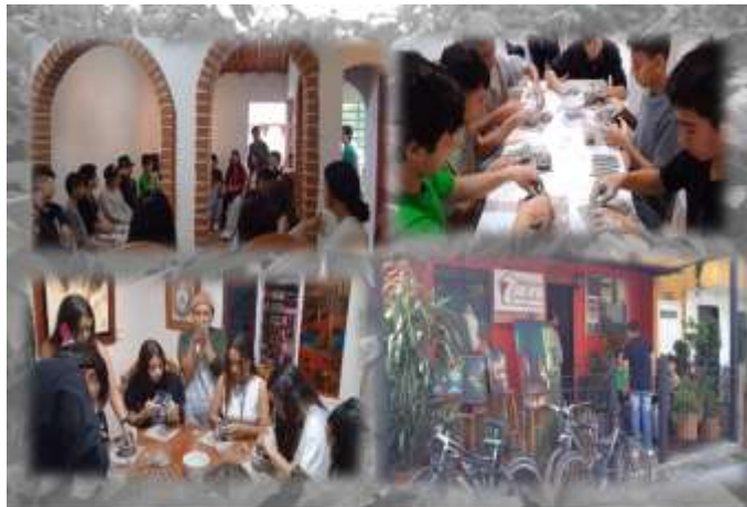
Figura 15 El aire que respiramos