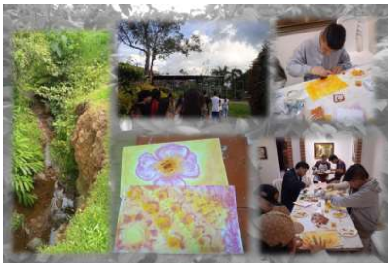
Figura 16 Patrimonio natural y Crisis ambiental: elementos aire y luz