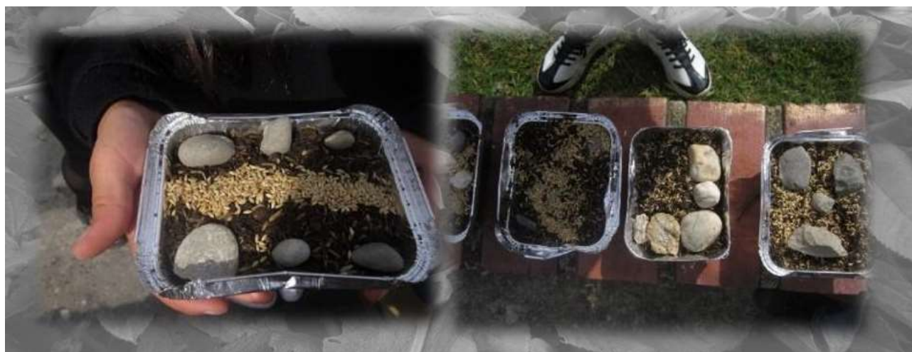
Figura 10 Experimentación y creación artística “Almacigos”