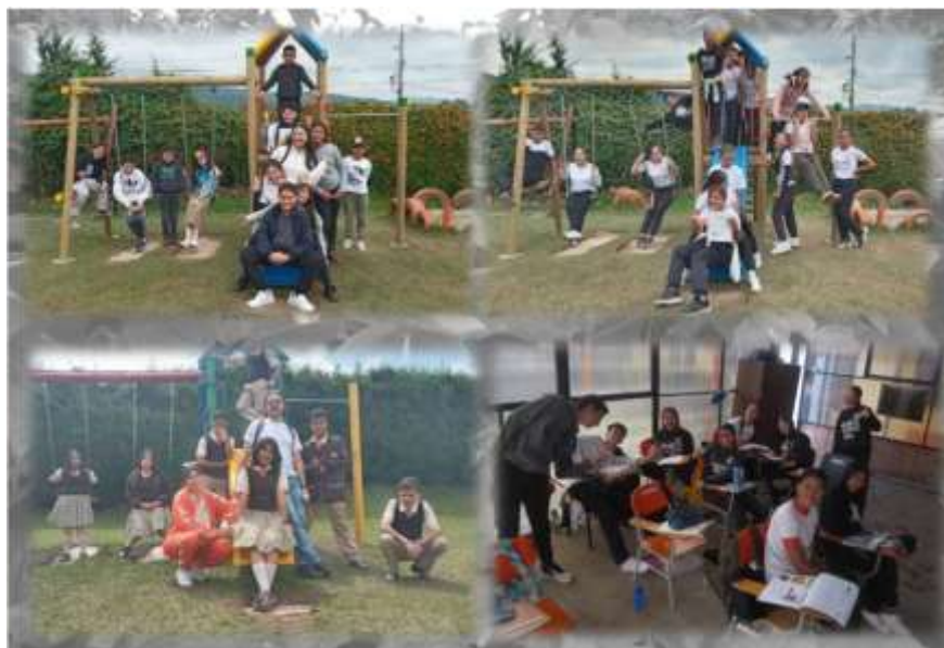
Figura 2 Grupos 6°, 7°, 8° y 9°. Población Participante