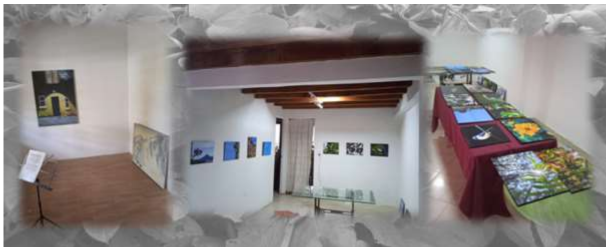
Figura 19 Reconocimiento y recreación