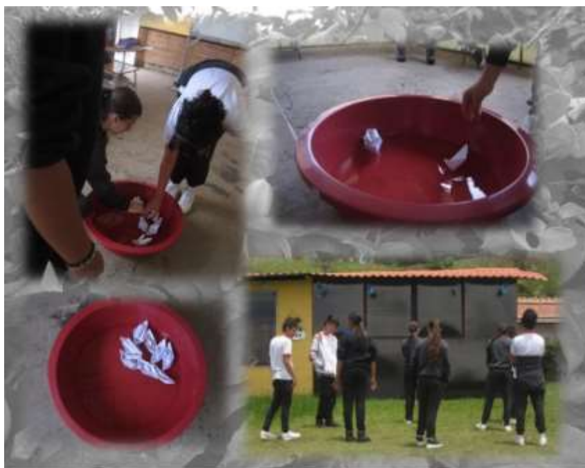
Figura 12 Reflexión: el agua como medio de relacionamiento