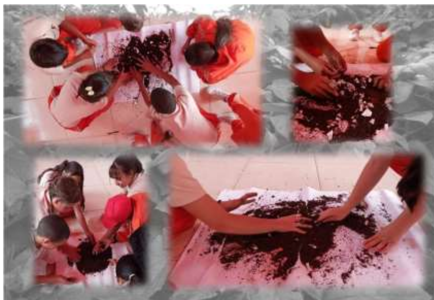
Figura 6 Experimentación. La tierra como material y elemento provocador de reflexiones artísticas y conceptuales