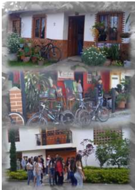
Figura 15 Conservación de recursos hídricos: elemento agua