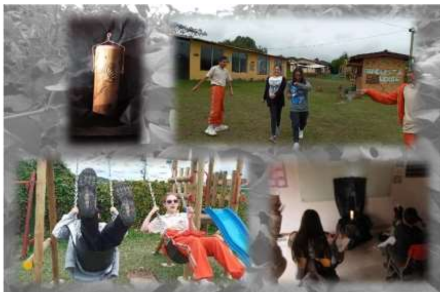
Figura 4 Experimentaciones con el aire al correr, caminar y columpiarse. Dispositivo de incienso, observación y dibujo