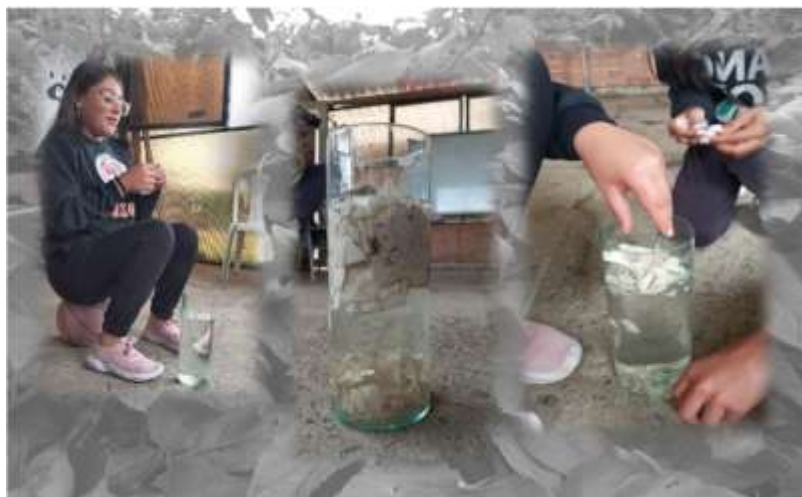
Figura 5 Experimentación y reflexión artística: el agua como medio