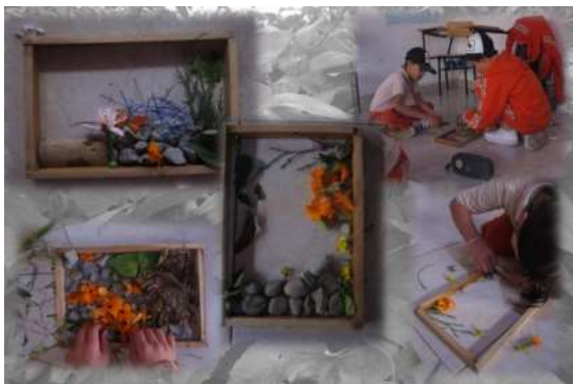
Nota. Fuente archivo propio, 2023.