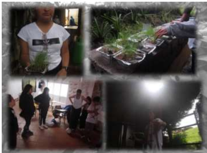
Figura 14 El Jardín paisaje “Relación con el sol”