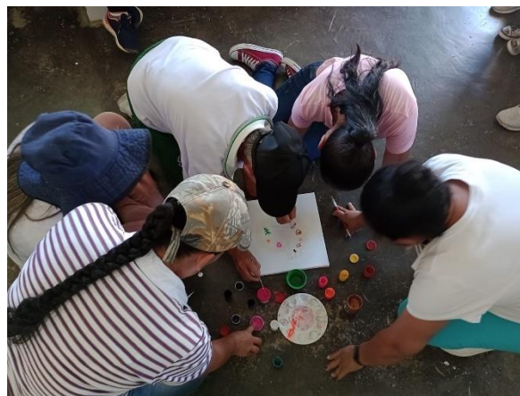
Figura 12 Otros roles

Se ha abordado hasta ahora el primer rol, hemos hablado de la historia de nuestras abuelas, nuestras madres, hermanas y amigas que con la palabra sentida nos han sabido guiar en este caminar. Hemos recordado las luchas de las mujeres y cómo gracias a ellas hoy podemos tener muchas más oportunidades, reflexionamos sobre las mujeres que fuimos, las que somos y las que queremos ser.