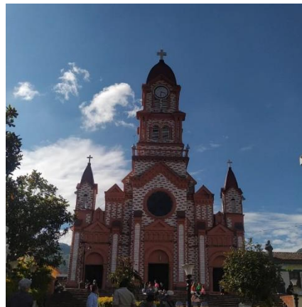
Figura 1 Iglesia de Granada

El municipio de Granada cuenta con zonas de variados climas, fríos, calientes y templados lo que permite tener una gran variedad de productos como la caña, las papas, moras, algunas verduras, frutas y granos también. La población granadina según las últimas encuestas registra más de diez mil habitantes, de acuerdo con la información recolectada por el Departamento Administrativo Nacional de Estadística (DANE) en el censo del año 2018, el municipio cuenta con una población total de 10.117 personas, distribuidas de la siguiente manera: 5.541 personas (54.77%) en la cabecera y 4.576 personas (45.23%) en la zona rural dispersa y el centro poblado y cuenta con una densidad poblacional de 54.69 hab/km 2 . (Plan de Desarrollo Municipal 2020-2023).