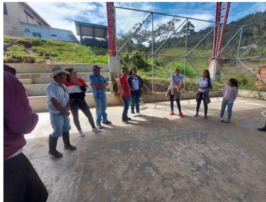
Grupo Comunitario San Matías

La Cascada tal vez por su ubicación, su clima y su historia presenta dinámicas de relacionamiento distintas, un poco cerradas y temerosas al diálogo, formas de comunicación complejas las cuales requieren del acompañamiento por parte del programa y que así se ha estado haciendo. No obstante, son personas que tienen la fuerza impecable, que el paso de los años les ha