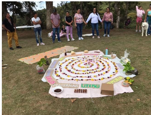
Figura 13 Mandala

Otro momento significativo estuvo intencionado para la construcción de atrapasueños, con el fin de generar la reflexión en torno a los sueños cumplidos y los que queremos cumplir en este proceso, además nos preguntamos cuales habían sido los sentires durante la ejecución de la propuesta por medio de algunas preguntas ¿Cuáles son los sueños que tengo como mujer, madre o amiga? ¿qué es lo que he logrado transformar a lo largo de este tiempo? ¿cuál es la conexión que la mujer tiene con el territorio? Y ¿cuáles son las huellas que estoy dejando en este caminar? Cada una de las respuestas fueron pensadas y escritas por las mujeres de las diferentes veredas, por medio de subgrupos interveredales, plasmaron sus aprendizajes y conocimientos en el atrapasueños.