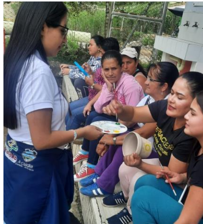
Figura 15 Reciprocidad

Iniciando el segundo ciclo de la propuesta hablamos sobre el bien común, el cuidado que hacemos de las cosas que generan bienestar a una comunidad y a un territorio, para eso indagamos en primera instancia cuales eran los conocimientos que tenía frente a este tema y luego continuamos conectando estos saberes con el tema principal, pues el bien común es una base para fortalecer la comunalidad. En ese sentido, hemos propuesto realizar mingas o combites con el fin de poner en práctica los aprendizajes en torno a esto y así poder seguir reafirmando estos vínculos que sujetos, familias y comunidades.