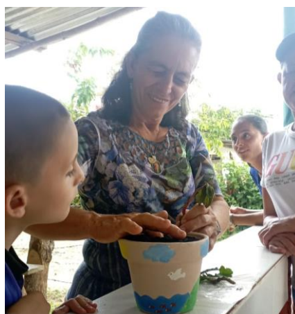
Siembra de planta en La Merced