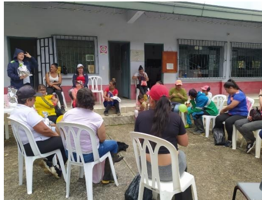
Grupo comunitario La Cascada

A estos grupos se une uno nuevo en la vereda La Milagrosa, que hace algunos meses se conformó y al que se ha logrado llegar de manera positiva, pues son personas cálidas y abiertas lo que ha permitido realizar en primera instancia un acercamiento diagnóstico para determinar los temas y las necesidades que se pueden trabajar desde el Programa Psicosocial. Para los grupos comunitarios gratitud y aprecio, también la invitación a seguir siendo comunidad, a seguir cuidando del territorio, a tejer juntos y a ser comunidades fuertes, resilientes y recíprocas.