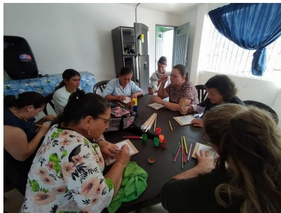
Figura 5 Mujeres Los Medios

Los grupos del Roble y La Merced han estado acompañados por las profesionales y las compañeras practicantes, no se tuvo un acercamiento amplio con estas veredas debido al cruce de fechas y encuentros. Sin embargo, se ha conocido que al igual que en Santa Ana, La Merced tiene una panadería que ha permitido generar formas de vida distintas y productivas. Así mismo, El Roble caracterizado por la alegría imparable de cada una de las mujeres, en el poco tiempo que se compartió aprendimos las unas de las otras, el abrazo, el saludo y la sonrisa son aspectos que nos permiten reconocer la gran labor que se está dando desde el acompañamiento del Programa Psicosocial.