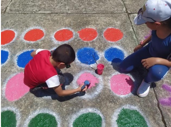
Figura 16 Minga en La Cascada