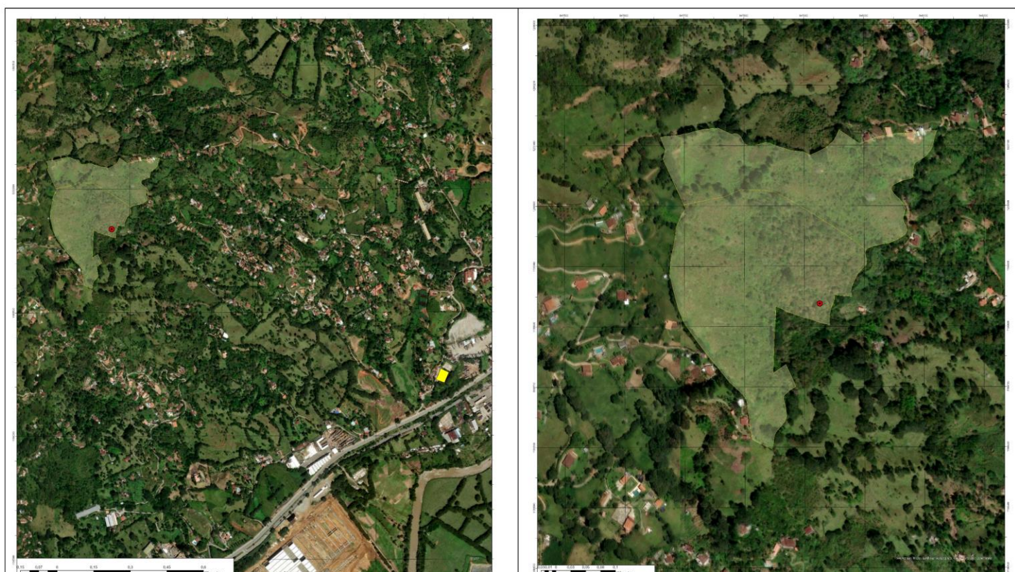
Figura 1 Ubicación del predio la Linda, teniendo como referencia la sede del Consejo Comunitario Afrodescendiente de San Andrés.

El SINAP incluye todas las áreas protegidas tanto públicas como privadas, y el ámbito de gestión nacional y regional. Presentando categorías de manejo, "de acuerdo al nivel de biodiversidad que protegen, su estado de conservación, la escala de gestión y las actividades que en ellas se permitan" (Colombia. Ministerio de Ambiente y Desarrollo Sostenible, 2015).