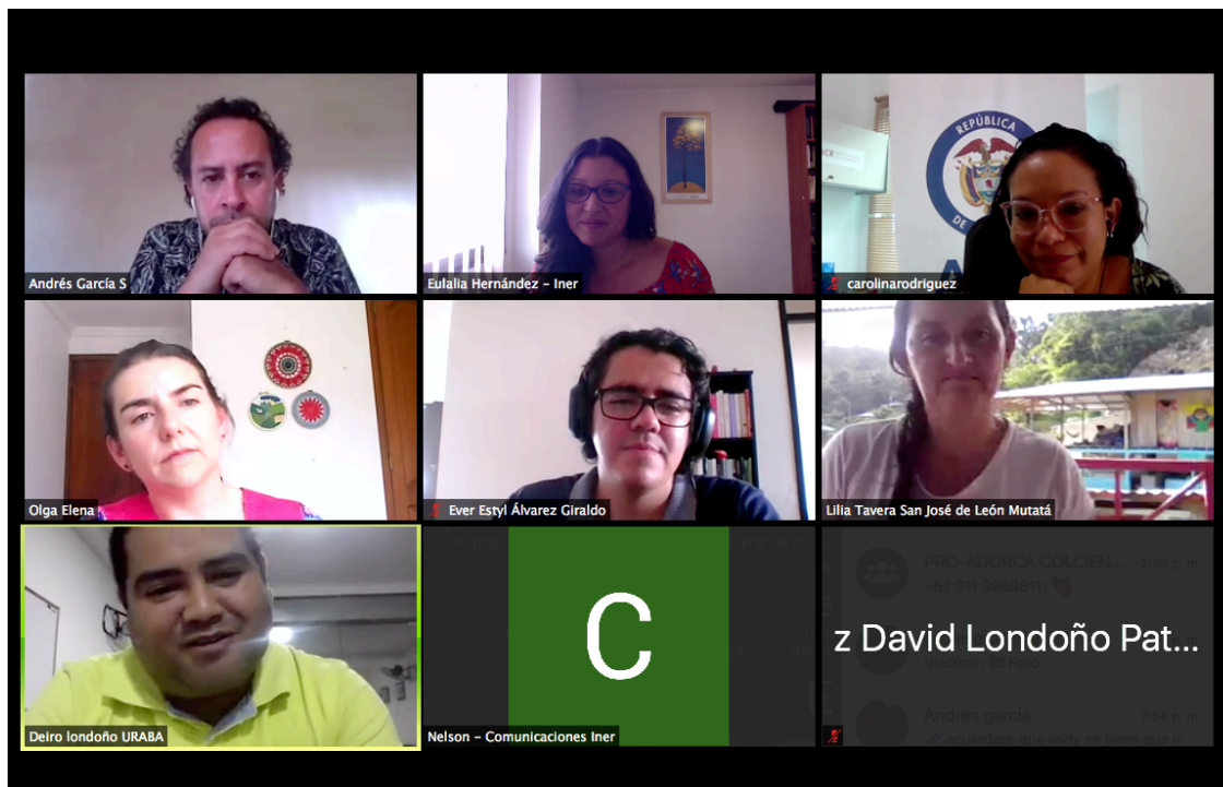
Conversatorio: “Diálogos sociales pendientes: Voces y experiencias de la reintegración y la reincorporación en Urabá y Oriente antioqueño”. Viernes 11 de diciembre de 2020