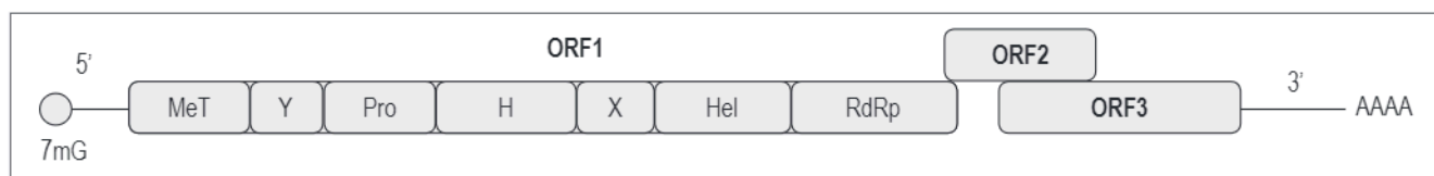
Figura 1. Organización genómica del VHE (17). H: dominio H; Pro: cisteína-papaina proteasa; X: dominio X; Y: dominio Y; 7mG: Cap 7-metilguanina. Modificado de: Panda SK et al. Rev Med Virol . 2007;17(3):151-80.

El ORF2 codifica la subunidad estructural preORF2, que en su forma glucosilada se autoensambla para convertirse en la subunidad de la cápside viral (6, 15). Esta proteína