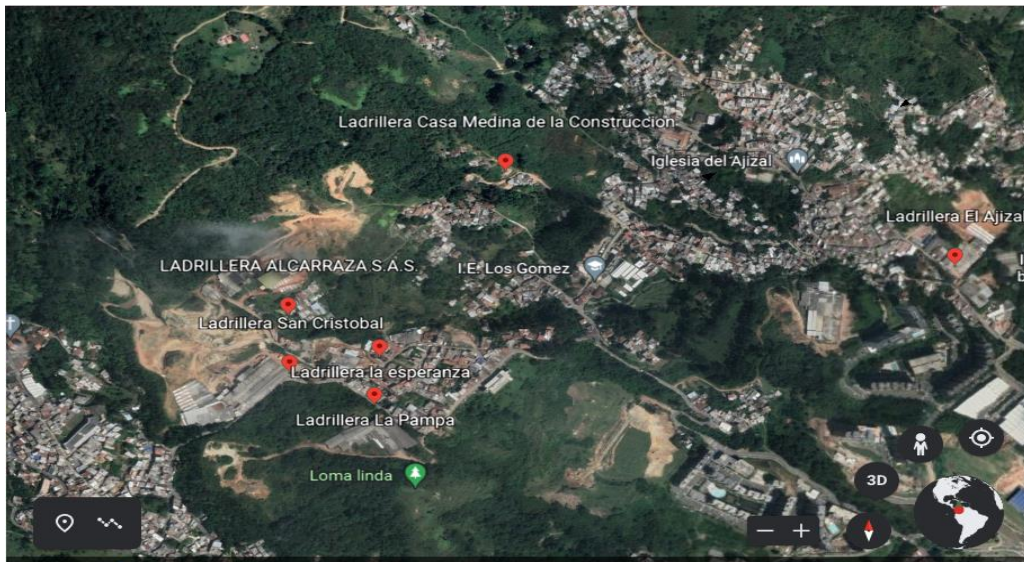
Figura 2. Ladrilleras industriales en la vereda Los Gómez