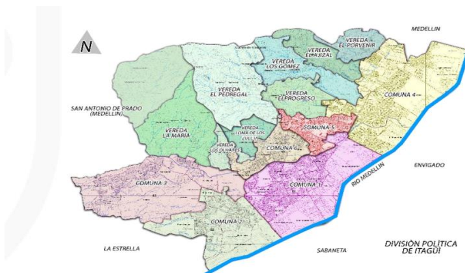
Figura 1. División Política de Itagüí.

Municipios que limitan con Itagüí. División Política.