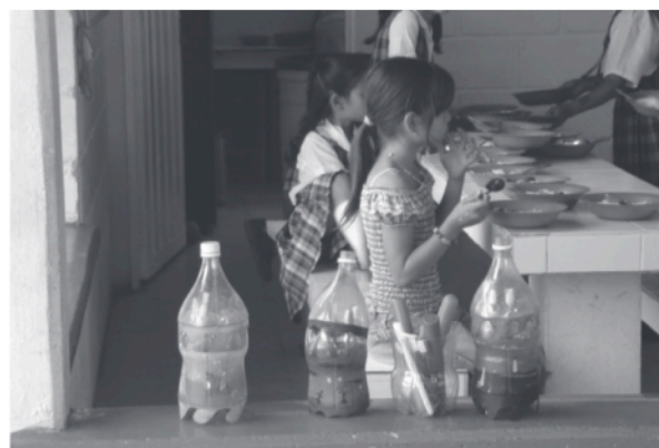
Figura 1. Restaurante Escolar

Otra ganancia del programa fue la recuperación de la salud; además de la disminución de los índices de placa, se trataron los focos infecciosos que presentaban los niños antes del programa, por medio de brigadas de salud, las cuales atendieron las principales necesidades de salud bucal y de salud general, con la prestación de servicios odontológicos para los beneficiarios del programa y de servicios médicos para ellos y sus familias.