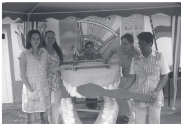
Figura 2. Docentes de la escuela en jornada lúdica

La receptividad de la escuela facilitó la adhesión al programa; aun sin la presencia de los investigadores, la práctica de higiene bucal fue constante durante el tiempo de la intervención; el estado de los cepilleros, con algunas excepciones, fue sobresaliente. A pesar de la pobreza de los padres de familia, si el cepillo se ausentaba del aula de clase, el compromiso era reponerlo, debido a que el niño estaba mucho más acompañado en la escuela. Por supuesto, se encontraron algunas excepciones que se constituyen en los retos de cualquier programa.