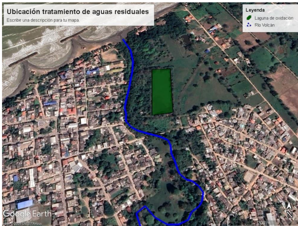
Figura 1. Ubicación de la laguna de oxidación y río Volcán.

El efluente de la laguna de oxidación es descargado a fuentes superficiales menores, el río Volcán y el caño Cementerio, que vierten posteriormente al mar Caribe. El río Volcán recibe los vertimientos de la laguna de oxidación junto con los vertimientos de las viviendas no conectadas al sistema de alcantarillado y el agua que se rebosa en periodos de lluvias provenientes de la estación de bombeo Villa Luz, en cuanto al caño cementerio recibe los vertimientos de los reboses periódicos de la estación de bombeo Pambelé. La Figura 1 muestra la ubicación de la laguna de oxidación.