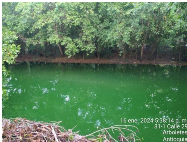
Figura 6. Cauce del río Volcán.

“requiere ser complementado y ajustado a la realidad del saneamiento básico del municipio de Arboletes el cual debe contener programas, actividades y/o proyectos acordes con la necesidad de lograr el 100% del tratamiento de las aguas residuales urbanas”.