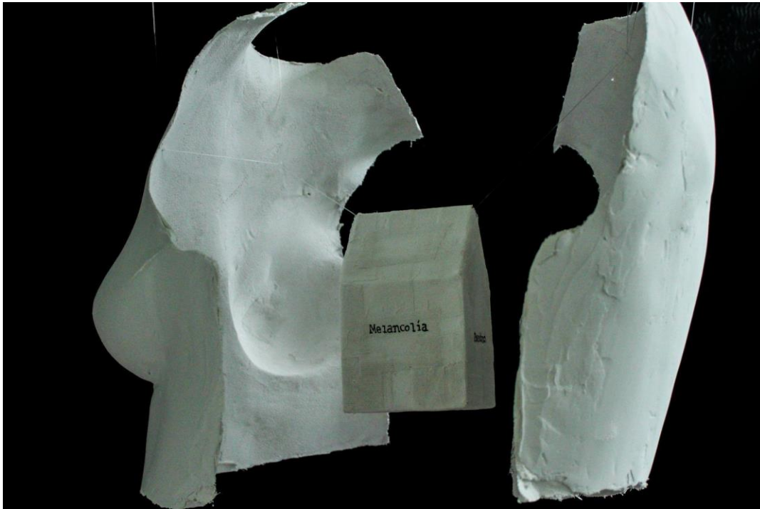
Imagen 2. Arroyave, A. (2020). Mi cuerpo mi casa . Escultura (venda de yeso), dimensiones variables.

Para la sala, cuyo piso está conformado por Heidegger y Bauman, la obra más indicada es Mi cuerpo-Mi casa , una pieza escultórica que surge a partir de la pregunta ¿Cómo estoy habitando los espacios y qué sensaciones o emociones generan estos en mi cuerpo? Con la ayuda de Cartografía pude localizar físicamente eso que sentía, pero quería hacer énfasis en las emociones más recurrentes.