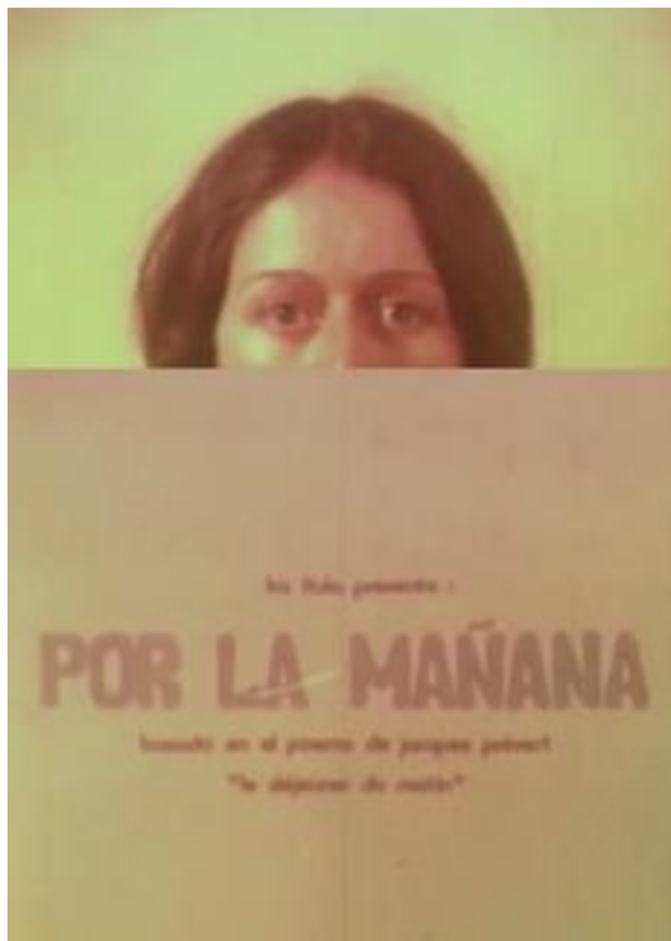
Imagen 9. Restrepo, P (1979). Por la mañana . Vídeo.