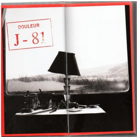
Imagen 10.Figura 9. Calle, S (1985). Dolor exquisito . Dimensiones variables.

En obras como Dolor exquisito y Souris Calle , Sophie logra transformar emociones profundas que la conmueven en obra plástica. Esta artista suele recurrir a su propia vida para crear relatos que llama historias de pared, su principal materia de trabajo es el autoanálisis, no va al mundo exterior para investigar grandes fenómenos, sino que observa sus propios comportamientos, vivencias y emociones para intentar comprenderse a través de su obra y en este proceso encuentra manifestaciones sutiles y logra mostrar su intimidad como algo casi universal, apelando a las emociones del espectador.