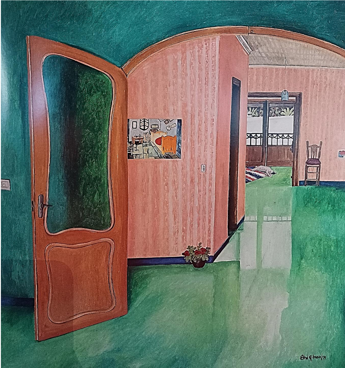
Imagen 12. Gilmour, E. Nuestra casa (Javea, España) (1979) Óleo sobre tela 147x137 cm.

Ha sido referente porque sus pinturas apelan a la sensibilidad del espectador y generan la sensación de calidez y protección propias de un hogar.