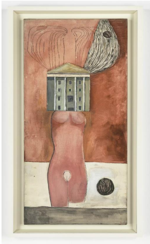
Imagen 11. Bourgeois, L. Mujer-casa (1947) Óleo tinta 91x36 cm.