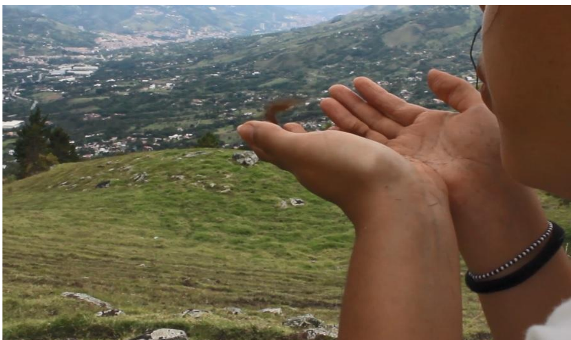
Imagen 3. Arroyave, A. (2020). Esporas . Fotograma tomado de vídeo.

Anteriormente he hablado de la obra Esporas y de cómo fue su creación, de mi necesidad de acercarme a la naturaleza y entregarme al mundo de una manera diferente. Esta pieza surge a partir de unas palabras que me fueron dichas: “el arte es una forma de darse al mundo” (Botero 2020). Hasta ese momento yo venía trabajando mi visión del hogar haciendo énfasis en mi relación de pareja, pero eso que me fue dicho, me hizo replantearme la manera en que estaba abordando mi investigación y notar que no era el momento adecuado para trabajarlo dadas estas emociones eran intensas y desmedidas y que ponían como protagonista o eje central a alguien más, entonces, volví a mí misma, a una introspección y al lugar predilecto para esto: mi habitación. En un primer momento estuve sin rumbo, perdida, confusa y con muchos interrogantes que me llevaron a refugiarme en el universo de Miyazaki, dando como resultado la obra Esporas .