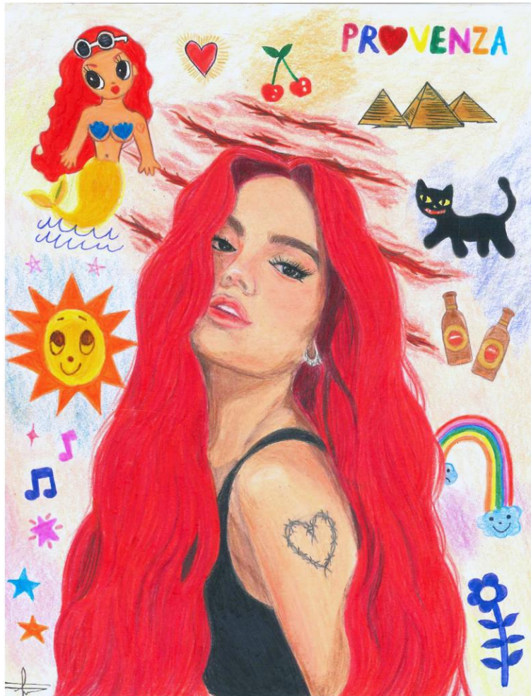
Ilustración de Laura Manuela Cano Loaiza.

Estoy sola en mi pieza. Le subo el volumen al tema que suena ¡Ay, qué rico! Cuando me pone el panty de ladito ¡Ay, qué rico! Ese besito dámelo abajito. Bailo frente al espejo, mientras me imagino en el videoclip de Gatúbela . Paredes húmedas, manos que acarician, culos que se agitan, cuerpos que se deslizan con el sudor, danzas que imitan a las serpientes. Karol, con su nuevo cabello rojo cereza, perreando, en medio de hombres y mujeres que se tocan, que la tocan. Animales en celo, cegados y llevados a una orgía musical... ¡Ay, bendito! En cuatro yo te pongo rapidito. Mmm... bendito, no me coma' tan rico, papacito.