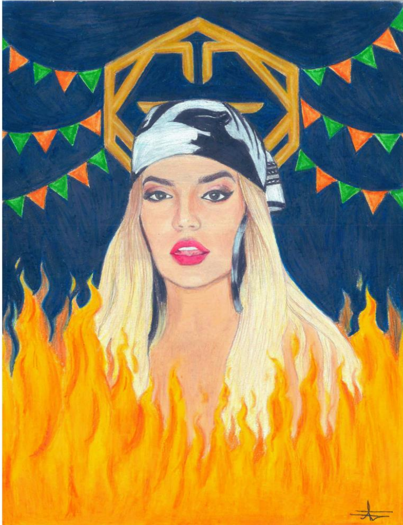
Ilustración de Laura Manuela Cano Loaiza.

En el curso de música empresarial Karol entendió que podía ser cantante sin tener que depender de un sello discográfico. Que la música no solo es un arte y una pasión, sino también un modelo de negocio, la hizo cambiar su decisión...Y por eso regresó a Colombia a componer, a cantar, y a vivir de ello.