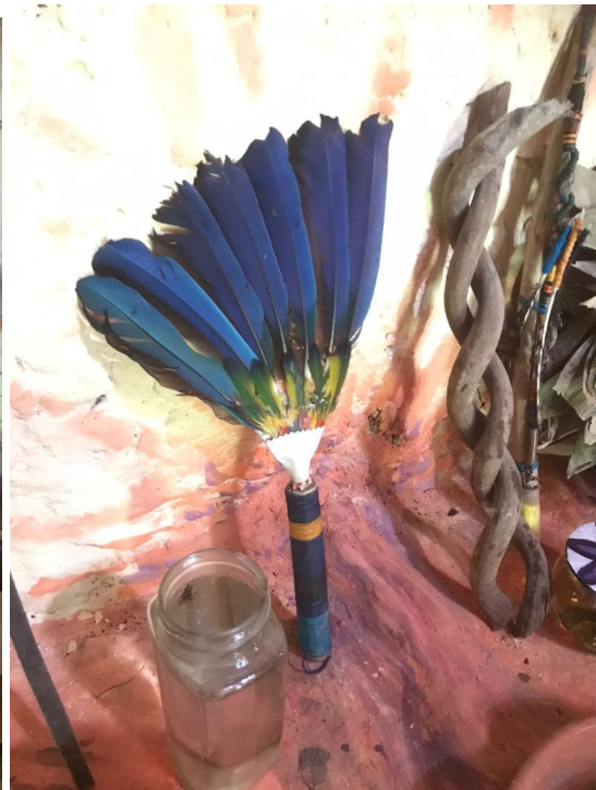
Agua, plumajero para las limpieas, liana.