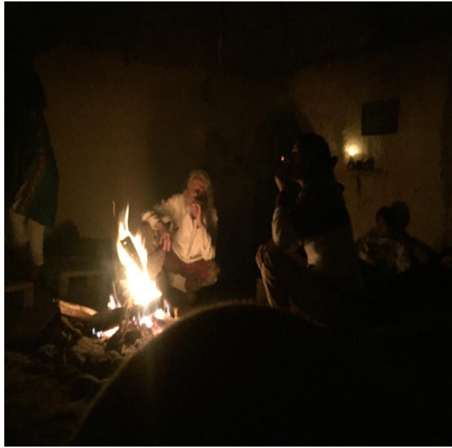
Hombre fuego: Pierre y Natalia Morales