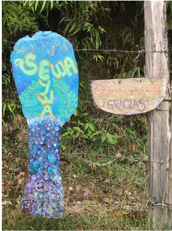
Portón de entrada a Casa Sewa.