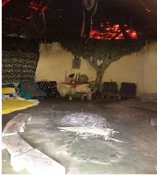
Interior de la maloca El Jaguar.