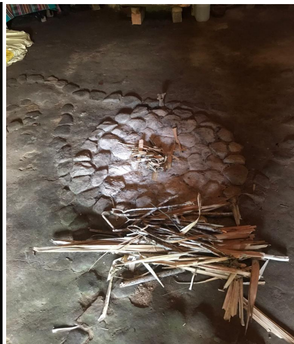
Espacio de fuego y maderos.