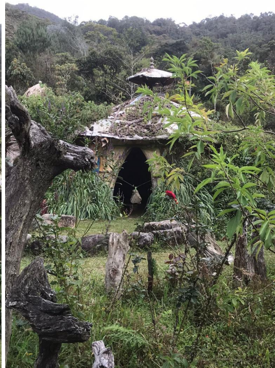
Maloca el Jaguar, vista desde más lejos.