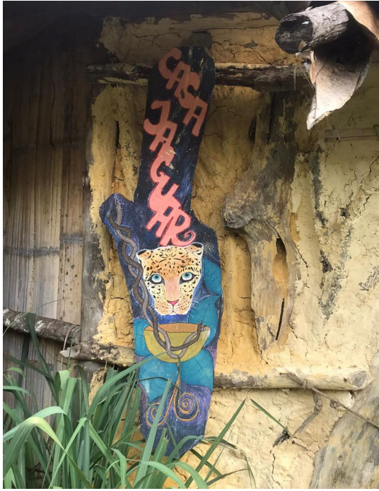
Entrada Maloca El Jaguar.