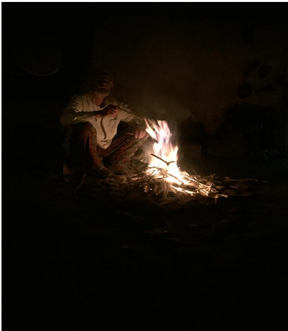
Hombre fuego, fuego ceremonial.