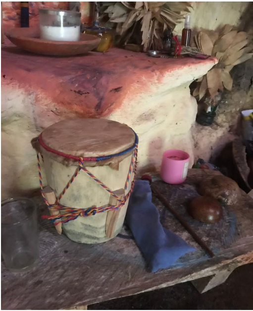
Tambor, velas y wayras.