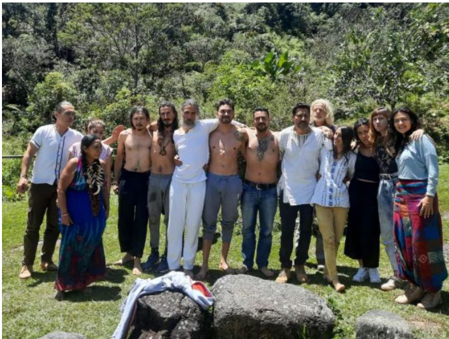
Grupo participante en el ritual de Ayahuasca, Maima Pantera.