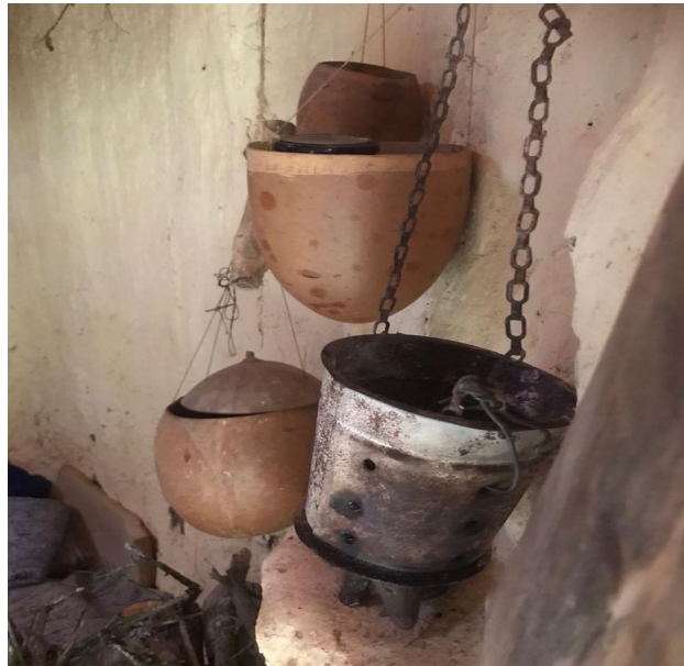
Sahumerios y vasijas de agua. Elementos rituales.