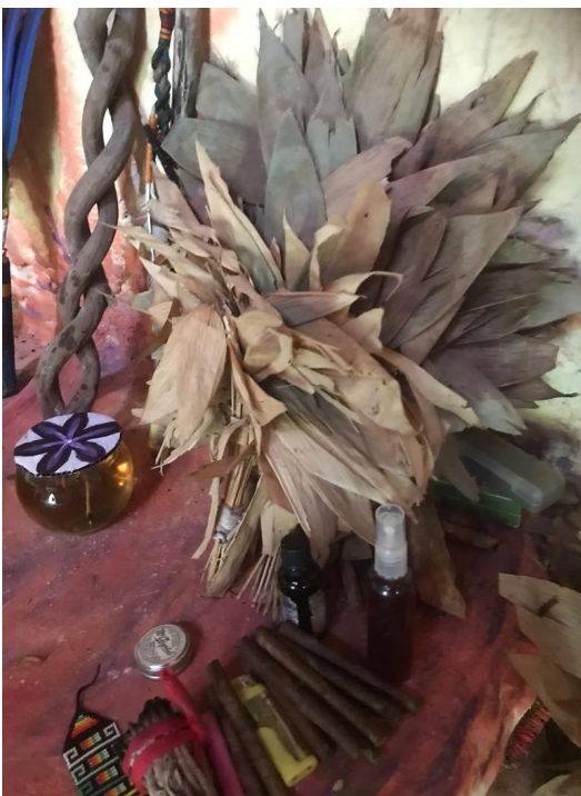
Liana, wayra, tabacos y perfume.