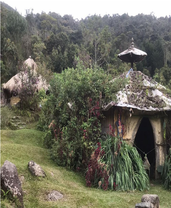
Maloca el jaguar, casa Sewa.