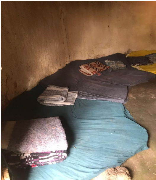
Colchonetas para el ritual.