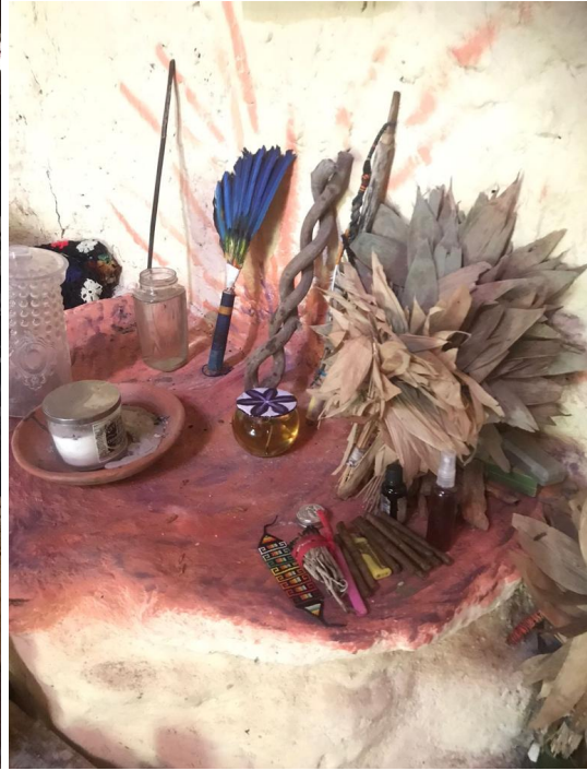
Instrumentos musicales, de la maloca. Objetos del altar. tabacos, wayra, plumajero.