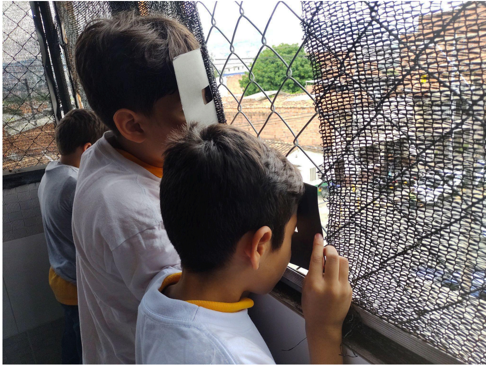
Fotografía 5: Ejercicio “¡Mancha!” .

Registro de exposición: como muestra final de los trabajos realizados en el Laboratorio, se planeó una exposición colectiva con las obras originales de los estudiantes, que pasaron por un proceso de curaduría y museografía, además contaron con un montaje profesional pensado para el espacio en consonancia con el producto artístico. Se cuenta con un registro fotográfico de la exposición.