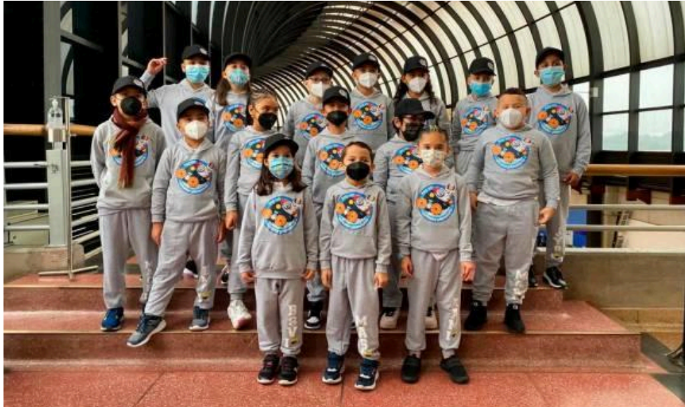
Fotografía 1: Grupo de estudiantes del Centro Educativo Paraísos de Color, 2021

Cultural de Moravia y el Jardín Botánico. Aproximadamente el 60% de los estudiantes viven en la zona que rodea a la institución, es decir, Comunas 3 y 4, el resto provienen de todos los barrios del Valle de Aburrá, incluyendo Bello e Itagüí.