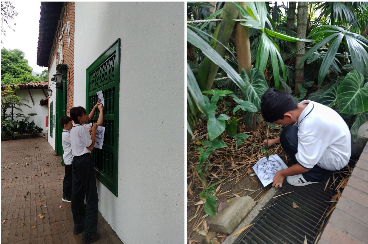
Fotografías 22 y 23: Ejercicio “ Estampa el jardín ”. Archivo fotográfico personal, 2023.

salieron de las zonas comunes, dejando para el aula solo los ejercicios que requerían menos materiales, más quietud y apoyo en pupitres. Esto propició encuentros más dinámicos, las técnicas se relacionaron directamente con el contexto y permitió una exploración más abierta del quehacer gráfico. Finalmente se utilizó el patio interno de la escuela, la terraza del tercer piso, se visitó el Jardín Botánico, la Universidad de Antioquia y la exposición final se realizó en la Biblioteca Infantil Casa Barrientos (Comfenalco).