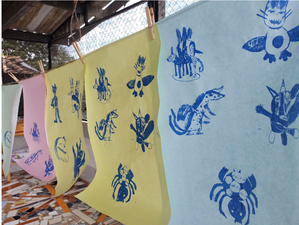
Fotografía 25: Ejercicio "Serigrafía" .

estudiante, cada una representaba el poder creador y el poder destructor que en ellos habita; 15 composiciones en media carta con sellos artesanales; 81 dibujos en frottage; 30 composiciones pictóricas en mancha; 15 carteles estampados en serigrafía y 15 composiciones en cianotipia.