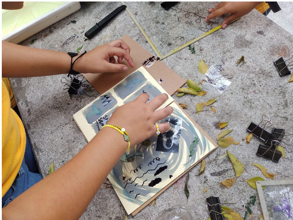
Fotografía 21: Ejercicio "Cianotipia" . Archivo fotográfico personal, 2023.

Fueron propuestos desde las planeaciones de actividades, teniendo en cuenta las técnicas que se realizarían. Si bien no se modificó ningún material, estos sí fueron usados en formas diversas, resignificando su propósito inicial para ajustarse al tipo de creación que cada estudiante quería lograr. En el laboratorio de cianotipia, se incluyeron algunas imágenes impresas en acetato, para aprovechar las transparencias de este y poder reproducir el contenido sobre el soporte emulsionado; algunos niños decidieron tomar trozos del acetato e intervenirlos con letras y formas diversas para completar sus composiciones.