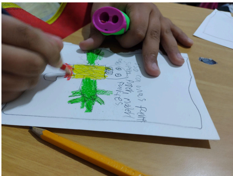
Fotografía 24: Ejercicio “Encuentro con tu artista interno”.

posibilitando nuevas maneras de experimentar. Este aspecto es determinante en la propuesta del Laboratorio.