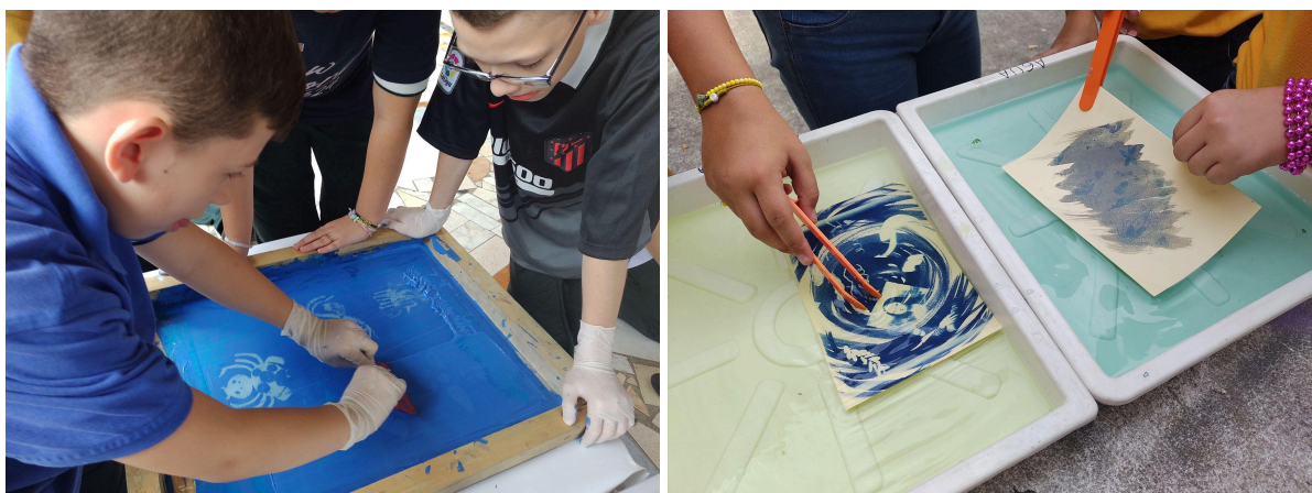
Fotografías 14 y 15: Ejercicios “Serigrafía” y “Cianotipia” . Archivo fotográfico personal, 2023.