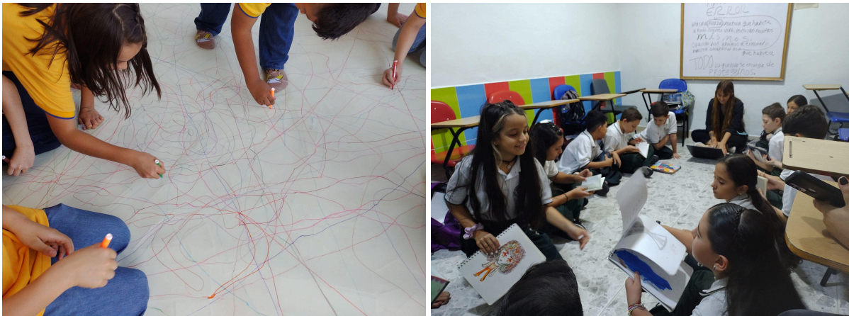
Fotografías 8 y 9: Ejercicios “1° experimento de historia grupal” y “Encuentro con tu artista interno” .