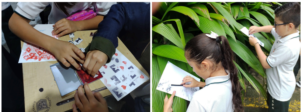
Fotografías 10 y 11: Ejercicios “Sellos artesanales” y “Estampa el jardín” .