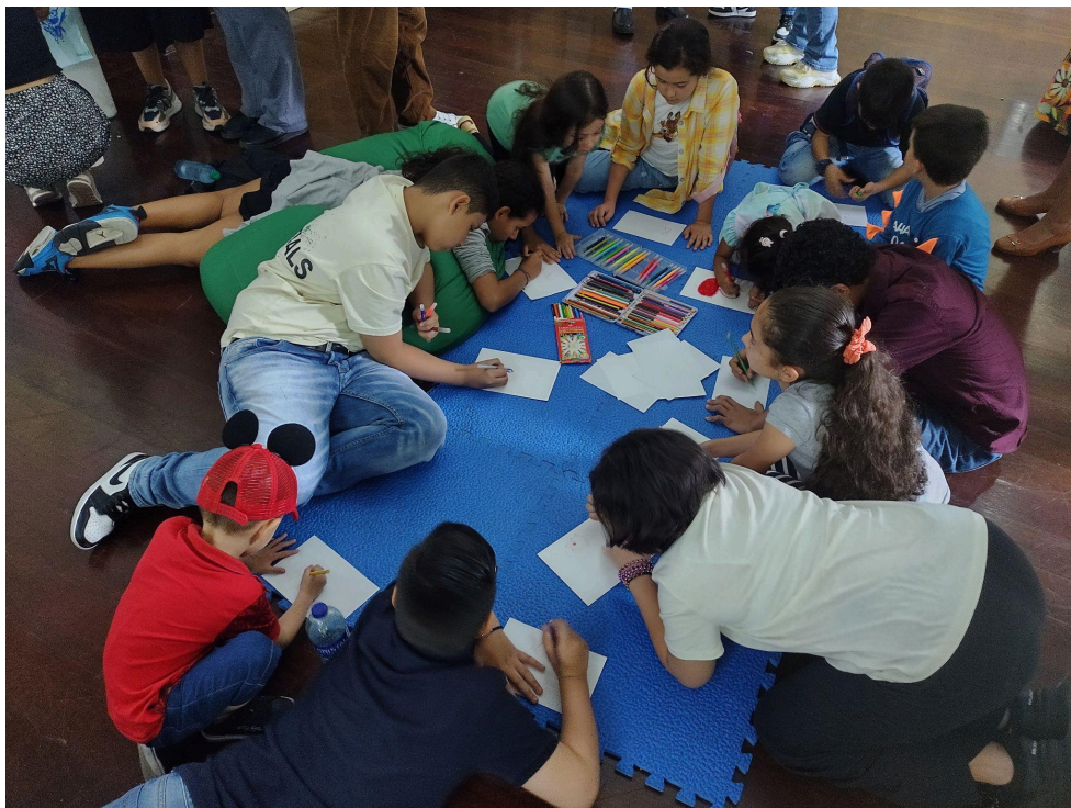
Fotografía 20: Exposición "A la orilla de una línea" . Archivo fotográfico personal, 2023.

Posteriormente, en la etapa final, nombrada de representación , se esperaba solamente exponer los trabajos resultantes del Laboratorio , como un momento de socialización de los ejercicios propuestos, y que fuera además una ventana para los estudiantes en la que se pudiera explorar la experiencia de montaje e inauguración de una exposición artística; si bien esto se llevó a cabo tal y como se había planeado, también sucedió que otros visitantes de la muestra, en su mayoría niños externos al Centro Educativo que visitaron ese día la Biblioteca en donde sucedió el encuentro, quisieron participar de actividades similares y hacer ellos parte del mismo Laboratorio , aunque esta participación no estaba planeada, dió como resultado una experiencia más amplia, que propició nuevas formas de creación.