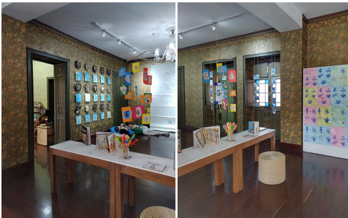
Fotografías 18 y 19: Exposición "A la orilla de una línea" .