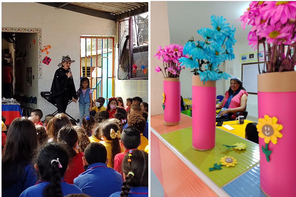
Fotografías 2 y 3: Celebración del evento “Director por un día” .

Los estudiantes por su parte cuentan con diversos comités y representaciones: Representante de los egresados; Representante estudiantil en cada grupo, que a su vez pertenece al comité escolar de convivencia; Personero de todos los estudiantes; Mediador en cada grupo; Director por un día, que es un proyecto anual en el que cualquier estudiante se puede postular para ser elegido mediante votación y ejercer funciones como director de la institución por un día.