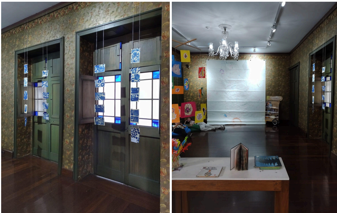
Fotografías 16 y 17: Exposición "A la orilla de una línea" .