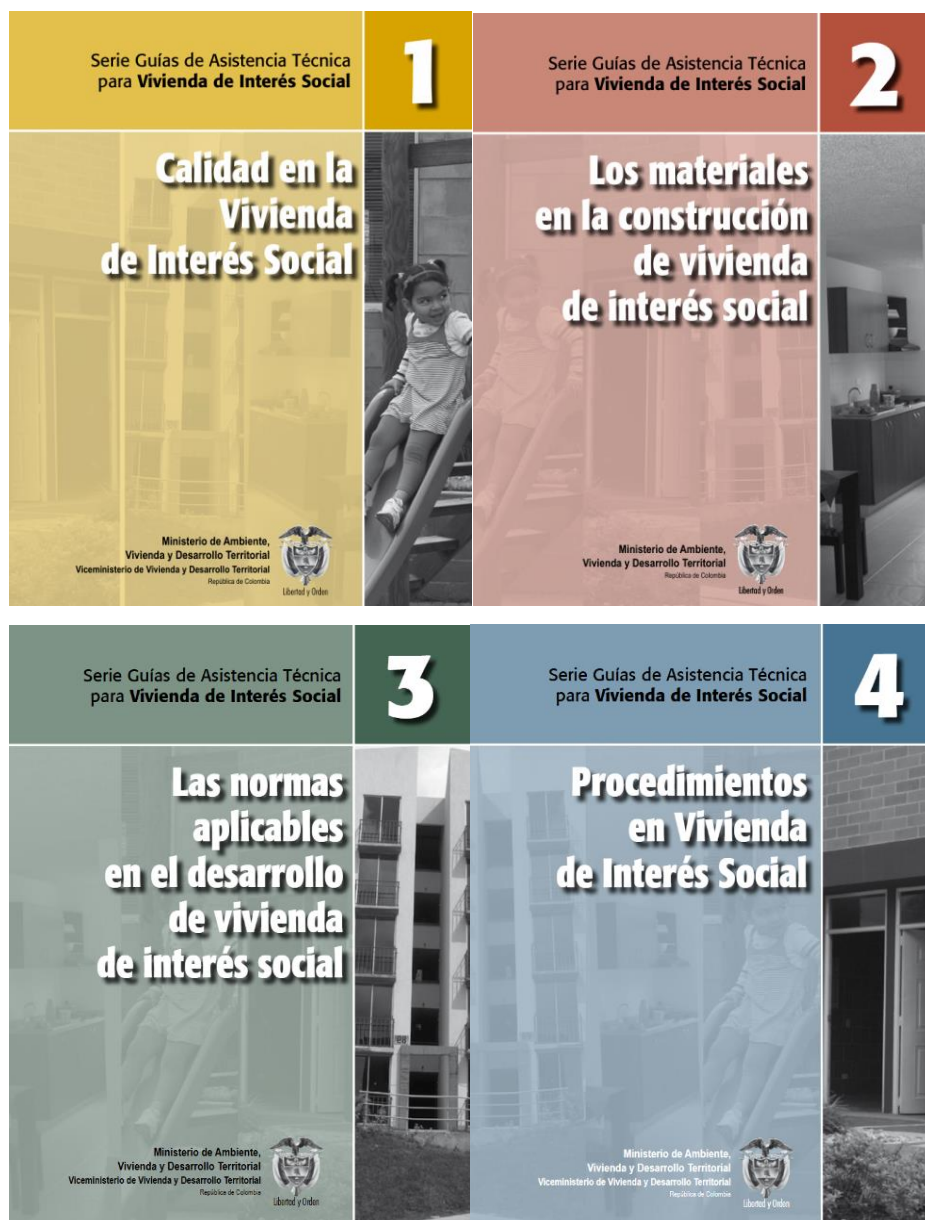
Ilustración 1. Serie de guías de asistencia técnica para la vivienda de interés social.