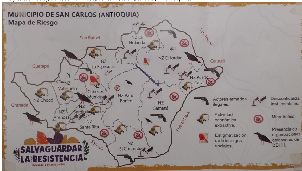
Mapa de riesgos del municipio de San Carlos, Antioquia

El corregimiento El Jordán fue uno de los lugares en el que los paramilitares centraron sus operaciones, desde allí planeaban sus acciones, secuestraban y realizaban sus entrenamientos