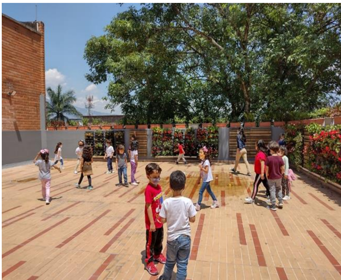
Figura 2. Taller de Expresión Teatral