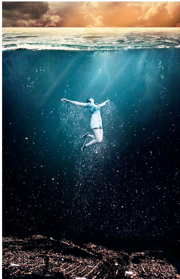
Figura 1 Escape. Hernández. (2014). [Fotomontaje digital]

Decidí mostrar este mundo al mundo real. Sin dudarlo, supe cómo: volvería con mi cámara y registraría este mundo de fantasía. Así comenzó todo: viajando entre los dos planos para traer evidencia fotográfica y audiovisual a la realidad. Registré personajes que hacen eco a las historias que escuchamos de niños, invitando a otros a viajar conmigo, a abrirse paso en un mundo de infinitas posibilidades y a crear sus propios mundos imaginarios donde todo puede suceder.