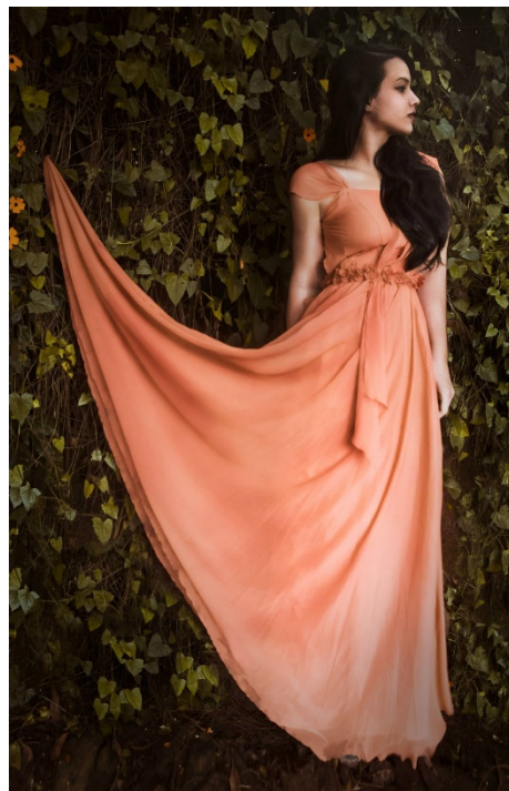
Figure 15 Encantada . Hernández, J. [Fotografía]. 2014