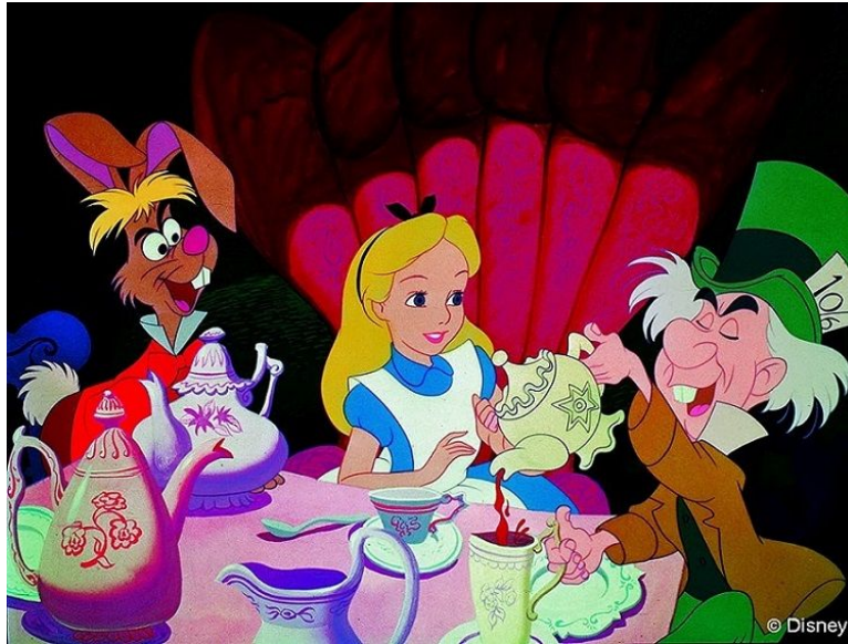
Figura 2 Alice in Wonderland, Disney, (1951)