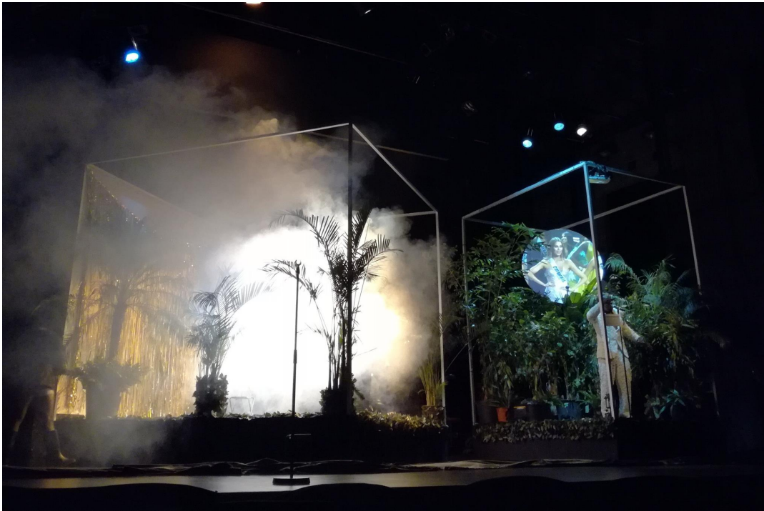
Figura 16 Abderhalden, et al. (2017). La despedida . Compañía de Teatro Mapateatro.

conmueve y desafía al espectador a reflexionar sobre la complejidad del conflicto y su impacto en la sociedad, la comunidad y la familia—.