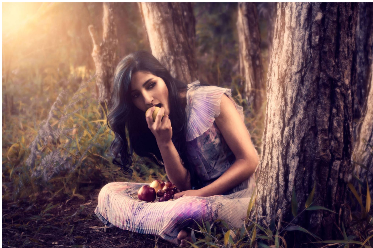
Figura 5 Bruja del bosque . Hernández, J. [Fotografía] 2014

Después de un día entero de exploración, llegamos exhaustos, pero igualmente entusiasmados. Los hermanos regresaban con una nueva colección de pergaminos escritos, mientras que yo me aferraba de nuevo a mi cámara, satisfecho por haber obtenido nuevas imágenes de personajes fantásticos que habitaban ese mundo.