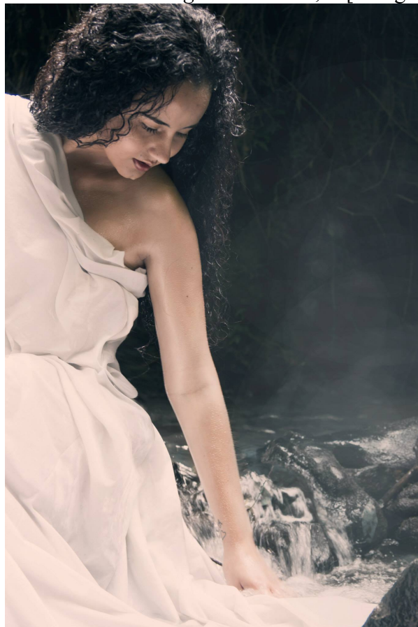
Figure 9 Serie Dama en el Lago. Hernández, J. [Fotografía]. 2014