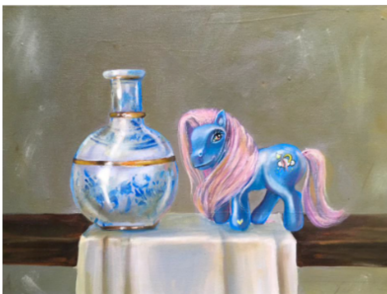
Figura 19 Bodegón Echeverry, D. [Óleo sobre lienzo] 2024. Medellín