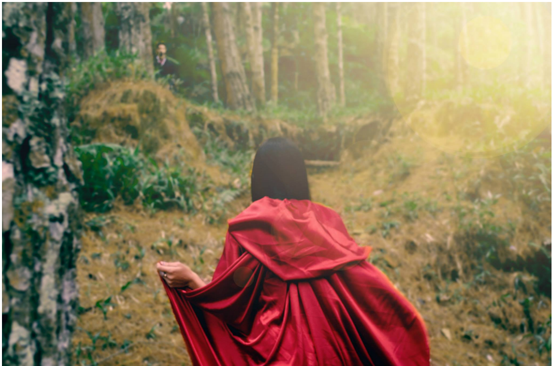
Figura 11 Caperucita roja , Hernández, J. [Fotografía]. (2014). Colombia.