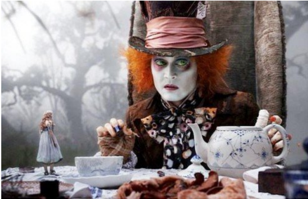
Figura 4 Alice in Wonderland, Burton. (2010)

—¿Cómo es posible que exista este mundo? — pregunté intrigado.