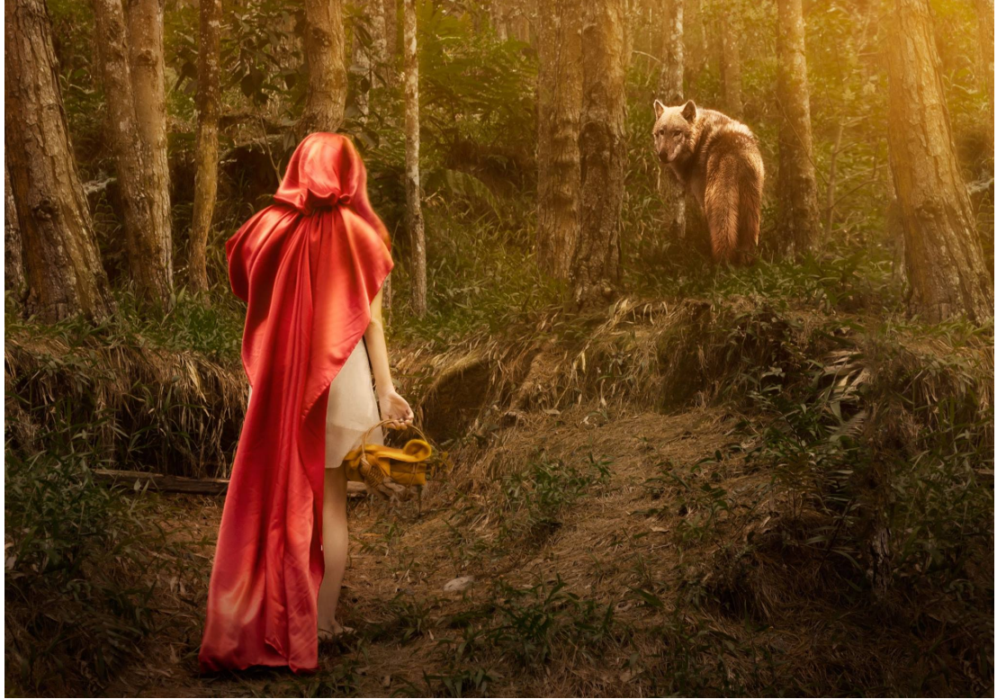
Figura 12 Capucita Roja , Hernández, J. [Fotomontaje digital]. Medellín, Colombia. (2014).

Después de recargar energías con un rápido refrigerio, nos dirigimos hacia el imponente castillo de la torre alta. Al adentrarnos, presenciamos una escena impactante: el rey, acompañado de su elegante bufón, llevaba a una joven increíblemente hermosa a la habitación de aquella torre. Allí, le exigió que convirtiera todo el heno en oro y se retiró. La joven, visiblemente angustiada, comenzó a llorar.