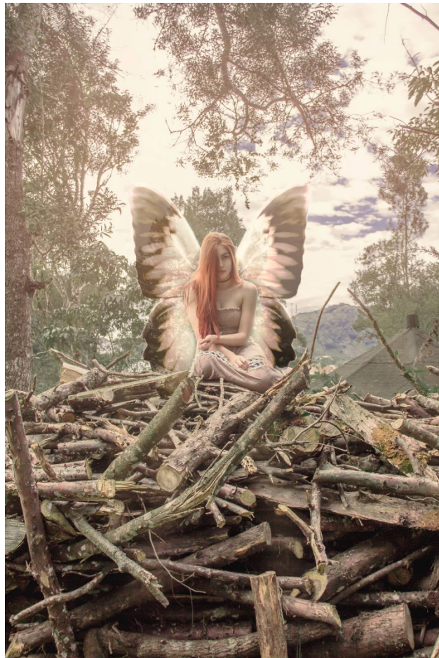
Figura 7 Serie Hada. Hernández, J. [Fotomontaje digital] 2014.