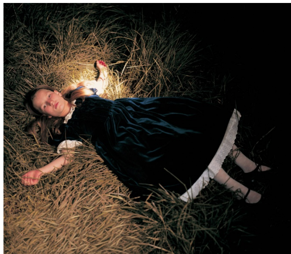
Figura 17 Tiembla Arbolito de la serie de Cuento en cuento, Duque, A. 2005. Manizalez.