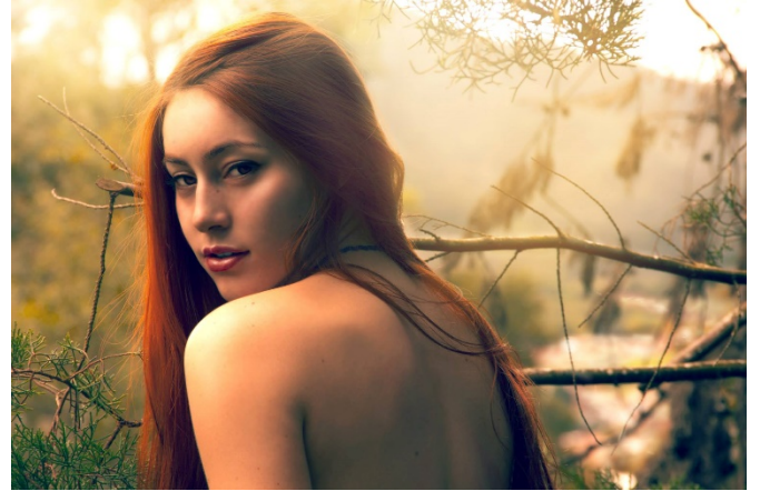
Figura 6 Serie Hada. Hernández J. [Fotografía] 2014.