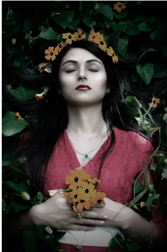
Figura 14 Blanca Nieves. Hernandez, J. [Fotografía] (2014)