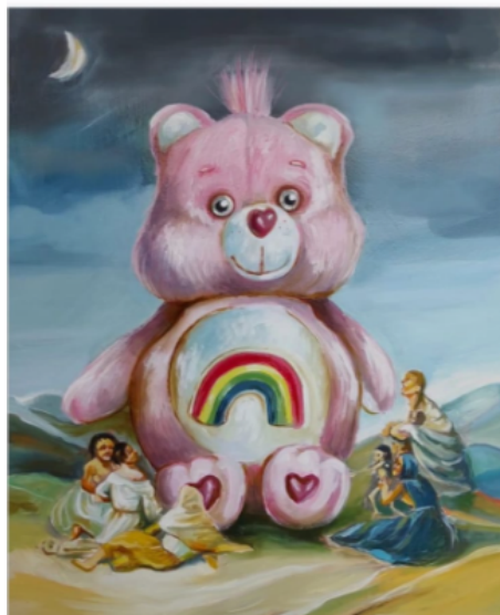
Figura 18 Aquelarre. Echeverry, D. [Óleo sobre lienzo] 2023. Medellín