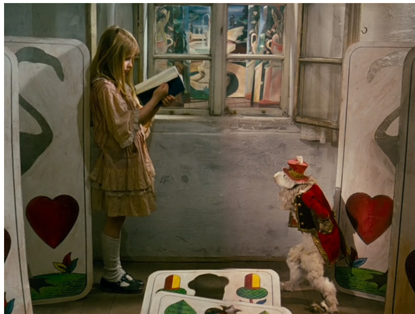
Figura 3 Alice, Svankmajer. (1988).