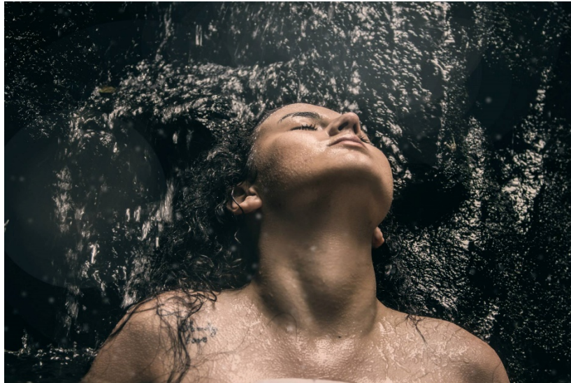
Figura 8 Serie Dama en el Lago. Hernández, J. [Fotografía]. 2014