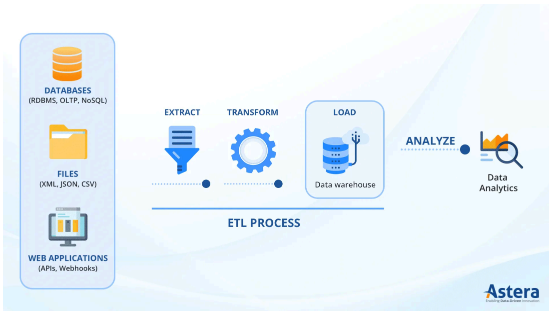
Fig 1. Proceso ETL.

En cuanto a la aplicación del proceso ETL y la construcción del tablero, a continuación, se describen detalladamente los aspectos metodológicos que se llevaron a cabo para su implementación [8, fig.1].