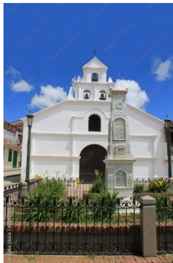
Capilla de Jesús Nazareno. Marinilla, Antioquia, Colombia.