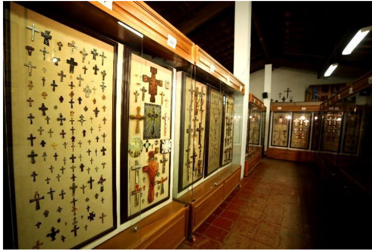
Ilustración 4 Museo de los cristos Roberto Hoyos Castaño

En Marinilla, la religión se convierte en arte. Tomado de MiOriente, 18 abril de 2019