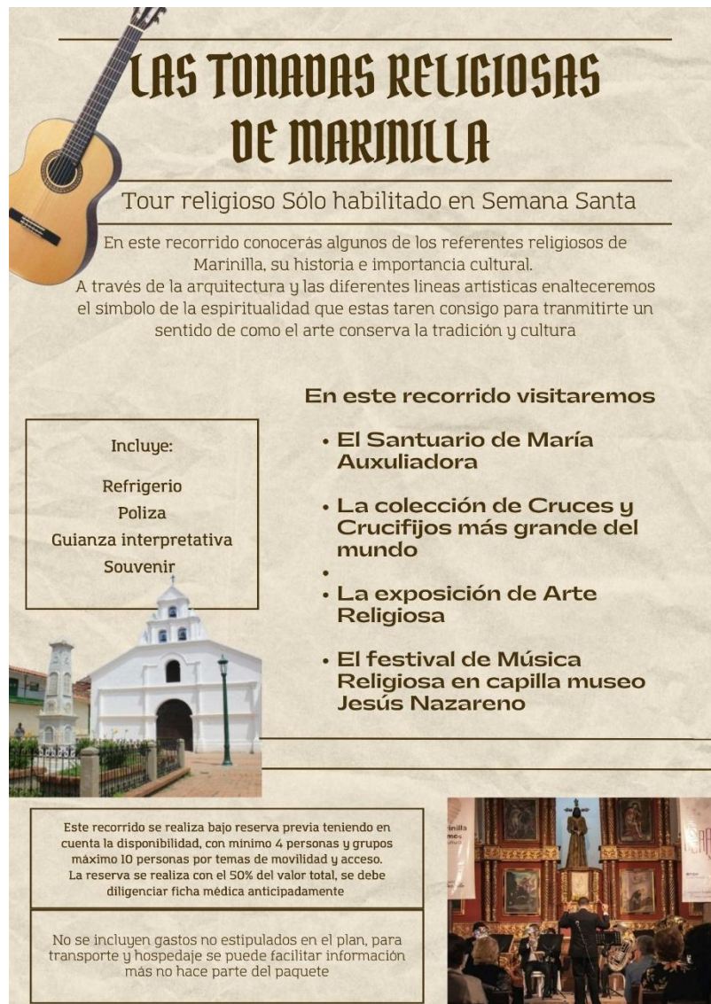
Ilustración 8 Tour religioso de semana santa