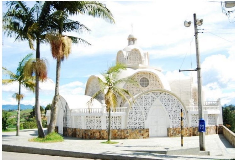
Ramírez López E. María Auxiliadora Marinilla. Tomada de Flickr. 14 de mayo de 2010

Este santuario está dedicado a María Auxiliadora, construido el año 1988, posee un diseño moderno en el estilo pseudo - bizantino con arcos calados en cemento y vitrales. se ha destacado ya que su arquitectura posee similitud a la de las mezquitas de Israel y Medio Oriente, aunque busca más el enfoque a ser similar a la corona de María Auxiliadora. La imagen central es traída de Barcelona, España y posee una sacristía subterránea: