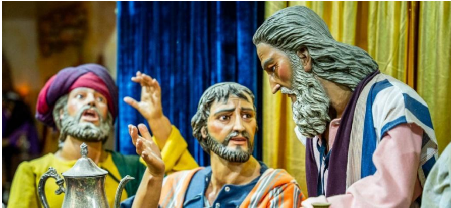
23 de marzo de 2024

Las exposiciones de arte religioso, son una muestra organizada de obras artísticas enfocadas en la temática de religión y espiritualidad, suelen representar escenas bíblicas, de fe y religiosidad a través de la realización de imágenes y figuras sagradas, en una amplia variedad de técnicas artísticas como la escultura, pintura, dibujo y tejido.