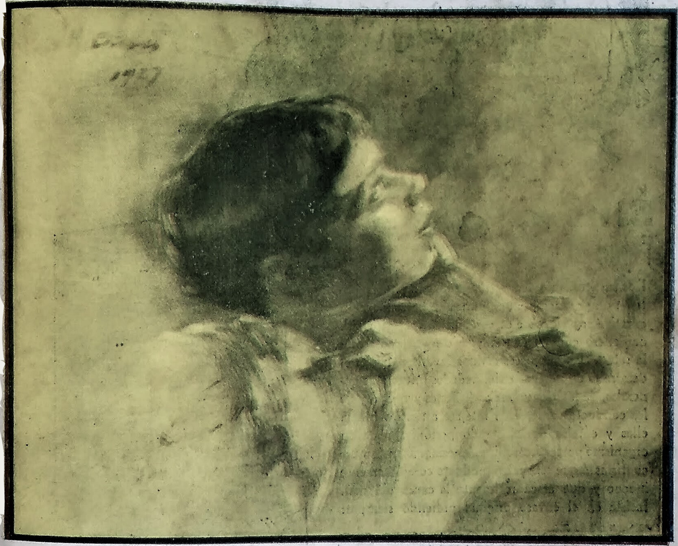
Oleo de Don Humberto Chaves, profesor de pintura en la Escuela de Bellas Artes

AUTORES Sala de Lectura Biblioteca General de A.