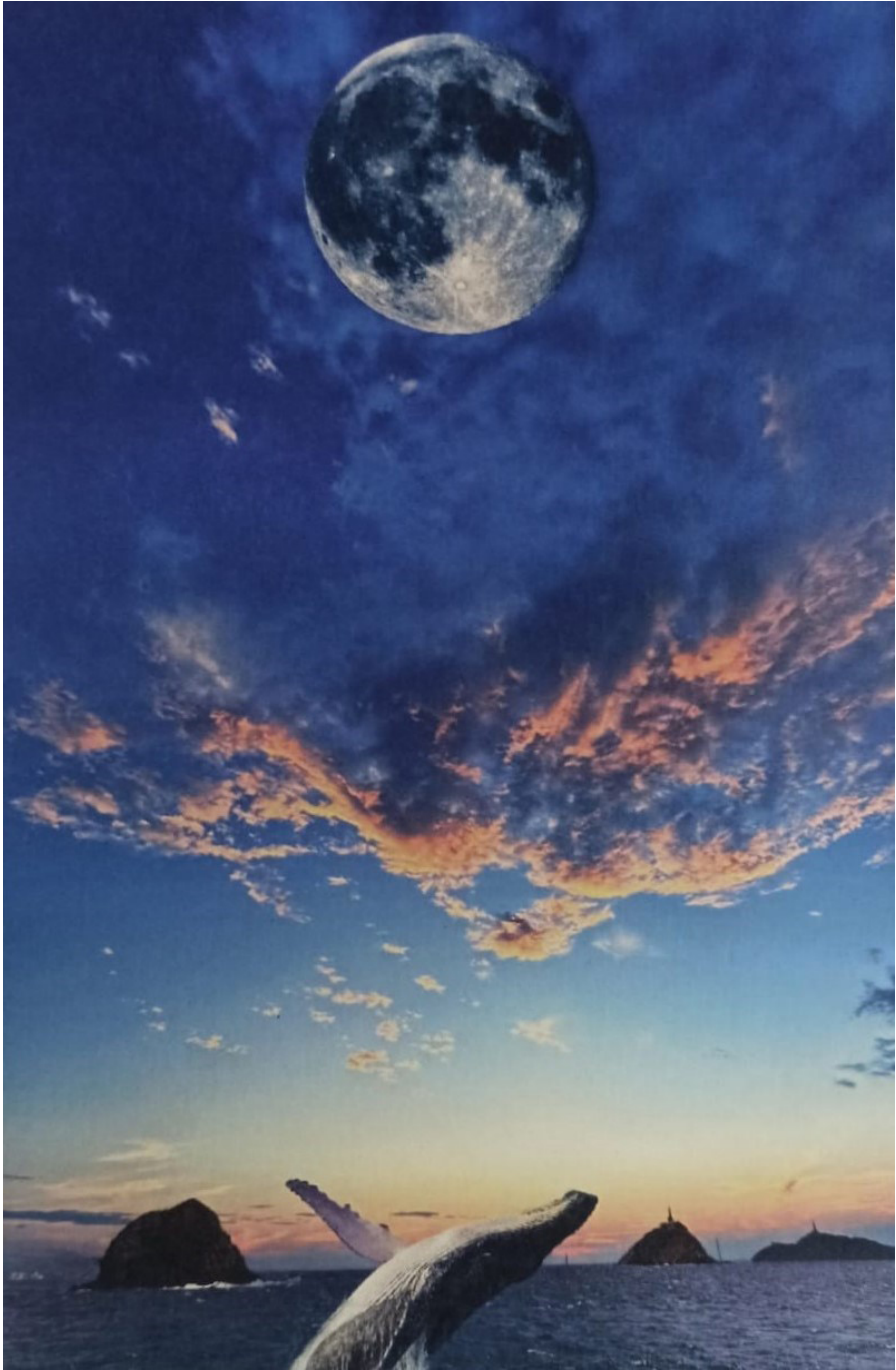
Ilustración digital: Descender MADELEYN ARAUJO CORREA (2024)