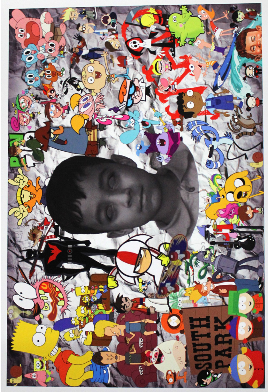
Ilustración digital: Fusión inmersiva BREYNER GRISALES (2024)