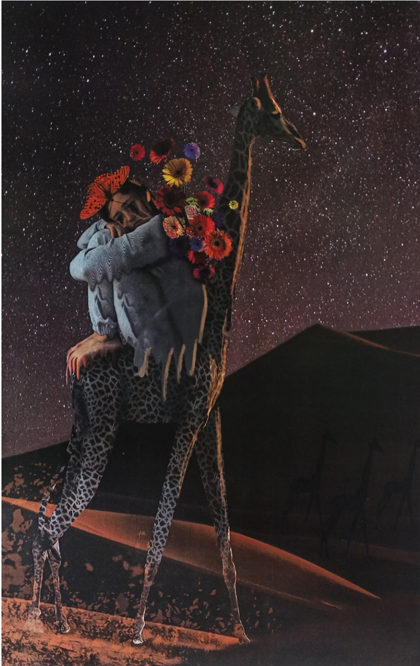
Ilustración digital: Rumbo CAROLINA TUBERQUIA RESTREPO (2024)