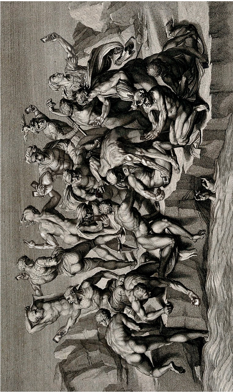
Ilustración digital: Bataglia de la vila JUAN FELIPE ACEVEDO VERGARA (2024)