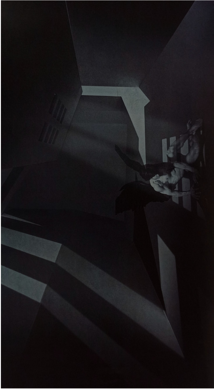
Ilustración digital: Dualidad SAMIR MARTINEZ DELGADO (2024)