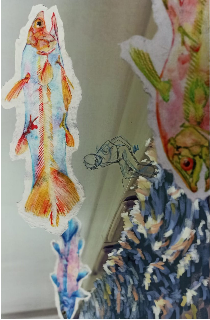
Ilustración digital: Lost in translation VALERIA PAZ FIGUEROA (2024)