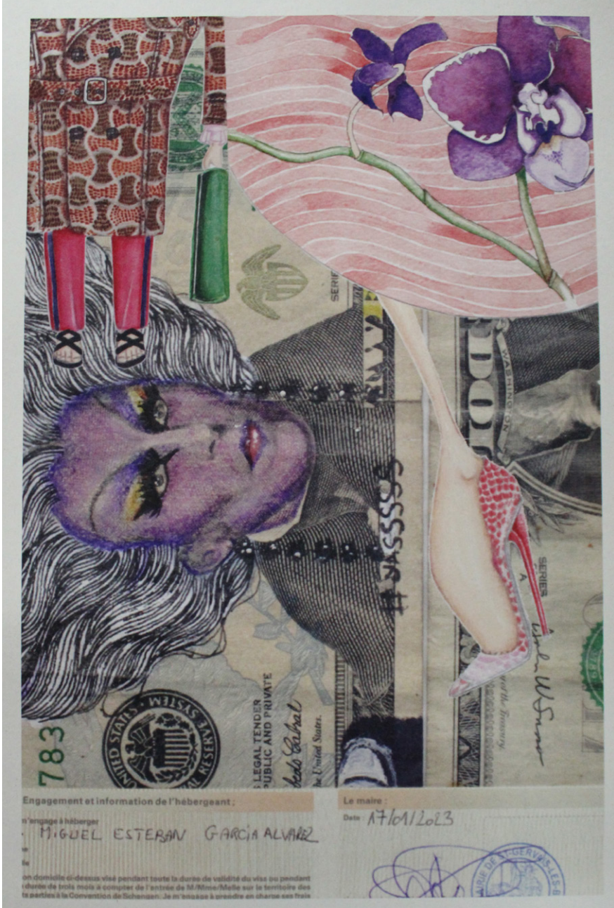
Ilustración digital: Sin título MIGUEL ESTEBAN GARCÍA (2024)