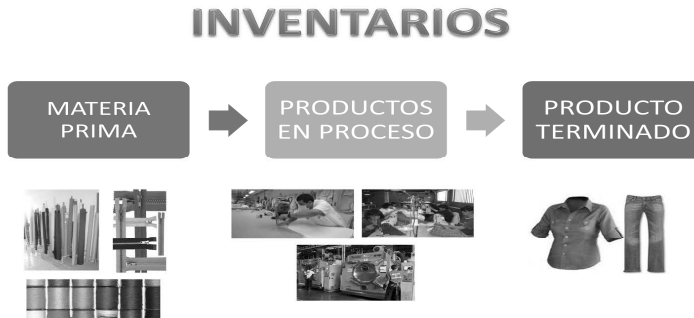
Figura 1. Inventarios involucrados en el ciclo de producción de una empresa manufacturera