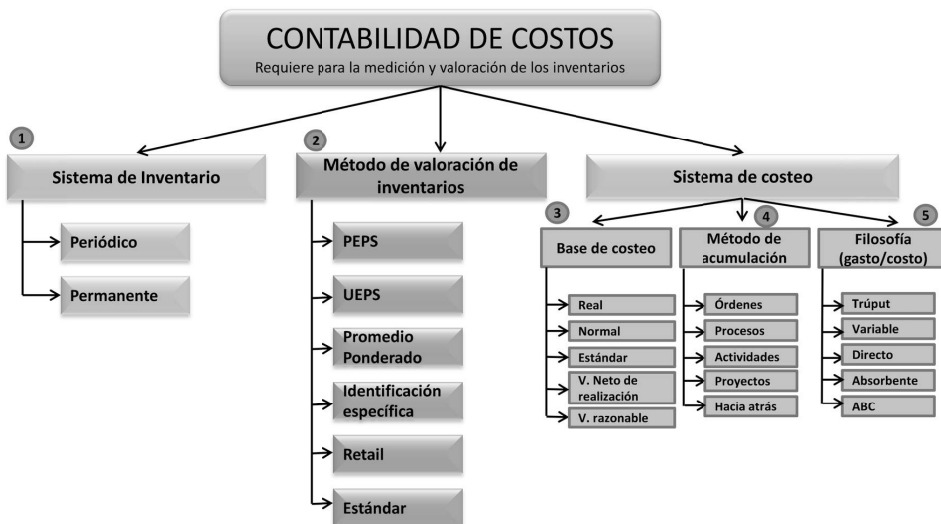
Figura 4. Elementos necesarios para la valoración del inventario

Es la contabilidad de costos quien finalmente define los criterios para la medición de los inventarios, para ello se requiere la inclusión de cinco aspectos fundamentales, los cuales se describen a continuación: