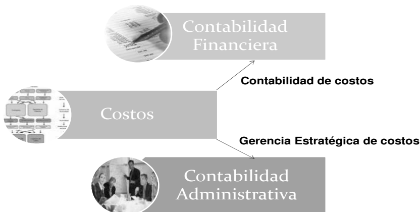
Figura 2. Subsistemas de la contabilidad relacionados con la información de costos

Lograr el adecuado control y, por supuesto, valoración de los inventarios antes descritos, requiere la configuración de lo que se denomina “la contabilidad de costos”, la cual puede definirse como la disciplina que estudia las técnicas o los métodos que permiten la determinación del costo de un proyecto, de un proceso o de un bien a través de una medición directa, una asignación arbitraria o una distribución sistemática y racional (Barfield, 2005, p. 5). Tradicionalmente la contabilidad se ha dividido en subsistemas, entre los cuales se encuentra el de costos, el cual se muestra íntimamente relacionado con otros dos subsistemas: