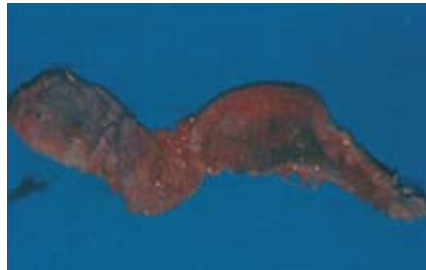
Figura 7 y 8

Paciente con sinusitis en lado izquierdo posterior a cirugía ortognática, presenta fistula en zona del 26 y en la radiografía velamiento en zona del seno