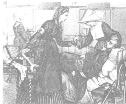
Dos monjas enfermeras y una enfermera de la Cruz Roja atienden a las víctimas de la guerra Franco-Prusiana. Grabado en madera. De la Mode Illustrée , ca. 1870. National Library of Medicine, Bethesda, Maryland.

Nursing care, Life conditions, Nursing like a profession, Human condition.