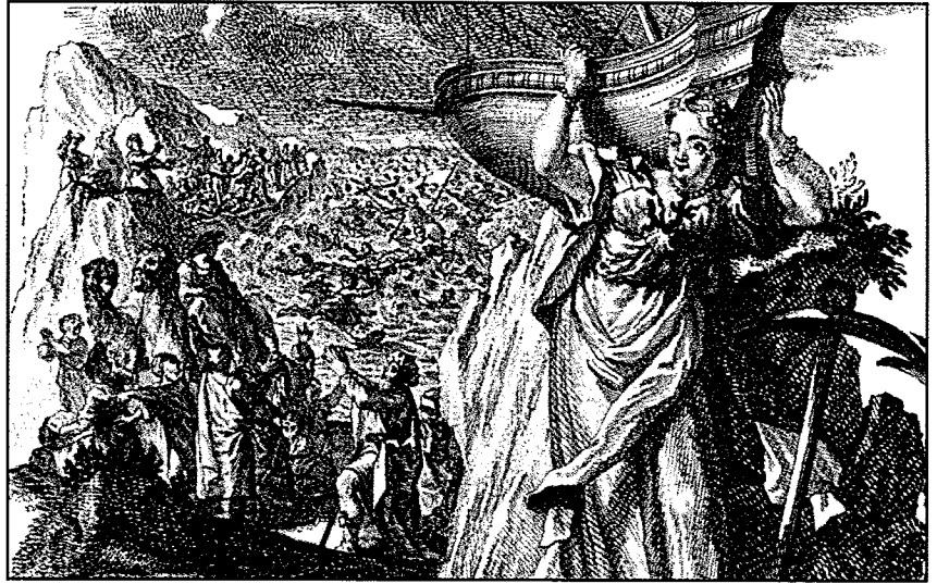
El Agua. El Faraón atraviesa las grandes aguas del mar, y por la cólera de Dios, todo el bando perece. Los enviados del Faraón todos perecieron cruzando el Mar Rojo. CESARE RIPPA - Imágenes Pictóricas Barroco y Rococo. Editado por Edward A. Maser, Impreso en Estados Unidos, 1971 por Dover Publications, Inc.

Los modelos conceptuales también llamados grandes teorías, ofrecen un marco de referencia para la práctica. Suelen incluir aspectos referidos a categorías básicas que conforman la red conceptual de enfermería, tales como las de persona, entorno y salud, y orientan sobre conductas profesionales a seguir. Entre estos modelos se encuentran el de Dorothea Orem, quien describió el cuidado como una necesidad humana y a la enfermería como un servicio orientado al cuidado. De su trabajo emanan tres teorías que orientan en conjunto la prestación del servicio de enfermería. Ellas son la teoría de los sistemas de enfermería (total o parcialmente compensadores de cuidado y los de apoyo educativo); la teoría del déficit de autocuidado y la teoría del autocuidado. 14