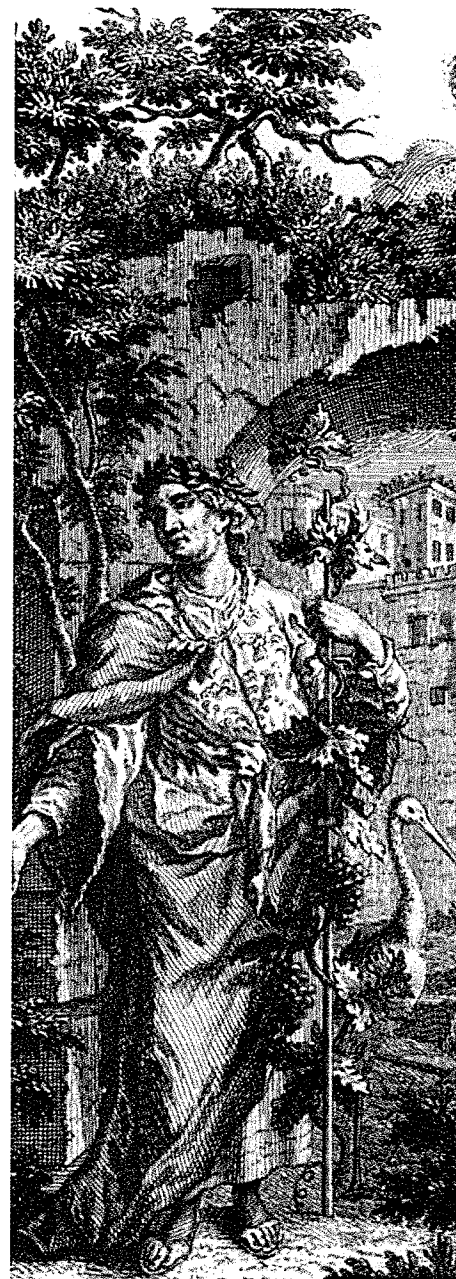
(detalle) Auxilio. Rahab tomó a los espías de Joshua y los escondió bien. Y los reservó para la caída de Jericó.

El conocimiento sobre el cuidado en enfermería es su esencia como disciplina. Varias autoras se refieren al cuidado no como un procedimiento técnico sino como un proceso interactivo que satisface necesidades humanas básicas 4 , entre las que se destacan la protección, la subsistencia, la comprensión, el entendimiento y el respeto por la dignidad humana. El cuidado en enfermería, implica ponerse en el lugar del otro mediante una relación trascendente que exige competencias profesionales, entrenamiento, investigación, responsabilidad y crea-