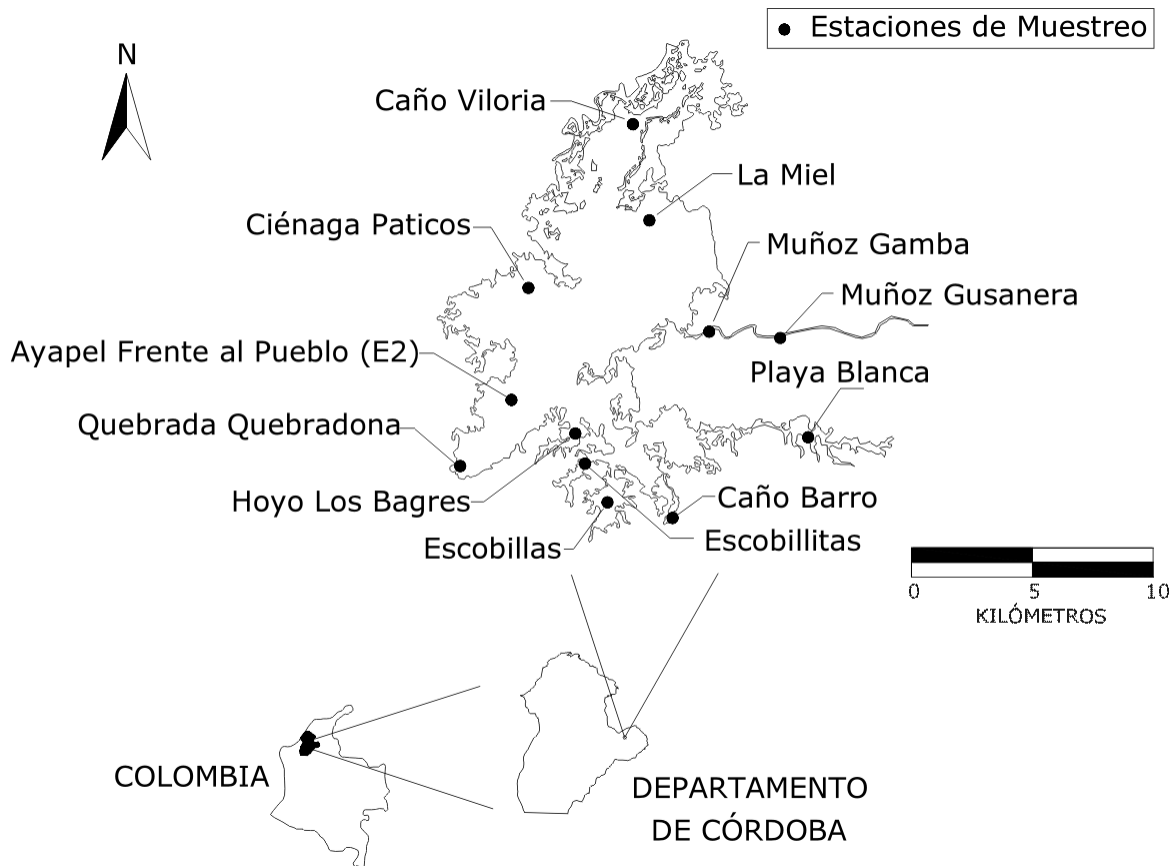
Figura 1. Ubicación de la Ciénaga de Ayapel y de las estaciones de muestreo.