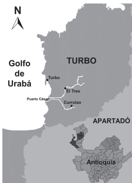
Figura 1. Localización geográfica de la vereda Puerto César

El caserío de La Playa se encuentra localizado a orillas del golfo de Urabá, en el caserío Puerto César, ubicada en la vía que comunica los municipios de Apartadó y Turbo, entre los corregimientos de Currulao, al cual pertenece, y El Tres; nombres con los que se conoce a los ríos que la enmarcan en su recorrido hacia el golfo (véase figura 1). Este caserío, cuya configuración actual data de una década aproximadamente, es el lugar de asentamiento de un grupo de familias desplazadas provenientes de otros corregimientos, veredas o municipios del Gran Urabá (Antioquia, Córdoba y Chocó), de donde son oriundas, o que constituyeron sitios de tránsito en la búsqueda de las fluctuantes oportunidades de trabajo ocasionadas por las economías de enclave en la región, o en procura de un refugio en el proceso de desplazamiento forzado. 2