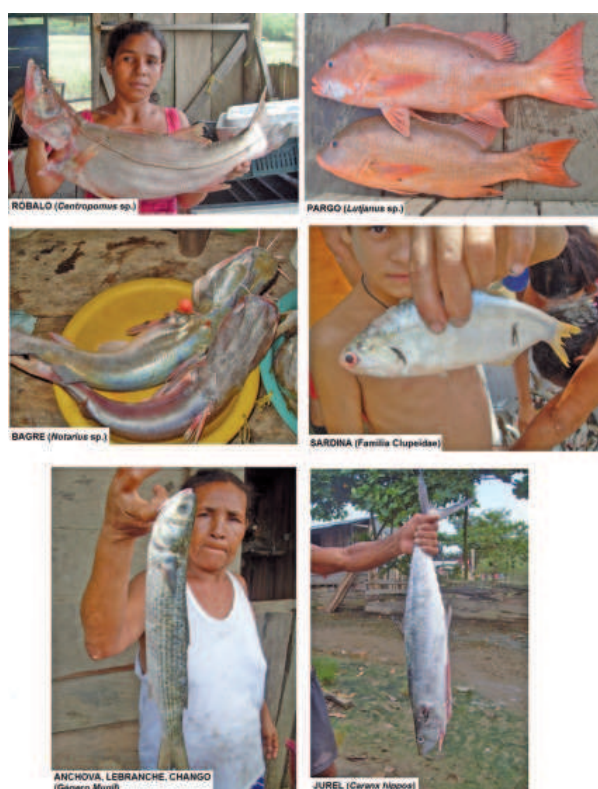
Figura 3. Algunas especies de importancia pesquera en el golfo

Candelaria y Pava en el verano es que se coge más pescado. En este tiempo, invierno, para encerrar pescado, pa' coger jurel encerrado, sale en cardumen, como el mar está quieto, pega este viento, no hace mareta ni nada, entonces la sardina se aglomera y sale el jurel. Los pescados caminan más pa'llá en el verano, pega el róbalo y pega el pargo, en el verano que hay mareta (pescador, 41 años, 3 de abril de 2013). 6