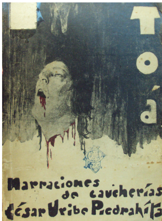
Figura 1. Carátula de la edición príncipe de Toá: Narraciones de caucheras , 1933.

de la misma; sucesos que más tarde corroborará el lector cuando se adentra en la aventura de la selva con el personaje principal de la trama, el médico Antonio De Orrantía. 6