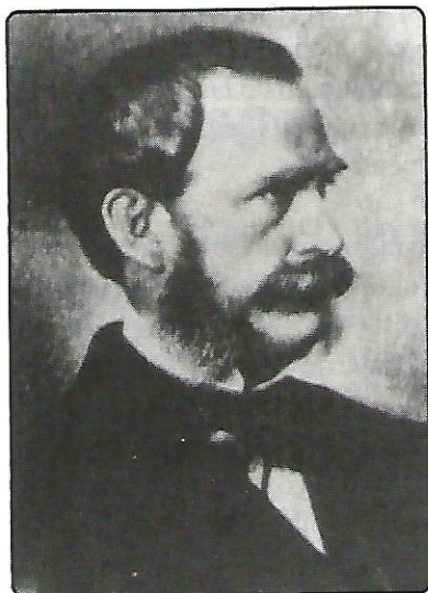
Doctor William T. G. Morton, primero en hacer una demostración pública exitosa de la anestesia con Eter

El doctor Jackson por la facilidad de producción le sugirió el éter sulfúrico. Jackson tenía el hábito de inhalar éter, “cayendo sin conocimiento”, conocía la capacidad del éter para causar la inconsciencia.