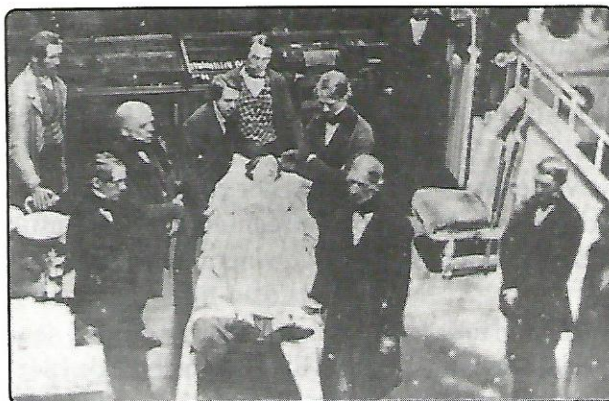
Operación efectuada el 17 de octubre de 1846 empleando el éter como anestésico. En la cabecera de la mesa, con chaleco a cuadros, se encuentra el anestésista, William T. G. Morton. Warren, el cirujano, se encuentra a la derecha y adelante de la mesa.