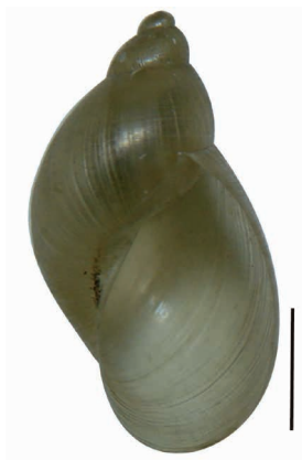
Figura 2. Lymnaea columella recolectada en la vereda Balsas del municipio de Gómez Plata, Antioquia. Barra = 1mm.

Se recolectaron nueve limneidos que se determinaron como Lymnaea columella (Say, 1817), ya que sus conchas reúnen las siguientes características morfológicas: relación Altura de la apertura/Altura de la espira de 2,32 y periostraco con líneas de crecimiento atravesadas por líneas espirales finas (figura 2). 18,19 Además la relación largo del prepucio/largo bolsa del pene fue de 4,3. Se depositaron cinco ejemplares en la Colección de Moluscos Vectores de la Universidad de Antioquia (VHET N°37), bajo el registro 1083.