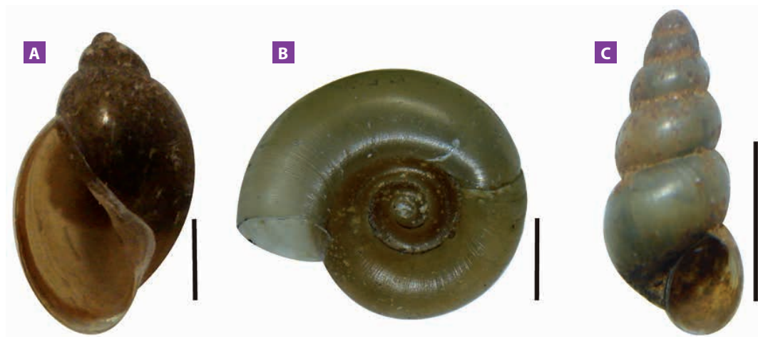
Figura 3. Conchas de los moluscos no limneidos recolectados en la vereda Balsas. A. Physa acuta . B. Biomphalaria sp. C. Aroapyrgus cf. colombiensis . Barras = 2 mm. Fotografías tomadas en la Unidad de Malacología Médica y Trematodos/PECET/Universidad de Antioquia.

En la tabla 2, se consignan los resultados de las variables relacionadas con fuentes de agua superficiales, entre las que se destaca por su alta frecuencia la presencia de acequias en potreros (90,5%) y por su baja frecuencia la disponibilidad de agua de acueducto (15,5%). El análisis bivariado mostró asociación estadística significativa entre la paramphistomosis y el encharcamiento permanente (valor p= 0,004 ), así mismo entre esta parasitosis y la presencia de acequias en los potreros (valor p= 0,006 ). Por otro lado, se determinó que los predios con encharcamiento permanente en los potreros tienen el doble de riesgo de que sus bovinos se infecten con paramphistómidos (RP= 2,222 IC 95% 1,18; 4,19). La medida de riesgo no se calculó para la presencia de acequias,