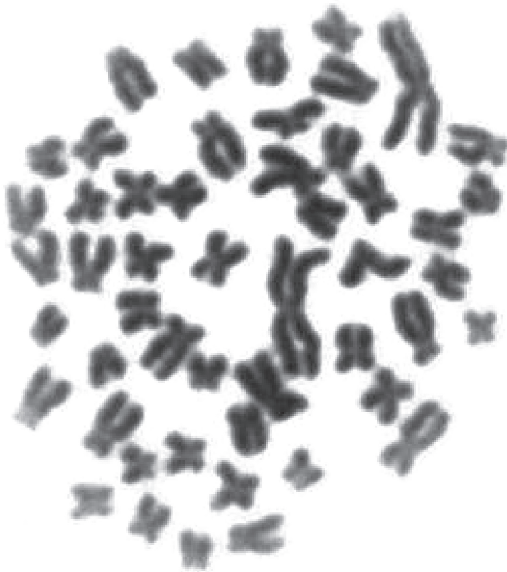
Fig. 2. Metafase de B. henni . Presenta un par cromosómico de gran tamaño, característico del género Brycon . Giemsa 5%.