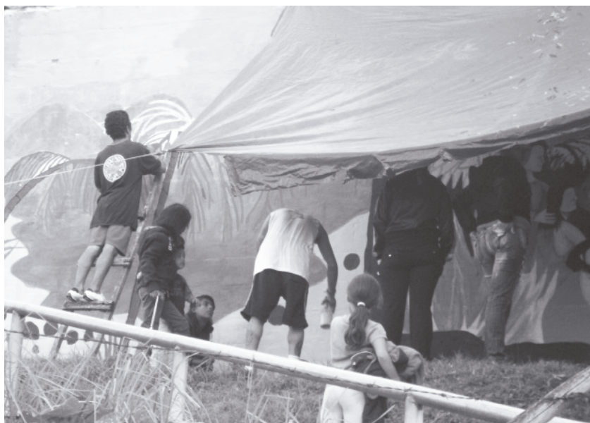
Fotografía 2: "Apropiación del territorio"

Este modelo de gestión del desarrollo desencadenó procesos de planeación para orientar intervenciones, convirtiéndose en una oportunidad para integrar acciones de participación comunitaria, corresponsabilidad y fortalecimiento institucional (Isaza y Orozco, 2011). Para viabilizar las propuestas de la