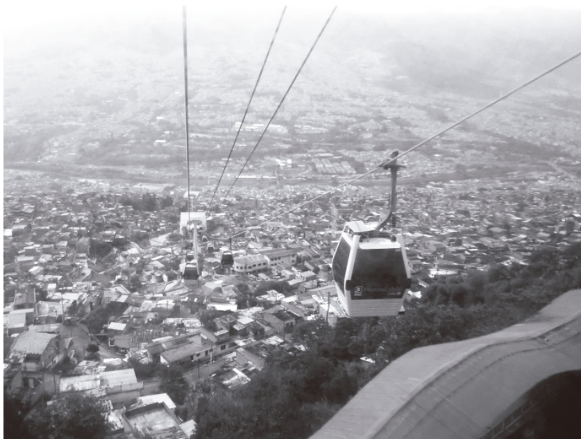
Fotografía 1: "Desde la zona Nororiental de Medellín"

Se desarrolló mediante propuestas vinculantes de mejoramiento barrial, resaltando la contribución de los actores involucrados en el proceso, desde el componente de participación en la metodología utilizada, la cual tuvo un esquema único de etapas implementadas de acuerdo con características poblacionales y espaciales: planificación, diseño, gestión, ejecución y animación (alcaldía de Medellín, 2006). En este sentido, retomó la comunicación como componente central, al tiempo que se orientó por el urbanismo social como enfoque que propuso la vin-