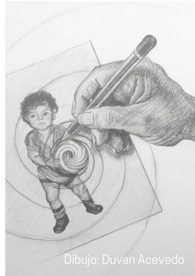
Dibujo: Duvan Acevedo

Dicha negación del hecho por parte del perpetrador, ha implicado que las integrantes de ASFADDES continúen emitiendo denuncias y reclamando la verdad de lo que ocurrió con sus familiares desaparecidos.