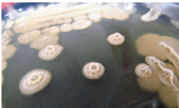
Figura 2. Crecimiento de Bacillus licheniformis en TSA.

la caracterización morfológica, bioquímica y microscópica realizada antes de la secuenciación, en donde se determinó que es una bacteria Gram positiva, anaerobia facultativa, con forma de bacilo y catalasa positiva. El crecimiento de B. licheniformis en TSA se observa en la figura 2.