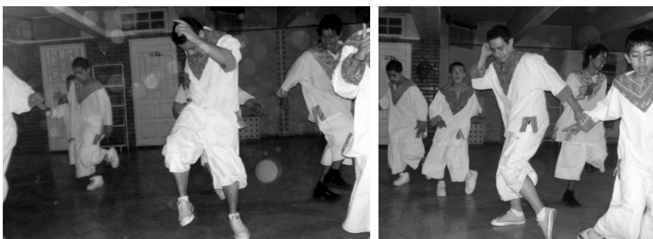
Grupo de baile colombiano “Graffitos Colombia” de Saltillo, Coah., bailando cumbias al muy particular y llamativo estilo de esta ciudad. 18 Fotografías: Darío Blanco Arboleda, 2006.

espacio-tiempo relativamente “regulado” y siguiendo el compás de una música. La diferencia es que en el actual baile de cumbia regio, al estar abiertamente establecido el conflicto entre bandas, la violencia no está regulada, los participantes no controlan el nivel de agresión, ni los golpes están estrictamente enmarcados dentro de la temporalidad de la canción. Así, a muchos de los bailes y conciertos, los jóvenes de las bandas no van tanto a bailar sino a pelear. Sitios como “La Fe Music Hall” 17 o los bailes de barrio se han tomado como un ring de pelea; son espacios para encontrarse a los rivales y “demostrarles” su fuerza para retarlos. En los golpes y en la “valentía” se logra “el reconocimiento” que estos jóvenes buscan más de sus pares. De nuevo la voz de los protagonistas: