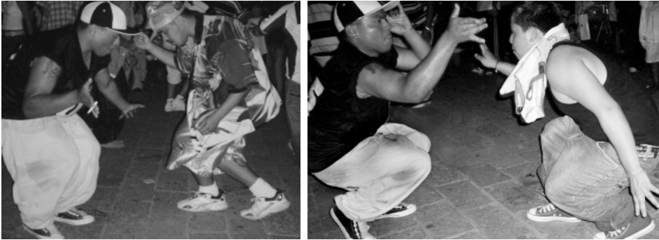
Jóvenes colombias de Monterrey bailando cumbia.

dentro de la estructura de movimientos y manejos del cuerpo permitidos en la sociedad. Dentro de las culturas, es por intermedio de la tecnificación corporal (Maus) como las estructuras sociales llegan al interior de los individuos; así las demandas sociales se instalan en los cuerpos en movimiento (Islas, 2001).