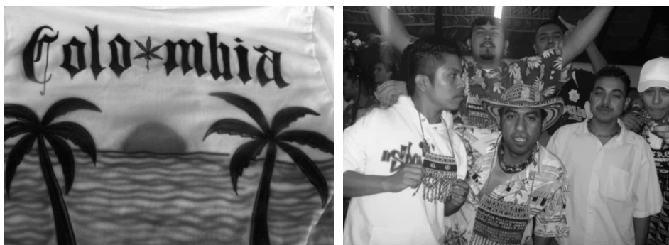
Izquierda: playera comercializada para los jóvenes. Derecha: banda “Los Borrachentos de Reforma”, en el pecho llevan una bandera de Colombia con los nombres de los integrantes.

que transgreda dichos parámetros, provoque escándalo e indignación y que sea tratado con desprecio e incredulidad. Ésta es una de las razones por las cuales el vestido es una cuestión de moralidad. Vestir es tan importante que incluso las personas que no están tan preocupadas por su aspecto vestirán de manera adecuada para no sufrir la condena social. De hecho, se habla de la ropa en términos morales: es correcta, está impecable o es vulgar, lujuriosa. Las prendas se convierten en una extensión de nuestro cuerpo, por lo que nos preocupamos constantemente por su estado, por su proyección, ¿cómo se me ve? (Entwistle, 2002: 21-22).