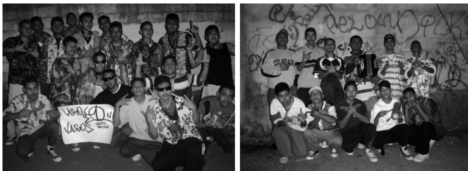
Bandas colombias en Monterrey (2006) Izquierda: “Los Diablitos” de la colonia Arboledas. Derecha: “Los Dickies” de la colonia Nuevo Almaguer.

En Monterrey, a los colombias se les ridiculiza nombrándolos “colombianos” asociándolos así con “los cholos”, quienes tienen vestimentas llamativas y muy mal vistas dentro de la “norma” regia. En esta ciudad, en términos generales, el modelo de vestimenta de la clase media es el “vaquero”: pantalón de mezclilla apretado, camisa a cuadros, botas “tejanas” y, en muchos casos, sombrero del mismo estilo. Cuando se estableció la cultura juvenil colombias , hacia los años ochenta, se crea una estética que les brindará identidad y los diferenciará de la “media” social regiomontana. Con esta nueva estética disruptiva, envían un mensaje de alteridad, de manera asertiva y contestataria, en la lógica que desarrolla Goffman (2001). De su situación marginal y estereotipo, elaboran una resignificación, convirtiéndola en un elemento reivindicativo, “hacen ostentación de su estigma”.