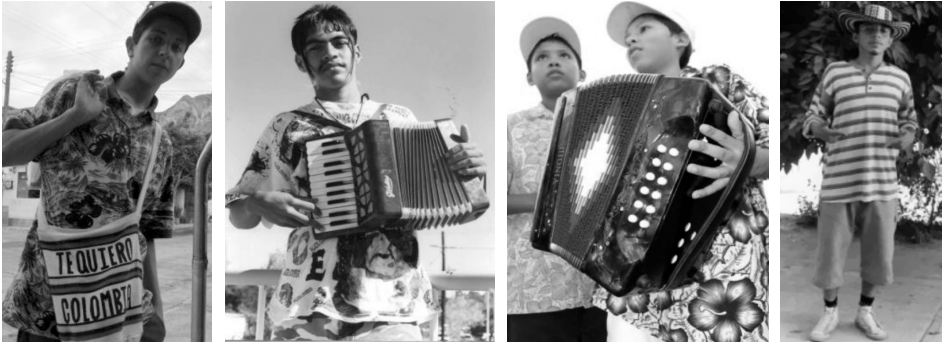
Chavos colombianos de Monterrey.

“tropicales” siguen siendo usadas profusamente en la actualidad, ya no se hacen préstamos del rock, sino del hip-hop, con sus pantalones muy anchos (varias tallas más grandes, marca Dickies) y sudaderas igualmente amplias con estampados y aerografiados, en este caso de motivos colombianos . Dejemos que los protagonistas nos relaten: