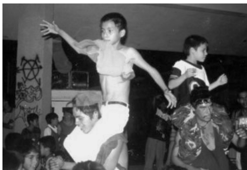
Bailes colombias de cumbia en Monterrey. Derecha: el particular estilo de “La burra”, desarrollado a finales de los ochenta.

1970), lo único que tenían los grupos populares de Monterrey eran discos de acetato, una sonoridad y sus portadas —que les daban mucha información, pero no sobre el baile—. No tenían ningún referente visual de cómo se bailaba esa música. No había vídeos, los grupos colombianos no habían llegado a la ciudad, no existía la Internet; no tenían manera de rastrear el estilo de baile asociado a la música que les encanta. Así, la primera generación de colombias se encuentra con un sonido que les interpela poderosamente el cuerpo, pero no sabían cómo bailar. Ocurre una vez más lo lógico, cada quien comienza a bailar como lo siente, como se le ocurre, se inventan pasos. Los pasos más creativos se esparcen rápidamente, se difunden exponencialmente en los bailes y fiestas, llegando a ser conocidos en toda la ciudad. En los años noventa, a un presentador de televisión le llama poderosamente la atención la recursividad, imaginación y cadencia de los bailes populares de su ciudad y se dedica a presentarlos en su programa y a “bautizarlos” con nombres llamativos. Así, aparecen los bailes del “gavilán”, “la motoneta”, “el Fome 30”, 14 “la burra”, como los hermanos conocidos de muchos otros que no tuvieron la fortuna de ser “nombrados” por la televisión.