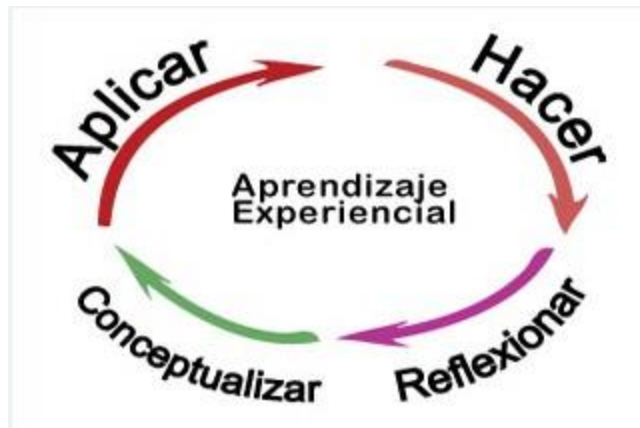
Ilustración 3. Fases del proceso educativo según el Aprendizaje Experiencial

Galleguillos y otros (2010), retomando al equipo Cisne en el porqué del aprendizaje experiencial explica las fases anteriores de la siguiente manera: