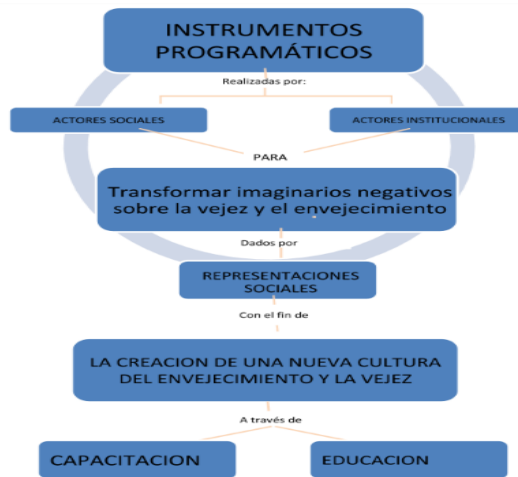
Gráfica 1. Mapa conceptual sistema categorial

Frente al sistema categorial, se realizó un mapa conceptual para identificar su relación en el proceso de investigación.