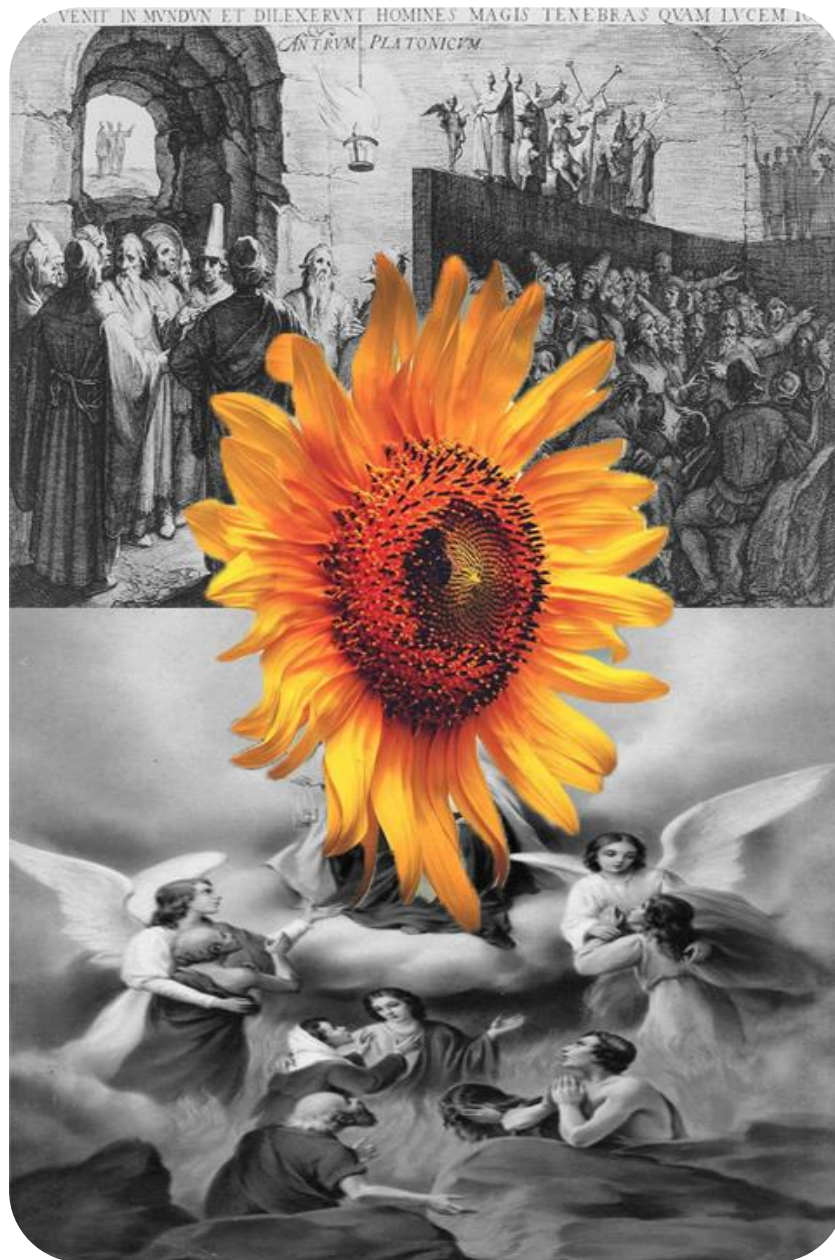
Ilustración 2: Alegorías de Ensueños . Elaborada por: Ferney David Rodríguez Fuertes (2019)