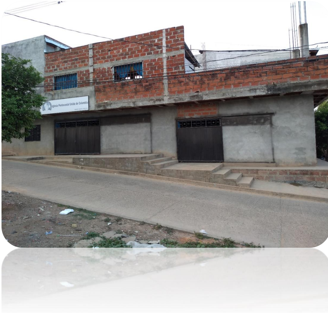
Ilustración 5: Comunidad Religiosa: Iglesia Pentecostal Unida de Colombia Cauca/Ant.

Considerado de igual forma, por el diccionario de las religiones como: