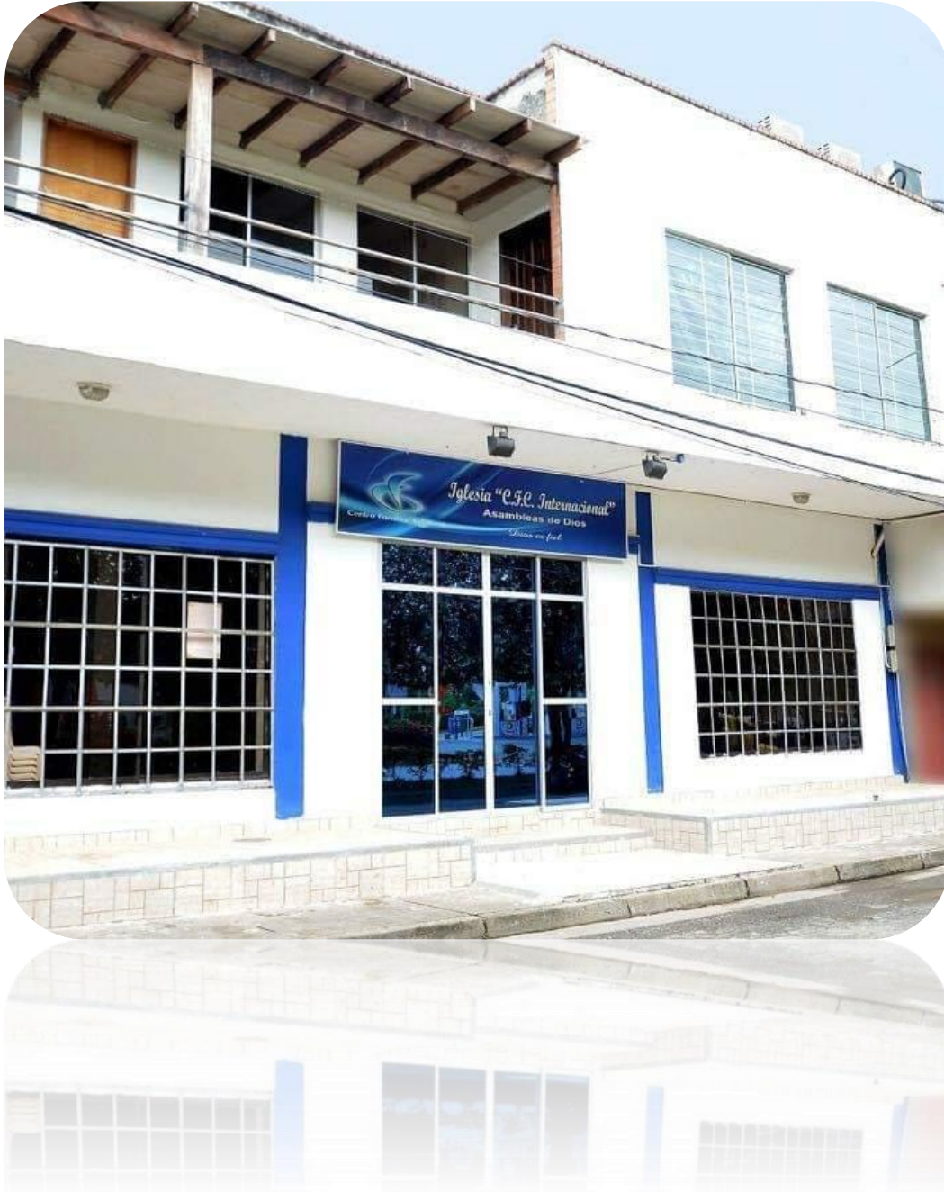
Ilustración 6: Comunidad Religiosa: Centro Familiar Cristiano Internacional Caucaasia/ Ant.