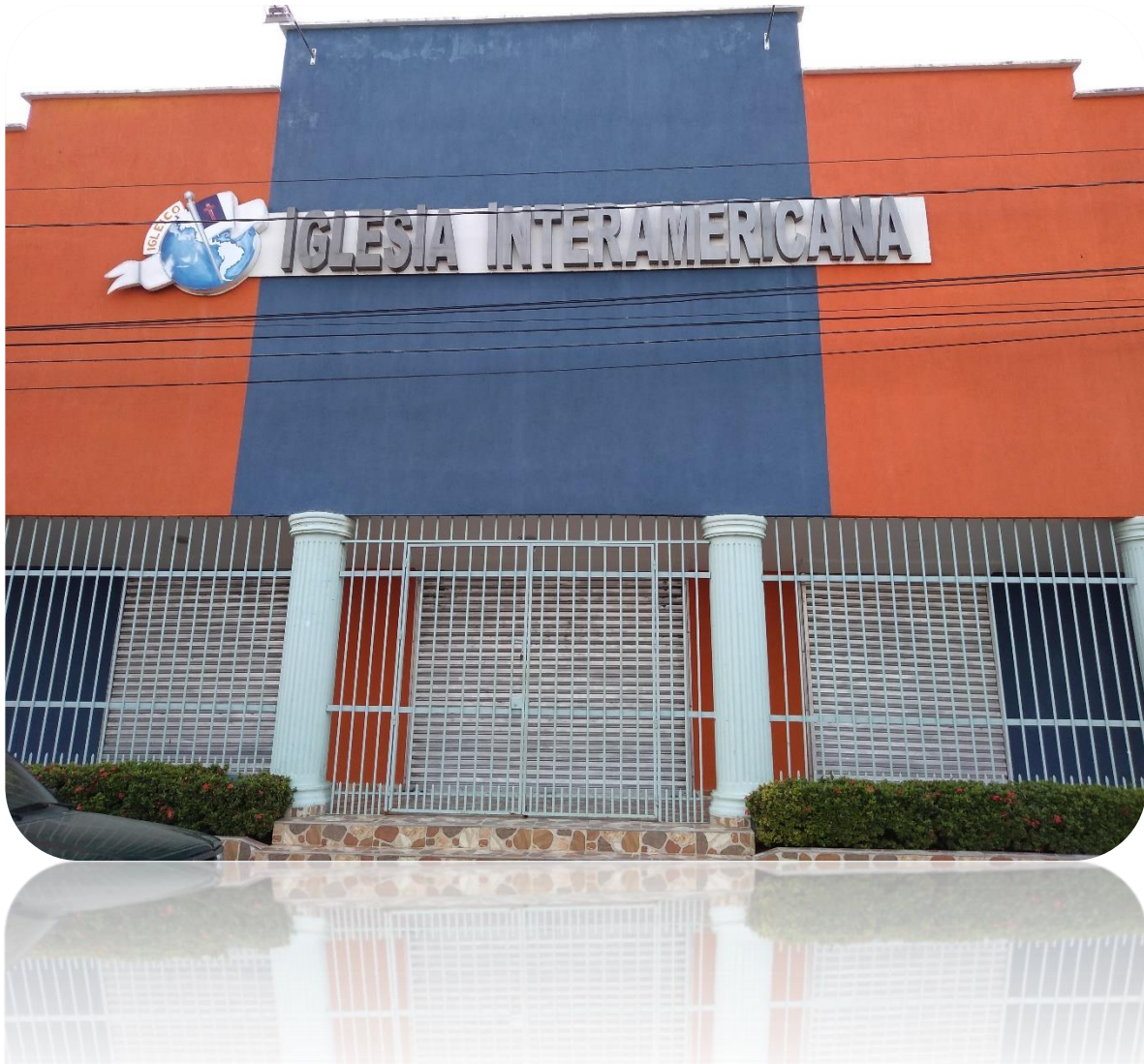
Ilustración 10. Comunidad Religiosa: Iglesia Interamericana Caucaasia/Ant.