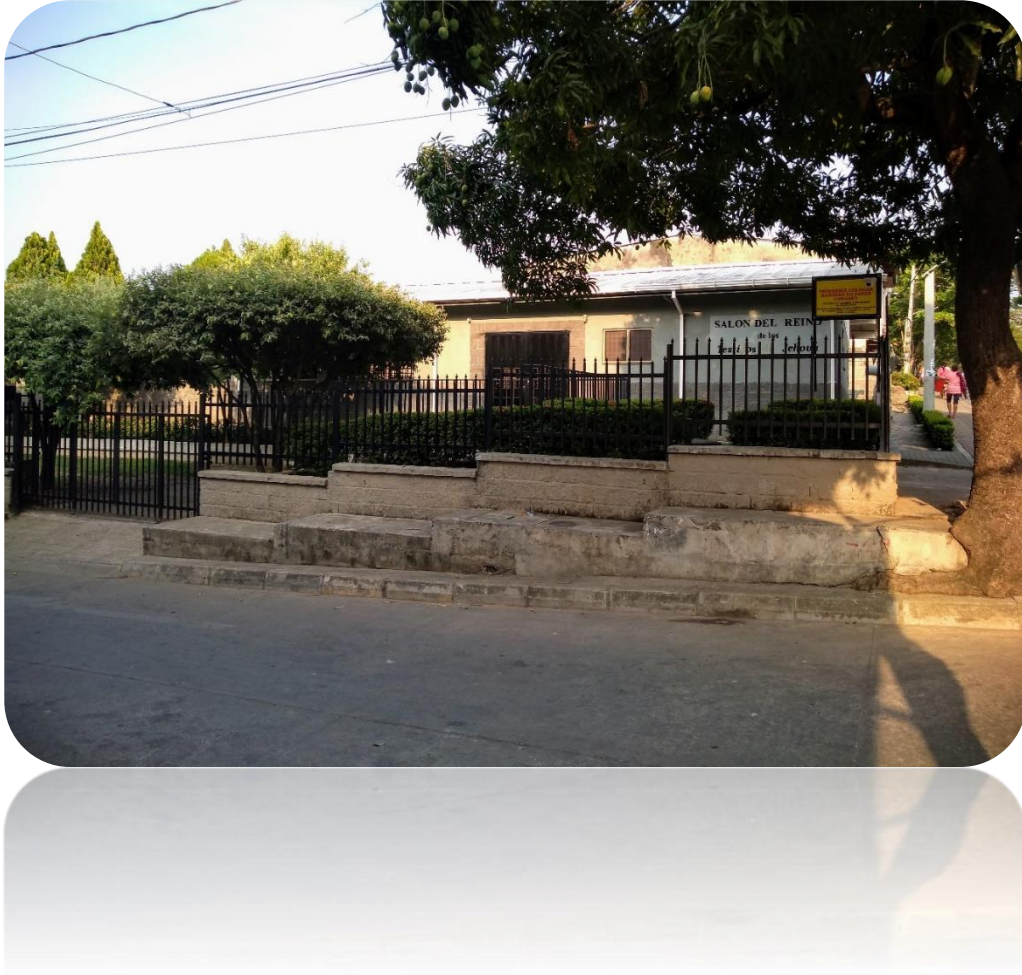
Ilustración 4 Comunidad Religiosa: Testigos de Jehová - Caucasia/Ant.

El diccionario de las religiones define esta comunidad religiosa como: