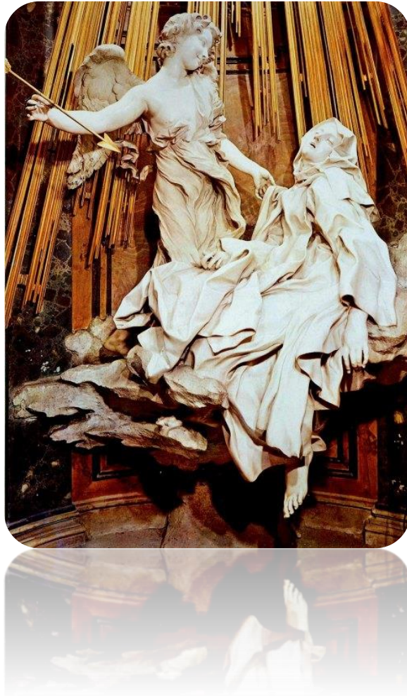
Ilustración 3: Fuente: Gian Lorenzo Bernini. El éxtasis de santa Teresa. Iglesia santa María della Vittoria, Roma, 1647-1651.