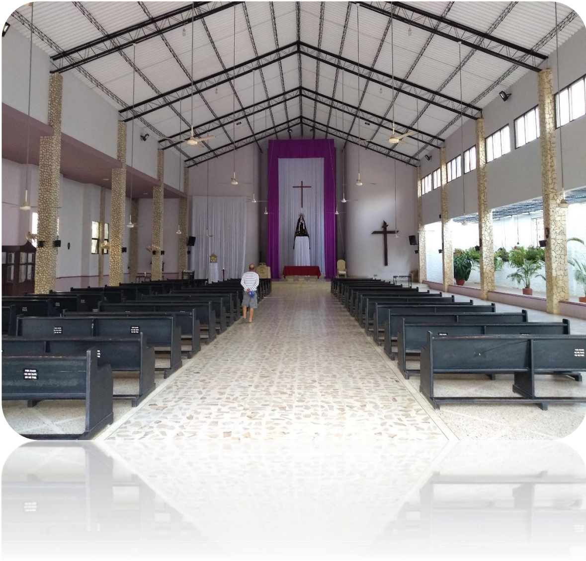
Ilustración 9. Comunidad Religiosa: Iglesia católica Caucasia/Ant.

Cuando una persona entra a este templo, traslada la percepción de persona o la ambiental a ser motivado por su claridad y su evidente silencio en los momentos donde no hay misas; su iconografía en sus imágenes, el simbolismo y la ritualidad a la cruz se hace presente de manera significativa y evidente; sus columnas su orden, su puesta en escena habla de su evidente trayectoria e historia; el cubículo o cuarto de confesiones siempre presente y las figuras o escultura de sus santos, vírgenes hablan por sí solos, es una iglesia católica.