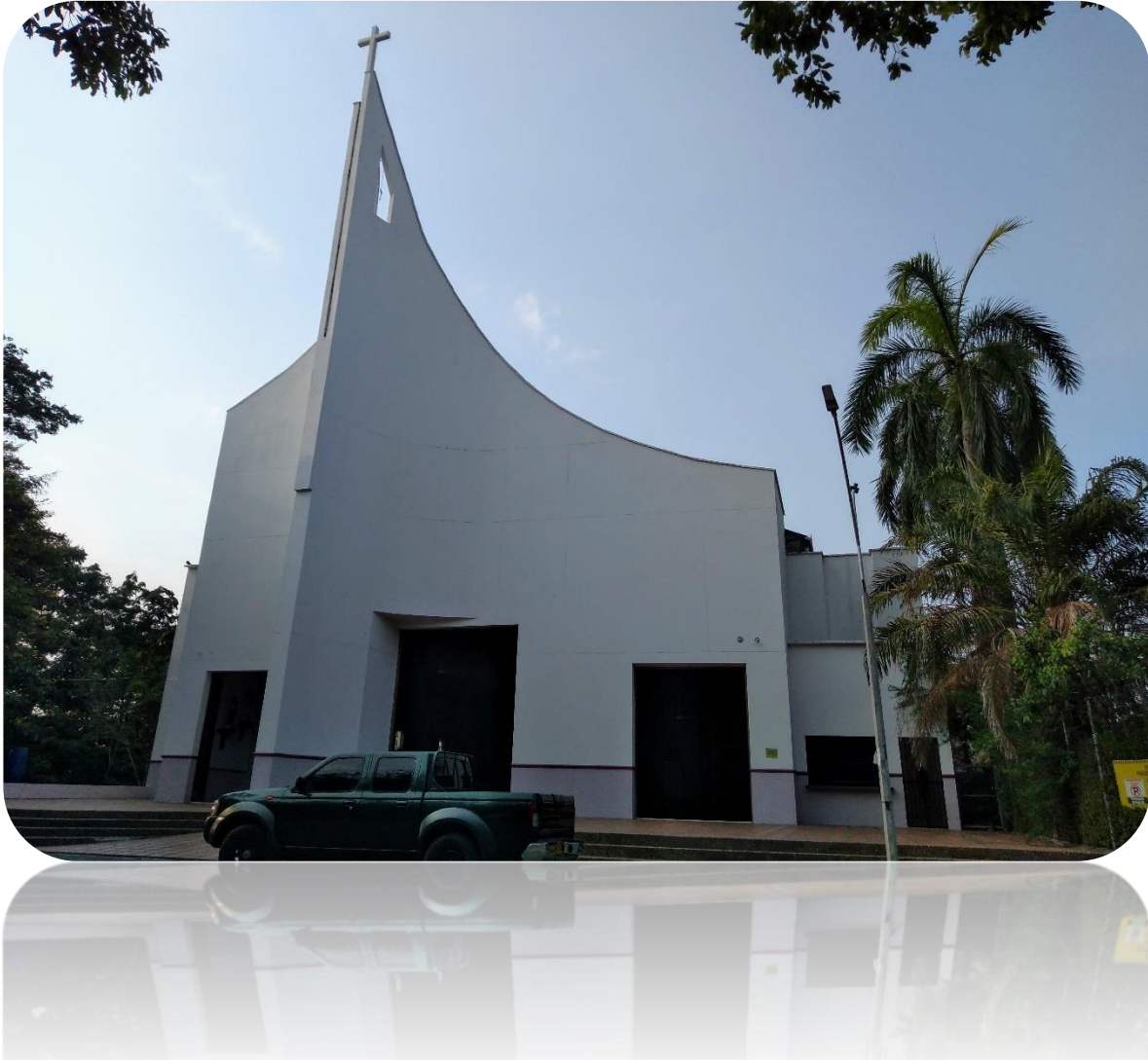
Ilustración 8. Comunidad Religiosa: Iglesia católica Caucasia/Ant.

Es imprescindible registrar las consideraciones del diccionario de las religiones con relación a esta comunidad religiosa, pues nos la presenta como: