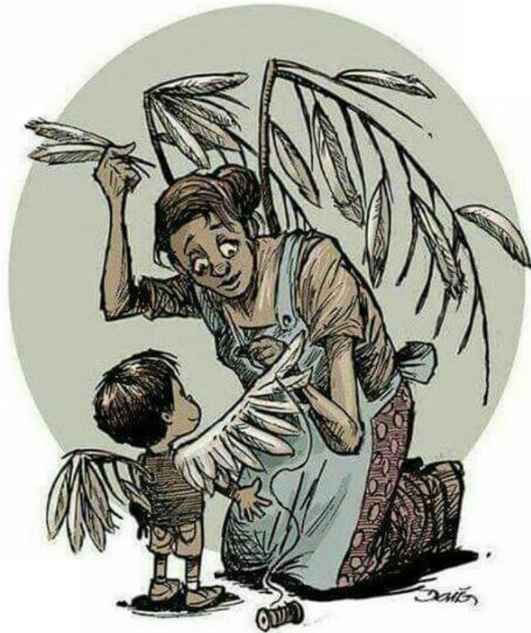
Ilustración 1: Dedicatoria.

Las madres siempre hacen cosas que casi nunca vemos.