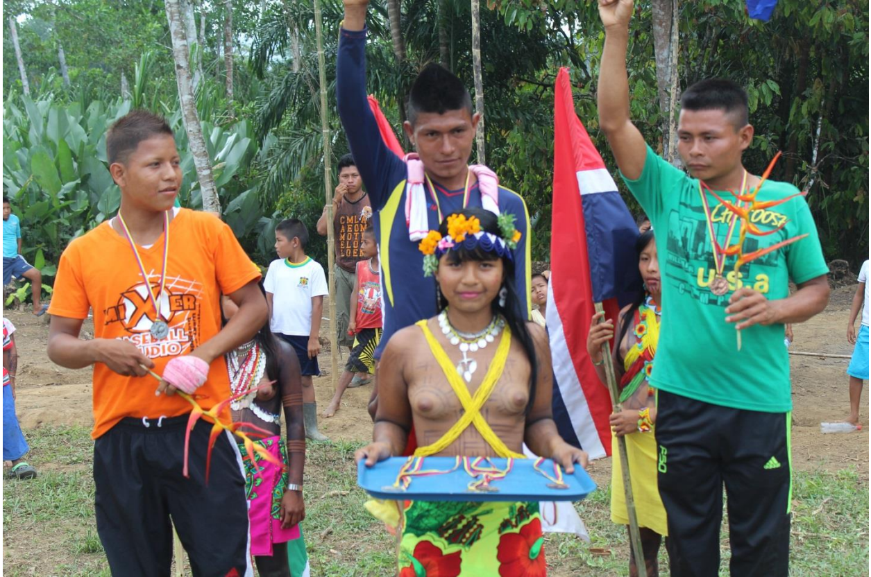
Figura 5. Encuentro lúdico-deportivo con jóvenes indígenas. Junio de 2014.