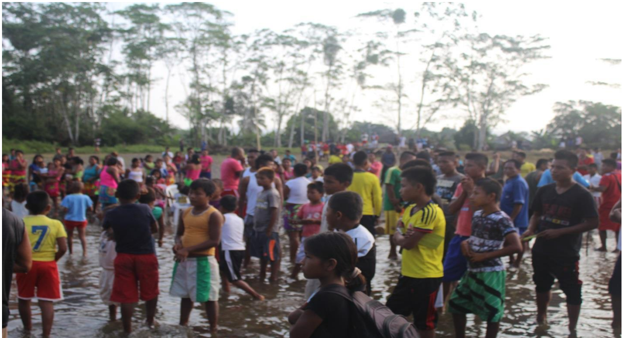
Figura 6. Encuentro lúdico-deportivo con jóvenes indígenas. Junio de 2014.