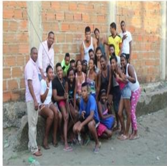
Figura 3. Fotografías por Jhonny Zúñiga. Actividades de los jóvenes. Junio de 2014.