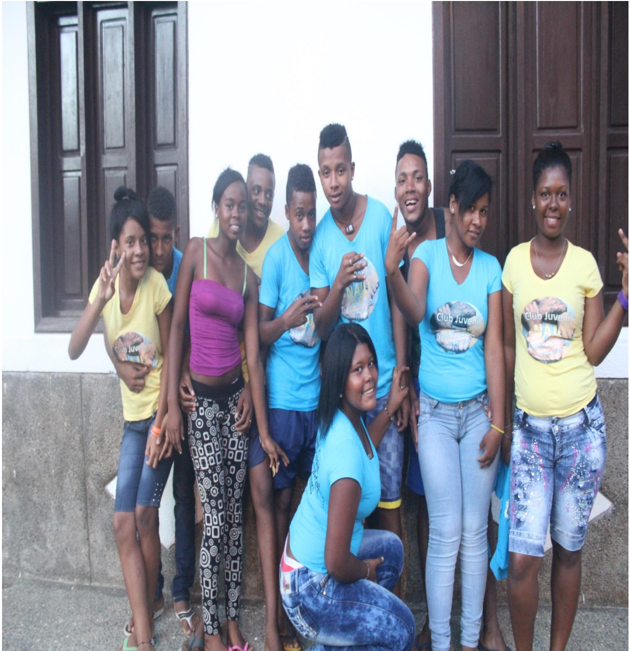
Figura 4. Encuentro con el Club Juvenil NAJU. Junio de 2014.