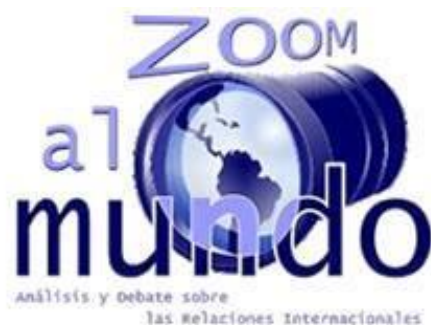
Figura 2. Logo programa radial Zoom al Mundo. Año: 2009

La iniciativa de arrancar un programa de radio propio del Pregrado de Ciencia Política, tenía varios objetivos;