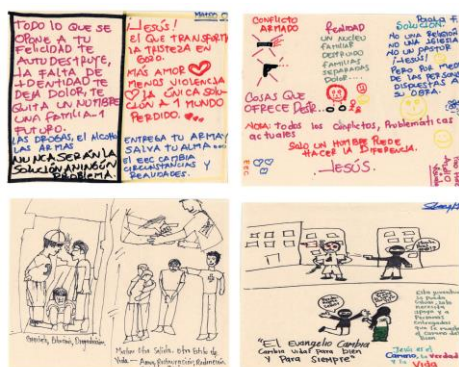
Ilustración 2. Imágenes Murales de Situaciones Grupo de Arte Maranata

Por otro lado, el accionar de los jóvenes tenía como estrategias los mensajes abstractos, es decir, no directo pero si concreto, donde los mensajes de paz, libertad y respeto por la vida eran los que más prevalecían; además del mensaje de no caer en malos pasos y caminos, relacionando ambos con los grupos armados ilegales y la drogadicción. En este aspecto coinciden los tres grupos, lo anterior tiene sus raíces en algunas de sus vivencias grupales e individuales según lo expresados en las entrevistas y el lenguaje que utilizan las obras de teatro, murales callejeros y reuniones grupales donde ensayan sus obras o plantean las acciones.