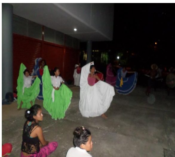
Ilustración 6. Ensayo de danzas con jóvenes y niños de Folclor Latino

modificar ciertos patrones culturales que han reinado en nuestro contexto como el de la violencia, la muerte, las drogas, la pobreza, entre otros que han truncado anhelos, sueños entre otras oportunidades que genera la vida y permiten que el ser humano goce de sus potencialidades y las coloque al servicio de sus semejantes; por eso al momento de socializar sus sueños la gran mayoría de ellos coinciden que quieren una Cauca diferente, donde ser joven simbolice valores sociales, que se recalque el verdadero valor de la juventud.