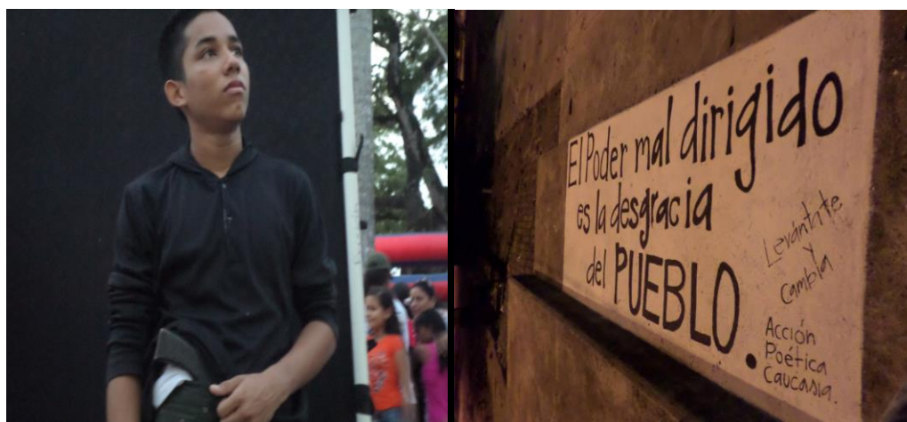
Ilustración 5. Parque de la ceiba octubre de 2015.

Lo referido a lo público se relaciona con los espacios en los cuales la asistencia de las personas está garantizada porque son lugares de encuentro comunitario, como lo son parques, escenarios deportivos, calles concurridas y demás espacios donde su mensaje sea captado por la ciudadanía; por lo tanto hacen uso de herramientas como los dibujos y el teatro, con los que dejan un mensaje de rechazo a la situación negativa que vive el municipio con relación al conflicto armado.