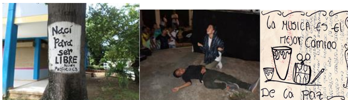
Ilustración 3. Imágenes de izquierda a derecha: mural Levántate y cambia - Parque de la ceiba, obra de teatro grupo Maranata parque de la ceiba, mural de situaciones Folclor Latino

Por otro lado, el accionar de los jóvenes tenía como estrategias los mensajes abstractos, es decir, no directo pero si concreto, donde los mensajes de paz, libertad y respeto por la vida eran los que más prevalecían; además del mensaje de no caer en malos pasos y caminos, relacionando ambos con los grupos armados ilegales y la drogadicción. En este aspecto coinciden los tres grupos, lo anterior tiene sus raíces en algunas de sus vivencias grupales e individuales según lo expresados en las entrevistas y el lenguaje que utilizan las obras de teatro, murales callejeros y reuniones grupales donde ensayan sus obras o plantean las acciones.