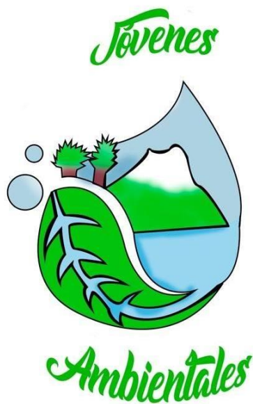
Foto 4 Logo grupo Jóvenes Ambientales