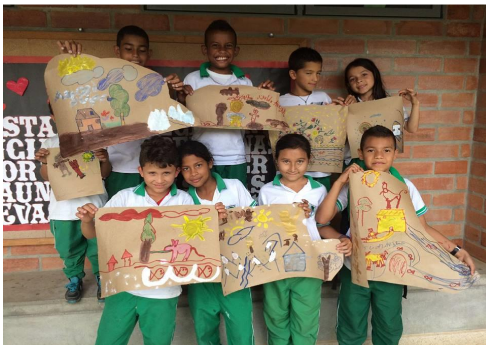
Foto 1 Escolares- Taller socio-imágenes