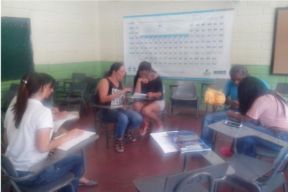
Bedoya, Paulina. (2017). Líderes de víctimas de La Camila. I.E La Camila, Municipio de Bello, Antioquia. [Fotografía 1]

No era el número de asistentes que se esperaba a la actividad, pero es importante destacar que se pudo trabajar las diversas actividades satisfactoriamente, pues la palabra circuló y este respeto por la misma llevo a una gran construcción.