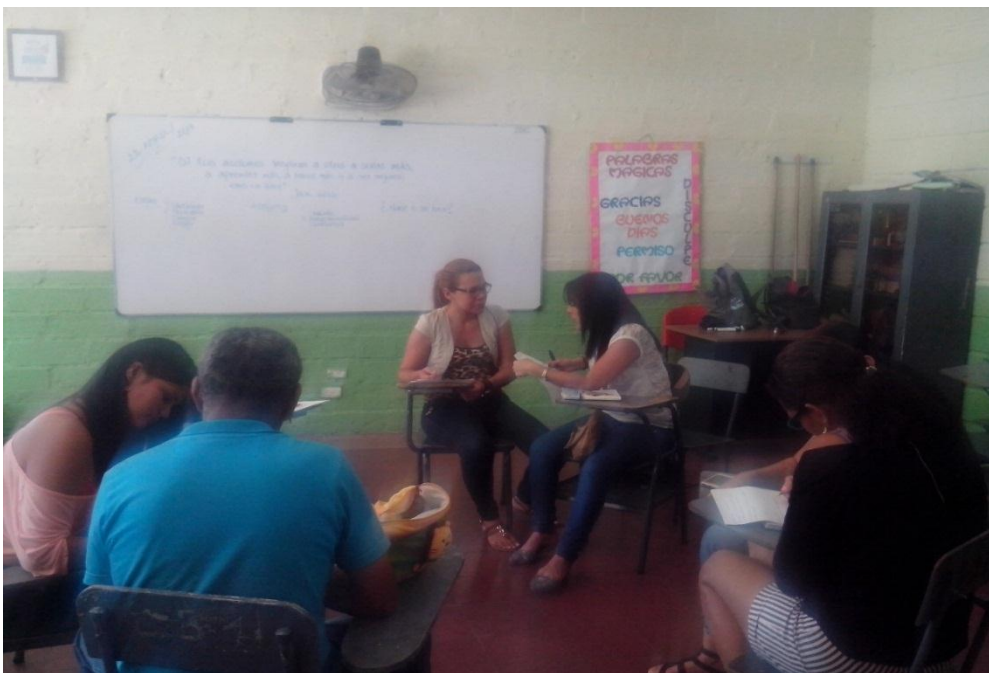
Bedoya, Paulina. (2017). La unión hace la fuerza. I.E La Camila, Municipio de Bello, Antioquia. [Fotografía 3]