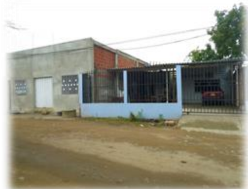
Foto 12. Iglesia del Movimiento Misionero Mundial. 26 de noviembre de 2014

Los otros dos templos, desde la foto 10 hasta la 13, pasaron por esa fase de mejoramiento a la que le trabajan y apuestan constantemente las iglesias. Es mucho más visible la reconstrucción que tuvo la iglesia de la foto 10 y 11, la diferencia entre ambas fotos es de 10 meses, en este periodo se puede evidenciar que el templo ha pasado por un proceso de cambio físico en el cual se ha invertido tiempo, dinero y esfuerzo, la mayor parte de la mano de obra va por cuenta de los mismos conversos, son ellos quienes aportan y a su vez ponen al servicio de la iglesia su conocimiento y trabajo físico en el proceso de construcción del templo, las fotos 10 y 11 revelan pocos cambios en el templo a pesar del tiempo que ha transcurrido entre foto y foto, sin embargo en su interior se trabajó en el revoque y el piso de éste, faltando en la fachada aspectos como la pintura y avisos más grandes alusivos a la iglesia.