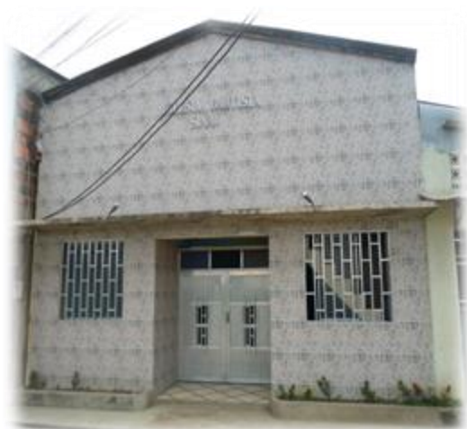
Foto 4. Iglesia Bautista. Foto personal. Noviembre 26 de 2014.

La Iglesia Bautista es la segunda más antigua de Currulao después de la IPUC, su ubicación es central.