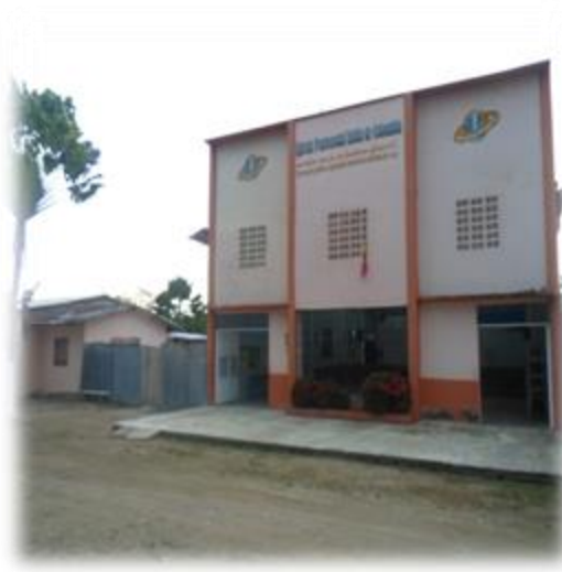
Foto 2. Iglesia Pentecostal Segunda de Currulao. Junio 14 de 2014

En las fotos se evidencia un templo amplio, visible y reconocible a la vista de todo aquel que pase por el lugar, lo cual es una ganancia importante ya que garantiza un reconocimiento de la estructura como tal en relación con la iglesia a que le