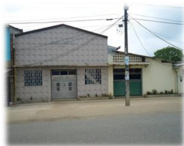
Foto 5. Iglesia Bautista. Noviembre 26 de 2014.

El único templo en el corregimiento de esta denominación siempre ha estado a un costado de la carretera principal del corregimiento, sin embargo, esta característica de centralidad no ha incidido en el crecimiento de conversos como ha sucedido con iglesias como la IPUC, por ejemplo, la cual tiene tres templos