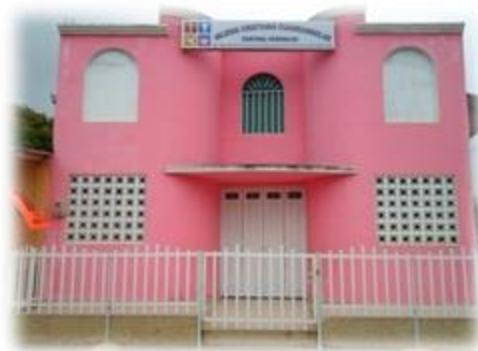
Foto 9. Iglesia Cuadrangular. 26 de noviembre de 2014