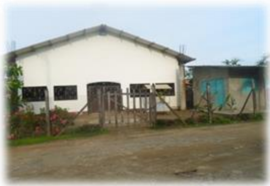
Foto 8. Iglesia Presbiteriana. 26 de noviembre de 2014