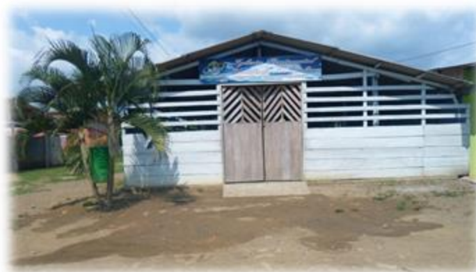
Foto 3. Iglesia Pentecostal Unida de Colombia (tercera de Currulao). Septiembre 26 de 2015.

En el 2012 se creó la tercera IPUC en el casco urbano de Currulao (la cuarta Iglesia Pentecostal está ubicada en la vereda Arcua, perteneciente al corregimiento de Currulao), esta se formó con alrededor de 70 conversos, el criterio de separación fue una vez más el lugar de residencia y por esto quedaron adscritos a esta nueva iglesia los conversos pentecostales que viven en los barrios 1° de Mayo y Vélez, en este último barrio fue donde se instaló esta tercera IPUC.