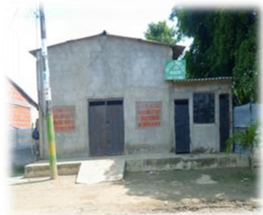
Foto 11. Iglesia Mensajeros de Cristo. Foto personal. 26 de septiembre de 2015