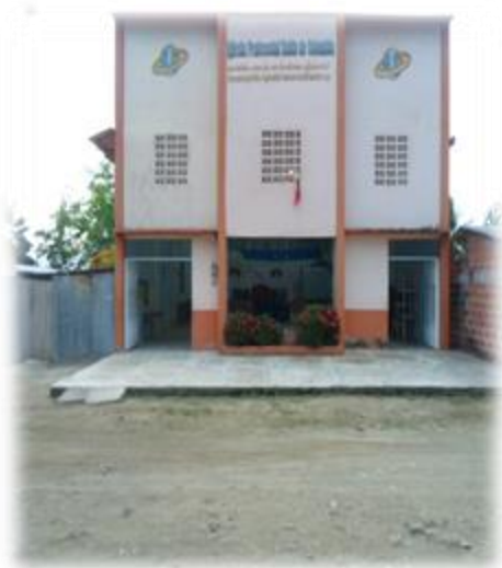
Foto 1. Iglesia Pentecostal Segunda de Currulao. Junio 14 de 2014

Hasta el 14 de enero del año 2000 hubo una sola Iglesia Pentecostal en Currulao. El principal motivo por los que se decidió abrir otra sede de la IPUC (ver foto 1 y 2) tenían que ver con la cantidad de miembros con los que contaban y el poco espacio para albergar a tantos seguidores. Se calcula que el número aproximado era de 300 integrantes.