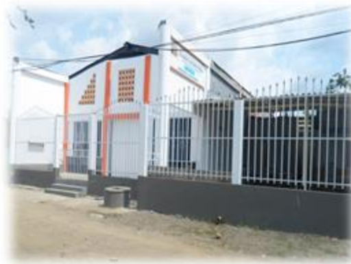
Foto 13. Iglesia del Movimiento Misionero Mundial. 26 de septiembre de 2015

Las forma elevada y con columnas gruesas de los templos evocan la arquitectura griega que para los cristianos remite a fortaleza, esta concepción explica porque casi siempre este tipo de estructuras se asocia a un templo y no una casa, para los cristianos nada mundano, excepto el cuerpo físico, entra al templo ya que allí habita la presencia de Dios, una vez ahí se sienten protegidos de cualquier cosa que intente dañarlos, en este sentido, el templo es una fortaleza simbólica, más que física, donde los conversos están en lugar de transición espiritual que los