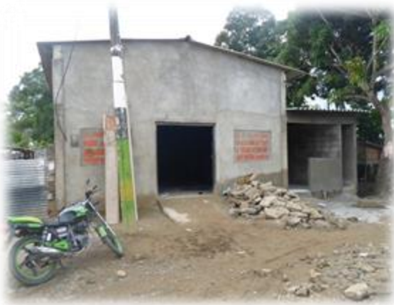
Foto 10. Iglesia Mensajeros de Cristo. 26 de noviembre de 2014

asunto que la institución se llamaba “iglesia y no iglesio”, sin embargo, esta respuesta metafórica y sarcástica se acerca mucho más al porqué del color de este templo, vistas metafóricamente las iglesias se ven como las “esposas del cordero” 26 , el cordero es su Dios Jesús y ellas el complemento de éste, a su vez, desde la lingüística el término “iglesia” es de género femenino, desde estos dos aspectos, el bíblico y lingüístico, la concepción de iglesia se asocia al de una mujer, bíblicamente la mujer fue creada para ayudarlo al hombre y que este no estuviera solo, las instituciones religiosas cumplen con la tarea de Jesús de esparcir el evangelio por todo el mundo, en este sentido le ayudan a que la humanidad lo conozca y acepte en sus vidas como único Dios, ahora bien, mirándolo en este sentido el color que mejor designa todas estas características de iglesia es el rosado, tradicionalmente se asocia este color con la mujer o sus cualidades, así que más que una acción fortuita esta iglesia está representando en su fachada y estructura la exteriorización de un pensamiento doctrinal, filosófico y moral que la caracteriza como institución, es un simbolismo materializado en su templo y esto la hace particular en comparación con las demás iglesias del corregimiento.