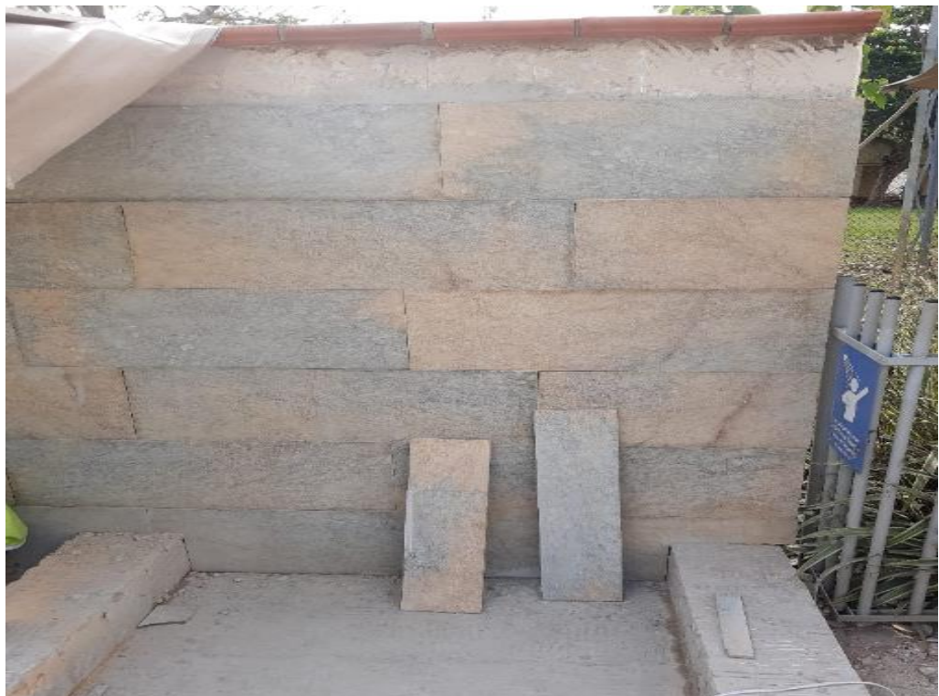
Imagen 9. Instalación mármol tipo royal veta a junta perdida.