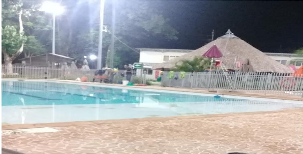
Imagen 3. Trabajo nocturno en el parque recreativo del Bagre.

por los encargados de mantenimiento local, ya que el martes empezaba el servicio en la piscina normalmente.