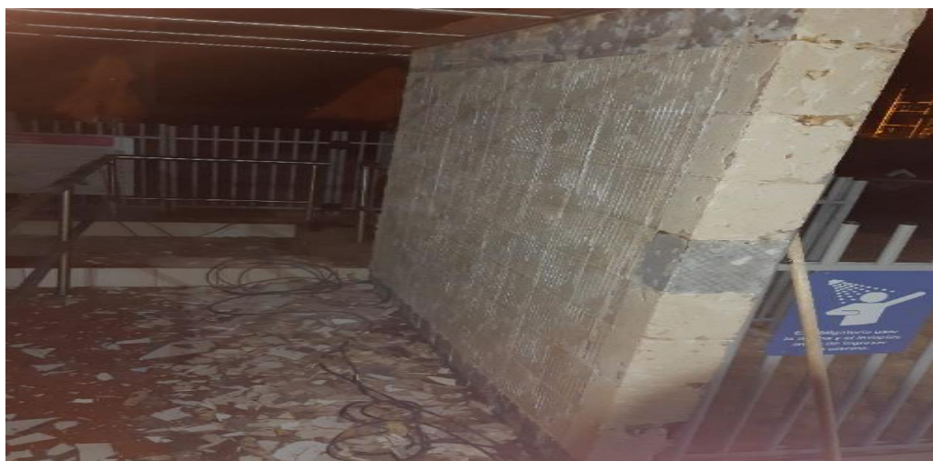
Imagen 8. Retiro de enchape existente.