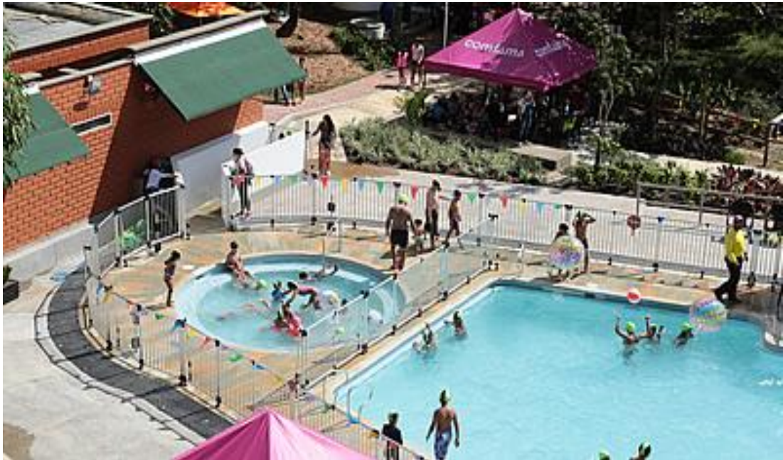
Imagen 6. Parque Marceleth en Segovia.

En el parque de COMFAMA en Segovia (imagen 6), por causa de la pandemia asociada al virus Covid-19, no se pudo realizar las actividades referentes a la remodelación del lavapiés.