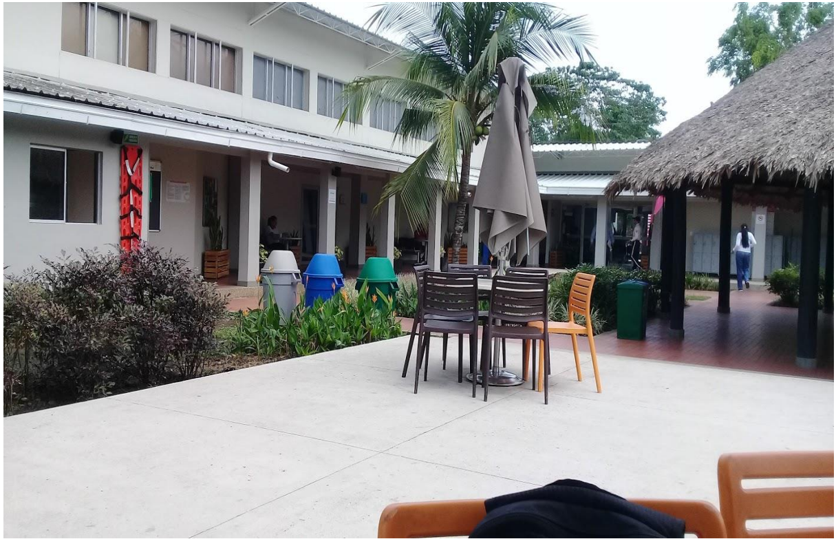
Imagen 1. Parque recreativo COMFAMA en el municipio del Bagre.

Uno de los componentes de la piscina es el lavapiés, estructura necesaria para mantener la higiene y limpieza dentro del lugar; como es la entrada a su servicio más destacado del parque, COMFAMA exige que los materiales usados sean de calidad en uso y belleza, por lo cual determinó que el enchape de estos lavapiés sea en mármol.