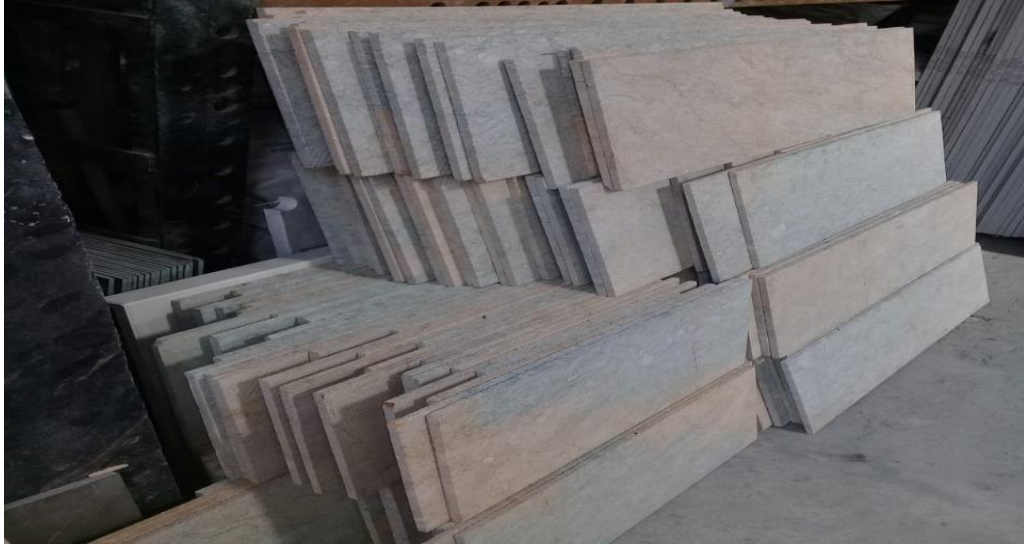
Imagen 7. Mármol tipo royal veta correctamente almacenado.