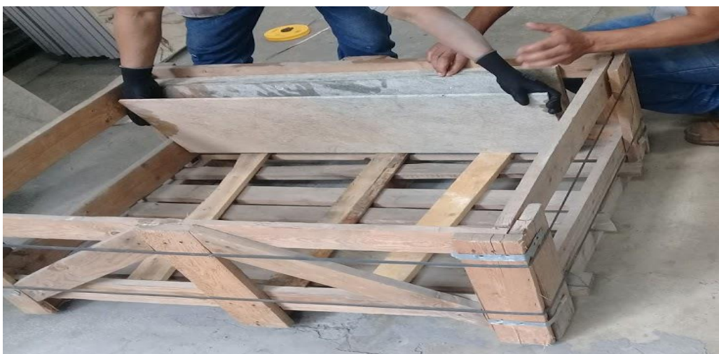
Imagen 11. Embalaje de tabletas de mármol.