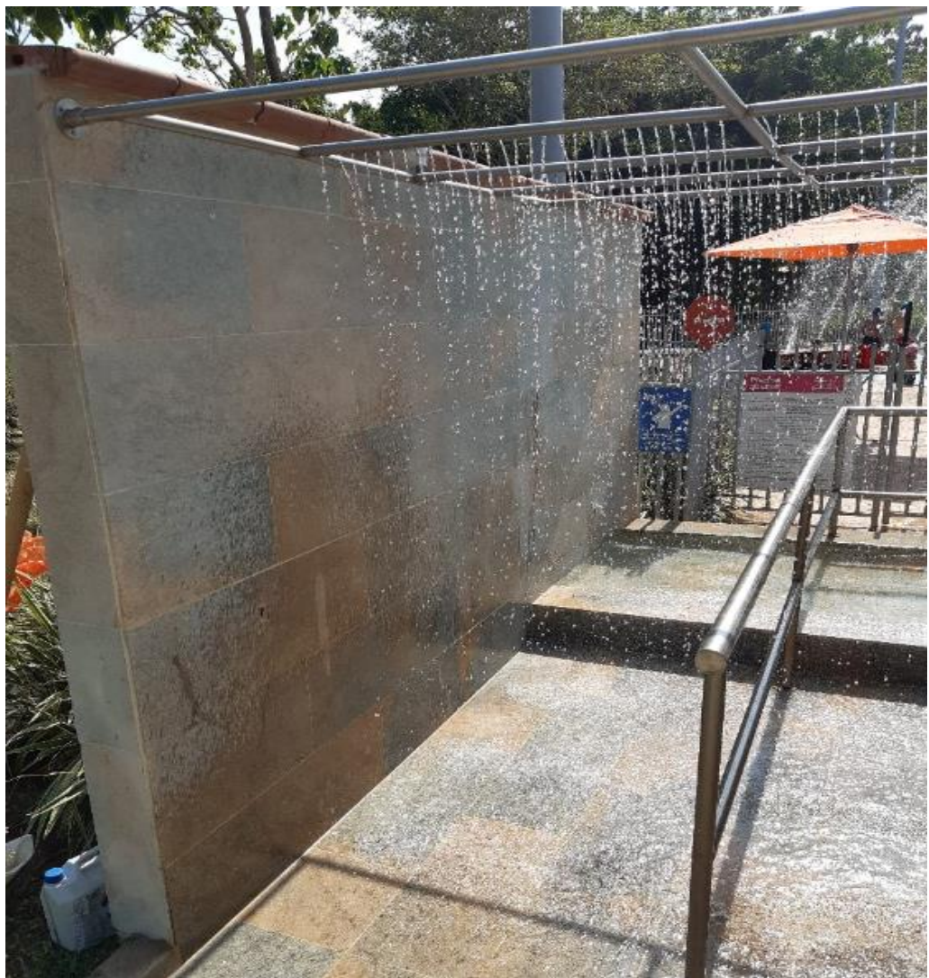
Imagen 10. Enchape en mármol de lavapiés.