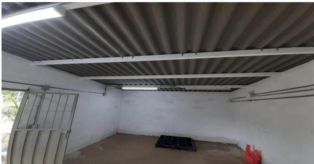
Imagen 4. Bodega en el parque recreativo del Bagre.