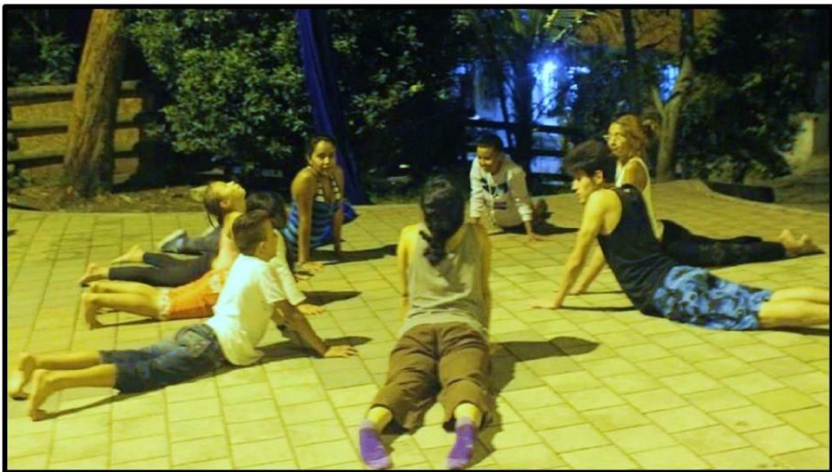
Foto 7. Calentamiento corporal en taller de telas aéreas en el parque el Ajedrez

Algo que caracterizó el proceso de Robledo Venga Parchemos fue su trabajo en exteriores, en los espacios públicos, ya que gracias a esto lograron visibilizarse más y atraer niños, niñas y jóvenes que estuvieran interesados en hacer parte de algo, en aprender, en conocer e ir transformando espacios y con esto también la forma de percibir, estar, ser y habitar el territorio.