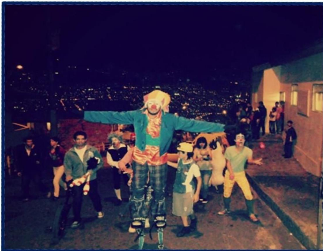
Foto 2. Primera Lunada Artística y Cultural en Robledo Aures 3 .

En sus principios, la Lunada Artística y Cultural, se pretendió realizar en un parque ubicado en el sector conocido como El Depósito, sin embargo, no fue posible por enfrentamientos que se daban entre las bandas que operaban allí, y por esto deciden realizarlas en un predio ubicado detrás de la Iglesia “San Francisco de Sales”, más conocida como la iglesia de Aures, la cual era también una frontera invisible pero a su vez una oportunidad para la apropiación y resignificación del espacio; como lo expresa un integrante de Robledo Venga Parchemos