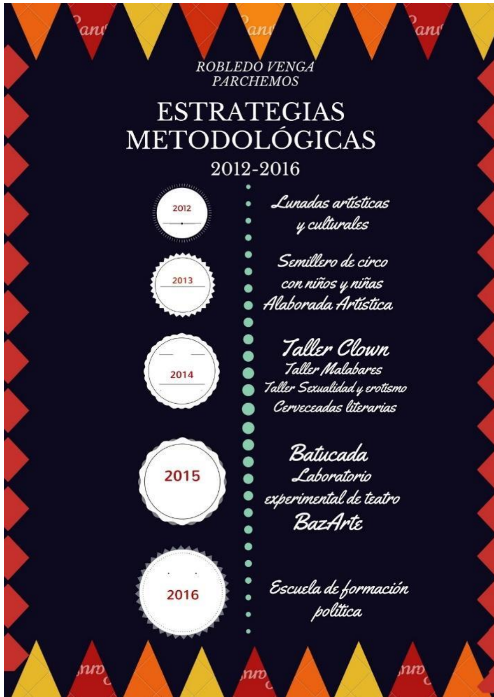
Foto 8. Estrategias de RVP, 2012-2016