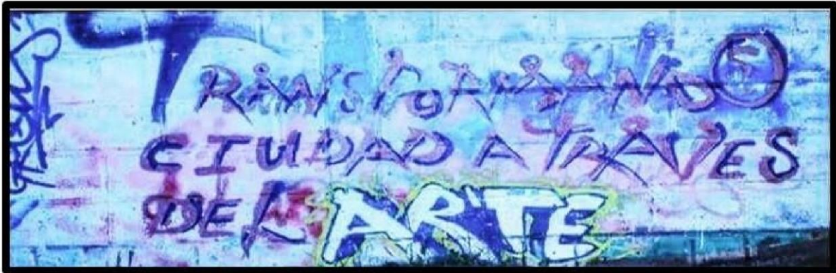
Transformando ciudad a través del Arte

El 31 de octubre del 2013 fue la primera Lunada Artística y Cultural de Robledo Venga Parchemos en el TAL, la cual nombraron “Carnaval de las brujas”, realizada con el apoyo de la Articulación Juvenil de la zona nororiental y otros jóvenes del barrio. La convocatoria se hizo a través de carteles hechos a mano, invitaciones voz a voz y un evento en Facebook. El TAL estaba a reventar, payasos, chirimía, cuentería, olla comunitaria; ese día renació la magia en ese lugar que por tanto tiempo fue abandonado. A partir de ese momento la mayoría de las actividades de Robledo Venga Parchemos se empezaron a hacer allí. Los días domingo, cada ocho días, se realizaba el Semillero de circo con los niños, niñas y jóvenes, y cada mes las Lunadas Artísticas y Culturales.