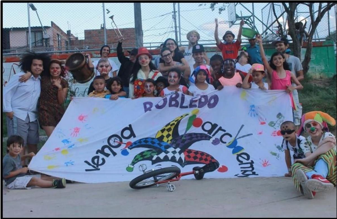
Foto 6. Final de una marcha carnaval por el barrio.

Durante este año (2014), el barrio estaba en medio de confrontaciones armadas entre algunos grupos delincuenciales que hacían presencia en el territorio y que se disputaban el control de la zona provocando que los jóvenes se desplazaran para otros lugares o cambiaran los horarios en que se reunían como una forma de protegerse y de seguir persistiendo en su iniciativa.