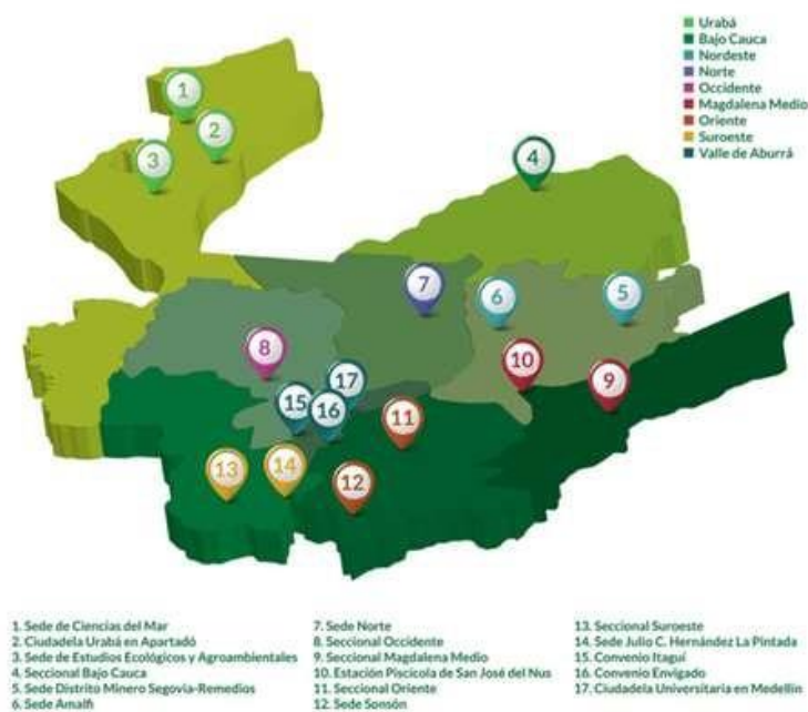
Figura 1. Mapa de regionalización.