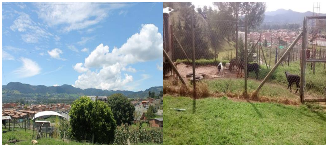
Vista del municipio de La Ceja, desde el albergue municipal