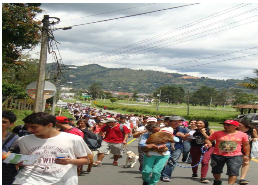
Caminata canina 1- foto por Juan Manuel Bedoya 2013

A partir de la cohesión del grupo respecto a los temas de la protección animal, surgió la propuesta de la realización de un evento anual, con la finalidad de recoger fondos para la esterilización de la fauna callejera del municipio, para lograr evitar un mayor número de animales en situación de calle y abandono, dicho evento fue la caminata canina anual, cuya primera versión fue en el año 2013, en la cual los voluntarios se encargaron de crear contacto con comerciantes y centros veterinarios del municipio quienes patrocinan el evento desde entonces y de igual forma se ha contado con la ayuda de los diferentes medios de comunicación locales, como radio, televisión, redes sociales, etc. En este evento se han vinculado también músicos, cuenteros, y agentes artísticos que brindan sus servicios desinteresadamente con la finalidad de impactar en la fauna callejera.