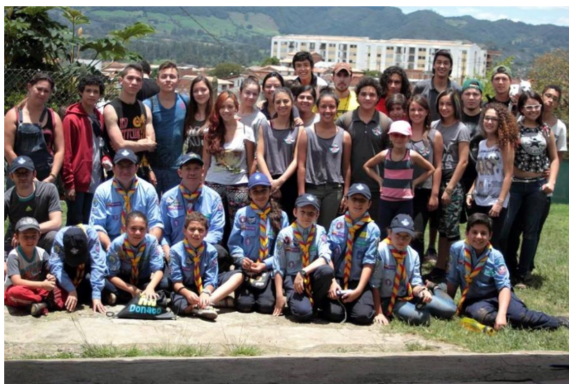
Voluntariado 2017, grupo de voluntarios del albergue y grupo scout ori3n 2017

El grupo de voluntarios del albergue canino y felino ha logrado establecer rutinas y acciones que lo diferencian de otros grupos del municipio, la alternativa de realizar sus labores en un ambiente ecológico, de preocuparse por la fauna callejera y abandonada y el poder realizar intercambios entre los miembros del grupo, resulta atractiva para los nuevos. En términos de alternativas para la juventud suponen una novedad debido a que no se cuenta en el municipio con otras que contengan estas características, así mismo el grupo de voluntarios cuenta con contactos y colaboraciones con otras instituciones y grupos del municipio como los son los grupos de scouts, dichos grupos se han vinculado de diversas formas, principalmente a la hora de hacer jornadas específicas como las caminatas caninas anuales y las jornadas de limpieza y mantenimiento de las instalaciones físicas del albergue.