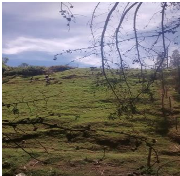
Sendero del alto. Foto por el investigador, 2017.

De igual forma existen varios puntos de referencia a la hora de tomar los caminos y ubicarse, por ejemplo, está un palo de lulos que servía como punto en el que se tomaban varios caminos, si bien en la actualidad el árbol de lulos ya no se encuentra, el punto de referencia y el nombre aún existen. El morro de bmx es un espacio por el que se transita recurrentemente y cuenta como referente principal con un espacio adecuado por quienes practican este deporte, (unos obstáculos y cerros para practicar bmx). El morro de Montesol es un sector en el cual se ve el barrio Montesol y en el que se cuenta con un espacio abierto amplio para que los caninos corran y jugueteen.