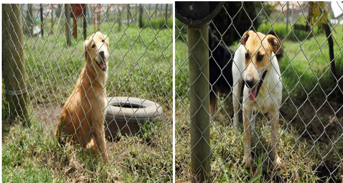
Caninos en el cerco construido por los voluntarios- fotografía grupo de voluntarios 2017

Un asunto relevante de mencionar es la vinculación principalmente de jóvenes a las actividades e iniciativas del grupo de voluntarios, entre sus acciones directas en el albergue municipal están: la construcción de un cerco para que los perros salgan todos los días a pasear, mientras se realizan las labores de aseo de las instalaciones, dicho cerco se realizó con ayudas voluntarias de personas de la comunidad Cejeña y con la gestión de los voluntarios.