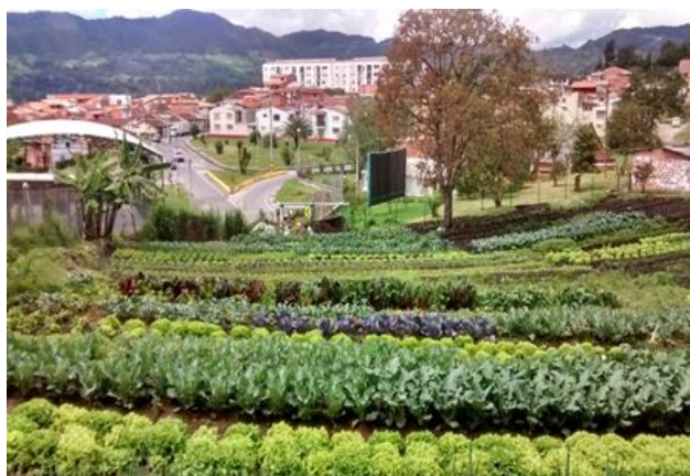
Huerta del centro día gerontológico limite inmediato del albergue municipal 2017

Finalmente, resulta relevante mencionar tanto como los voluntarios se encuentran identificados con estos espacios del albergue municipal, así como de los sectores aledaños en los cuales llevan a cabo sus paseos caninos, trascendiendo la construcción social a los aspectos formales del territorio, ya que los integrantes del grupo de voluntarios han estado involucrados en asuntos políticos que determinan el futuro inmediato de estas zonas, pues al ser predios municipales se contempla en la actualidad la posibilidad de crear un proyecto de vivienda. Estos espacios son significativos para