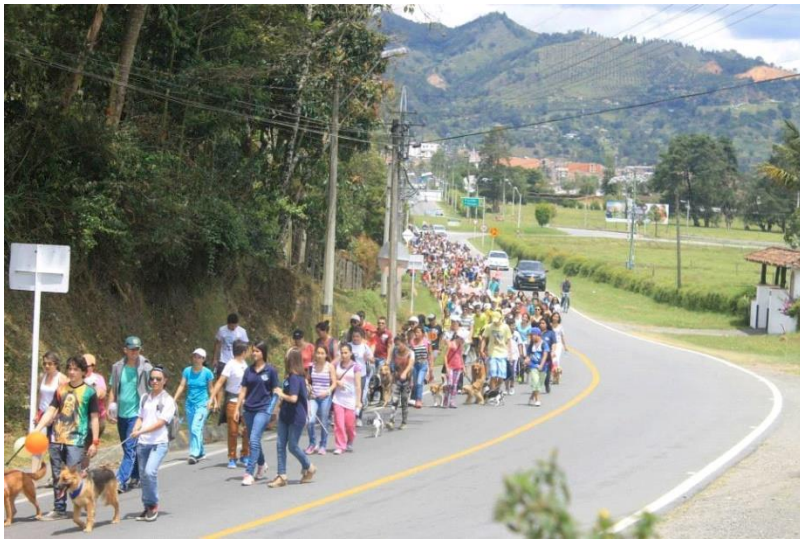
Caminata canina anual – municipio de La Ceja grupo de voluntarios albergue canino y felino 2014-2015.